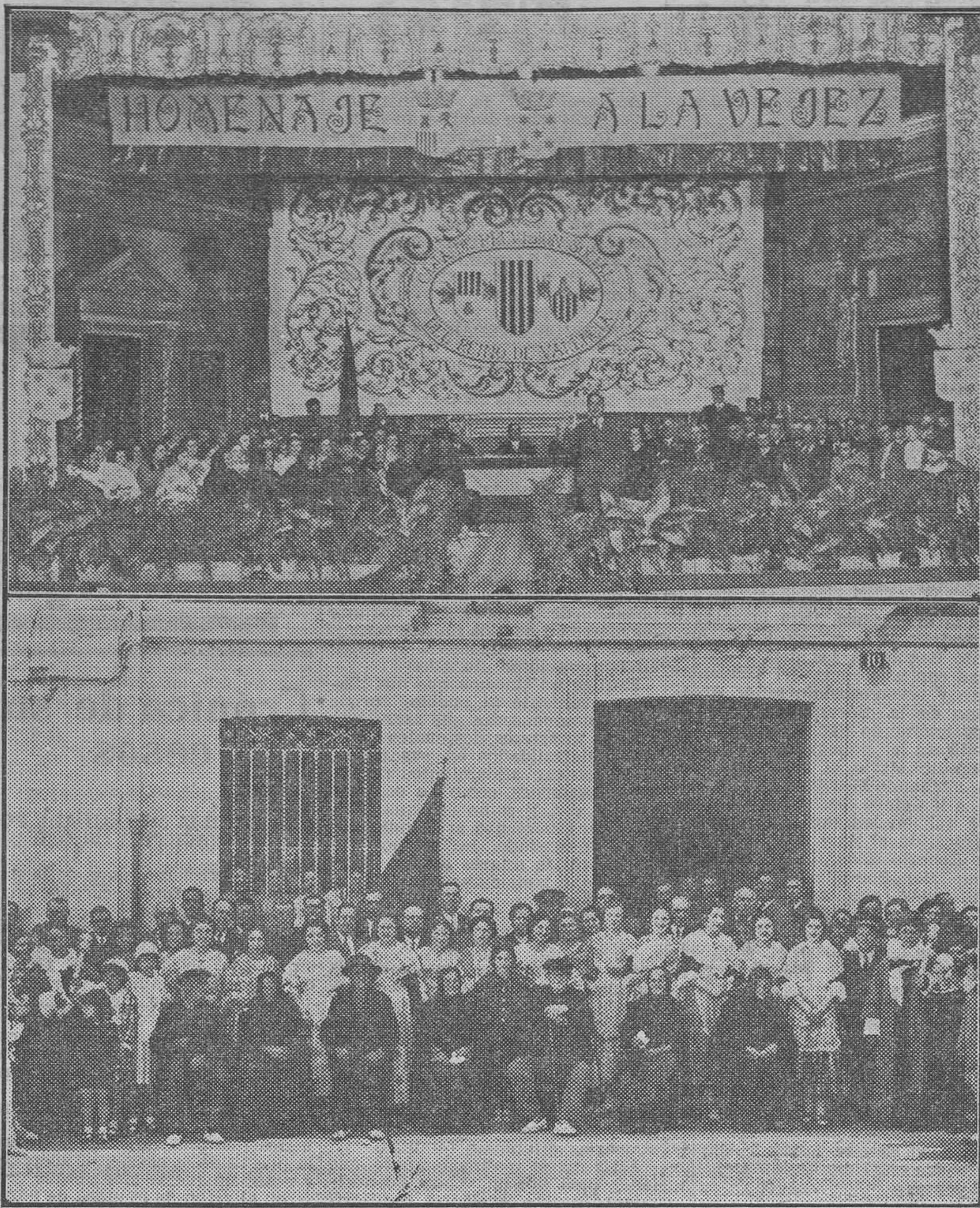
Aspecto del escenario del teatro Cortis en que se celebró la brillante fiesta el pasado domingo. — Los ancianos pensionados con las autoridades y la Junta de la Sucursal de la Caja de Previsión, al terminar el acto

bios de situación a que da lugar el argumento. Todo llevado para que los tipos (verdaderamente humorísticos casi todos) tengan un marcado perfil cómico. El diálogo es vivo y chispeante, haciendo que la tensión de risa no se aleje del espectador en toda la obra.