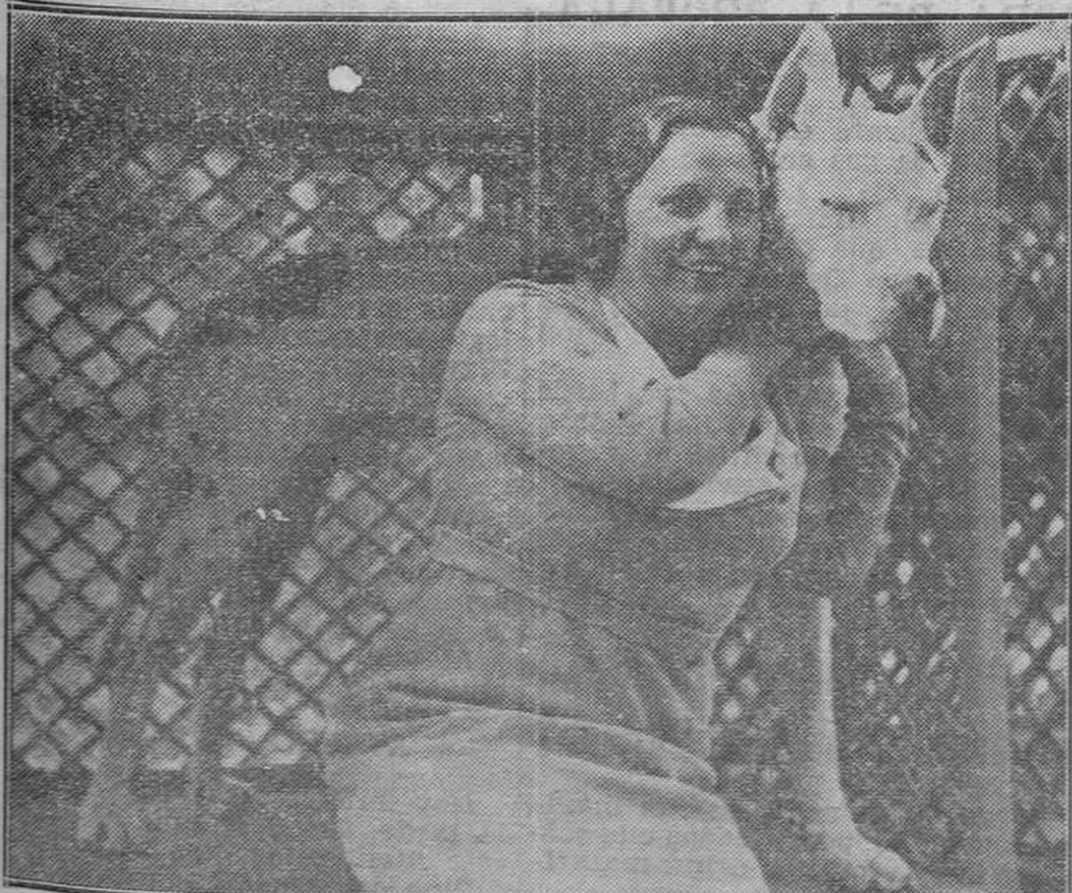
Una expositora con su magnífico ejemplar de perro dogo, probable ganador de uno de los primeros premios en la Exposición Canina de Madrid.