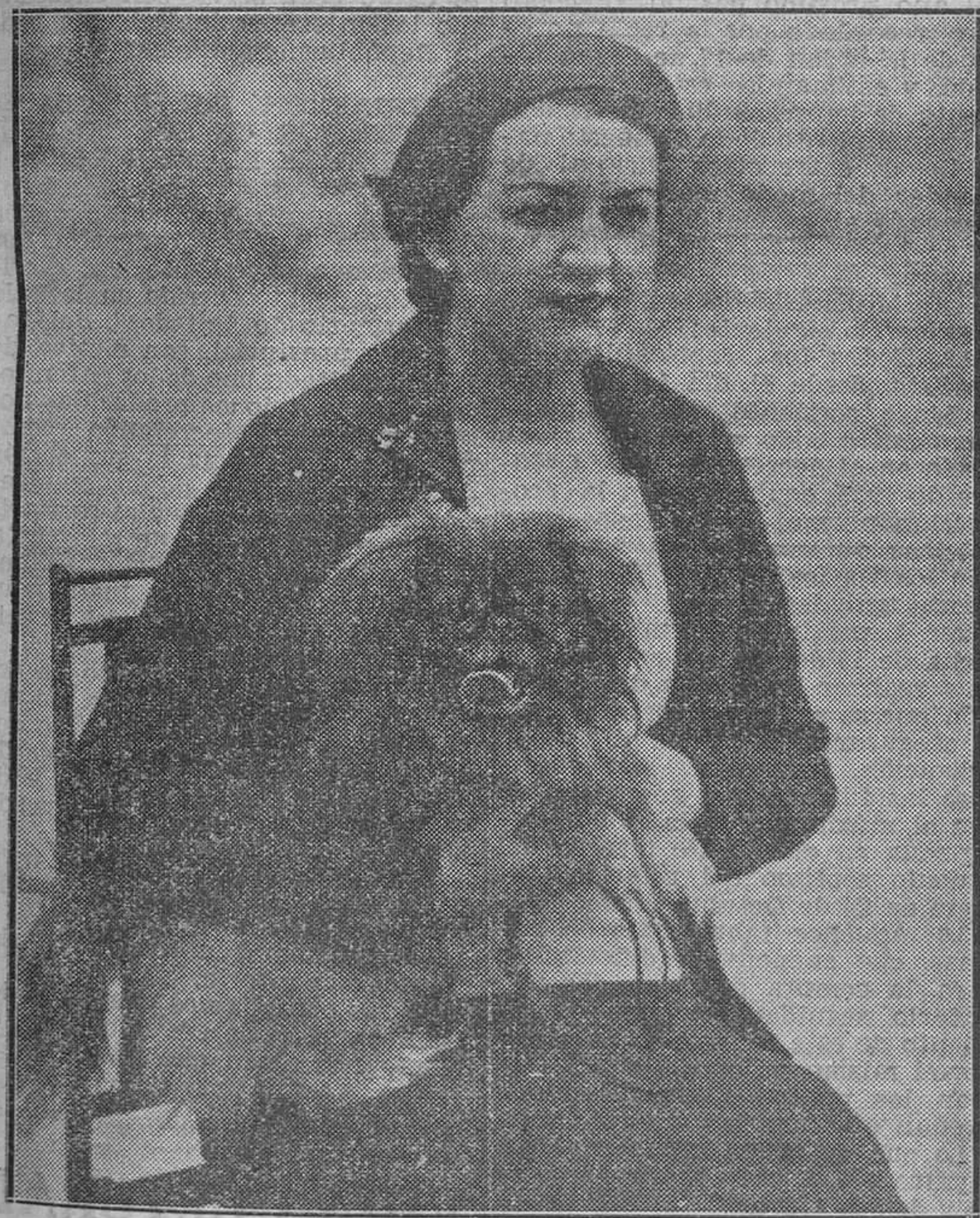
Bonito ejemplar de pekinés.