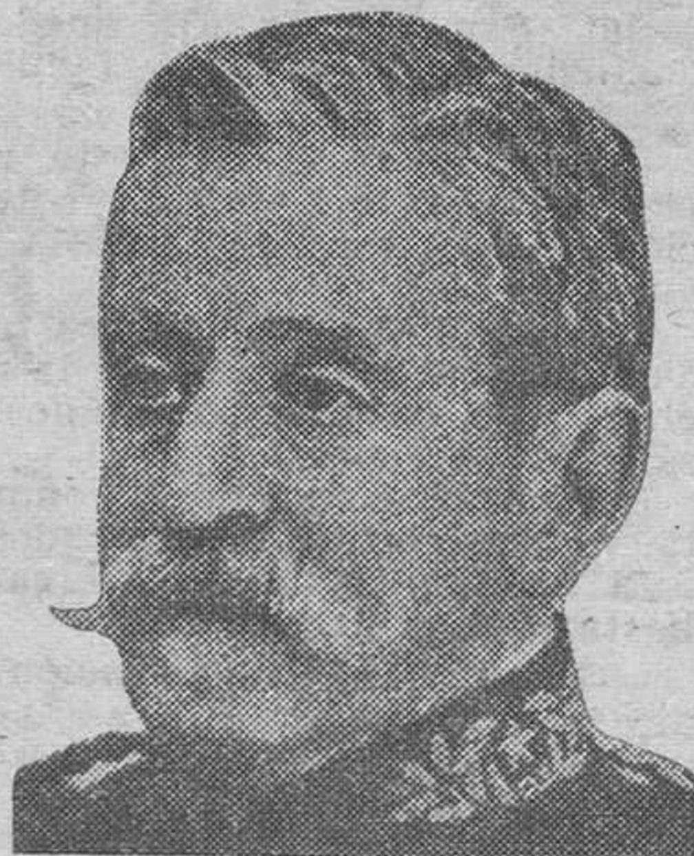
El ilustre dramaturgo don Leopoldo Cano, autor de "La Pasionaria", recientemente fallecido en Madrid

Descanse en paz la respetable, abnegada y ejemplar señora.