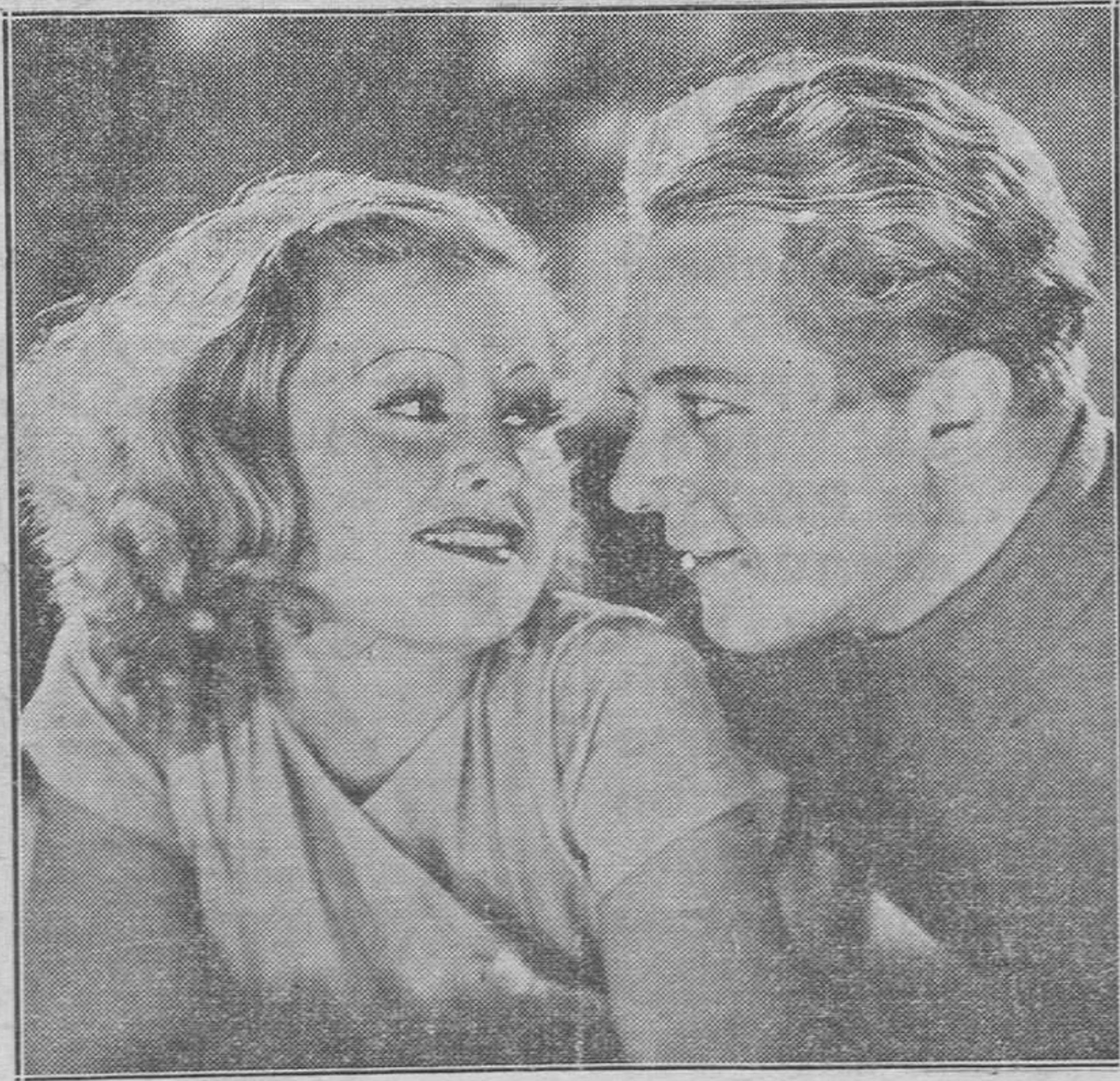
Lillian Harvey, la artista predilecta de los públicos, que siempre ha sido uno de los sucesos resonantes del afortunado cinema de la antigua Bajada de San Francisco, vuelve la semana próxima, radiante de belleza y gracia, a dejar la estela de su simpatía de gran artista. El lunes venidero será esperado con impaciencia por la legión de admiradores de la inimitable estrella germana