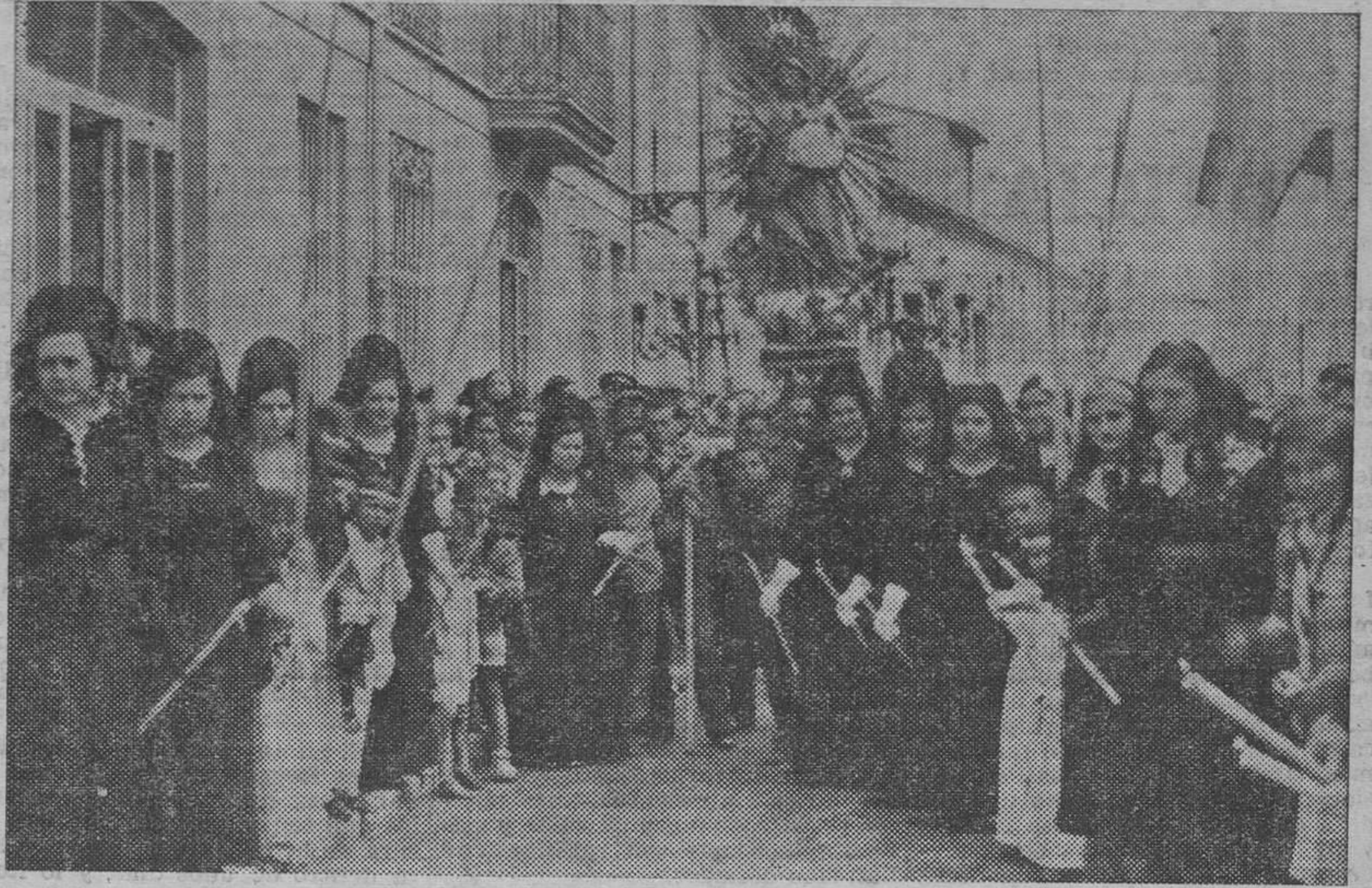
La procesión del Encuentro, en Godella; grupo de clavarieras.

Muchos españoles se quedaron asombrados al saber que Inglaterra comenzó, hace dos años, a exportar claveles y rosas, que es en una minúscula isla del grupo de Zelanda, en Dinamarca—entre el 55 y 56 grado de latitud—, donde el mago Dines Poulsen, con métodos de pululación y fecundación artificial, ha creado su prodigiosa rosaleda, donde se producen variedades nuevas, no concebidas ni imaginadas por la Naturaleza; que la Sociedad Nacional de Horticultura de Francia, revalorando y poniendo de moda una flor españolisima, la dalia, ha conseguido que se hayan llegado a crear cuatrocientas variedades diferentes, logradas en climas tan inclementes como los del norte de Francia, Bélgica, Inglaterra, Holanda y Norteamérica... ¡Cuántas otras noticias po-