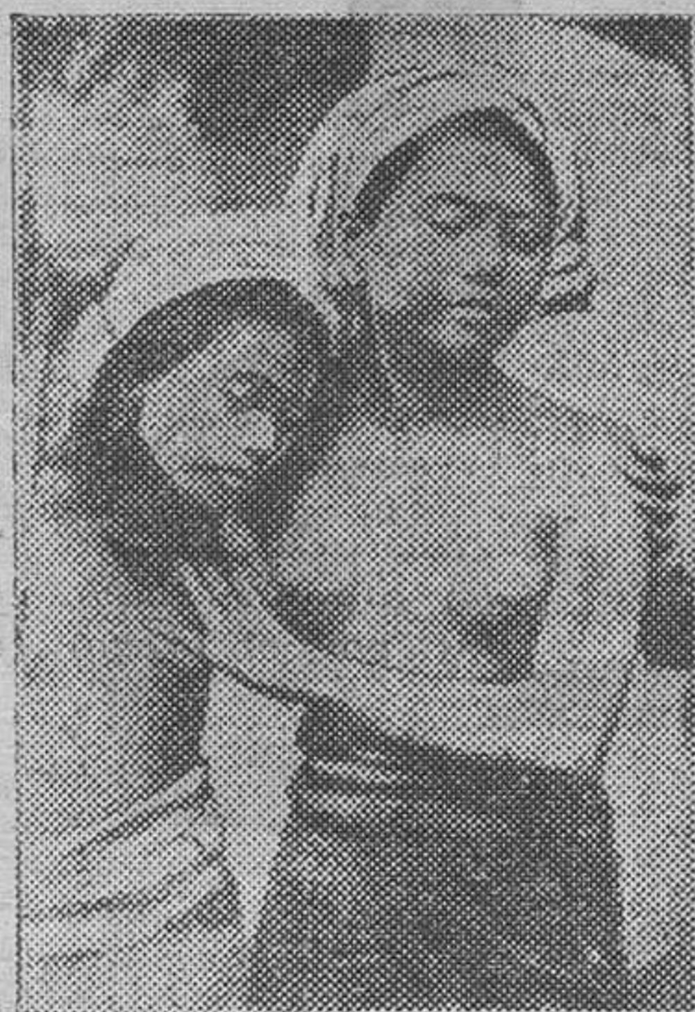
Dos Princesas del Africa, hijas del Rey de Abeocouta, posando ante el objetivo fotográfico

Cuando el "rey de la noche", acostumbrado a ver las chozas de sus súbditos y las insignificantes edificaciones de los colonos se halló en París, se asombró extraordinariamente. Pensó que se encontraba en un mundo donde no podría llegar el poder de sus dioses. Por otra parte, los magos conservadores de la moral religiosa no estaban con él. Comenzó pues, a salir durante el día, admirando la vida parisina y la que llevaban los que le acompañaban en las invitaciones de las autoridades francesas. Lo mismo le ocurrió al rey de Louda Angola, que permitió bien pronto que sus mujeres le acom-