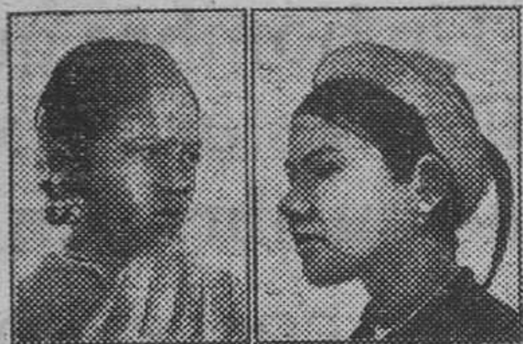
Dos Reinas africanas: una, esposa del Rey Louda de Angola, y la otra, del Rey Abeocouta, viviendo en la europea y descansando establecerse en París

La prensa francesa anuncia estos días que tres reyes negros del protectorado francés del Africa visitarán París el próximo mes, acompañados de sus esposas. He aquí un nuevo tema de humorismo que dará abundante materia en esta época de luchas políticas y choques sangrientos en las calles. Se trata de algunos jefes de colonias africanas que conservan sus títulos reales sobre los de su raza, sin tener substancialmente ninguna autoridad política, que ejercen los go-