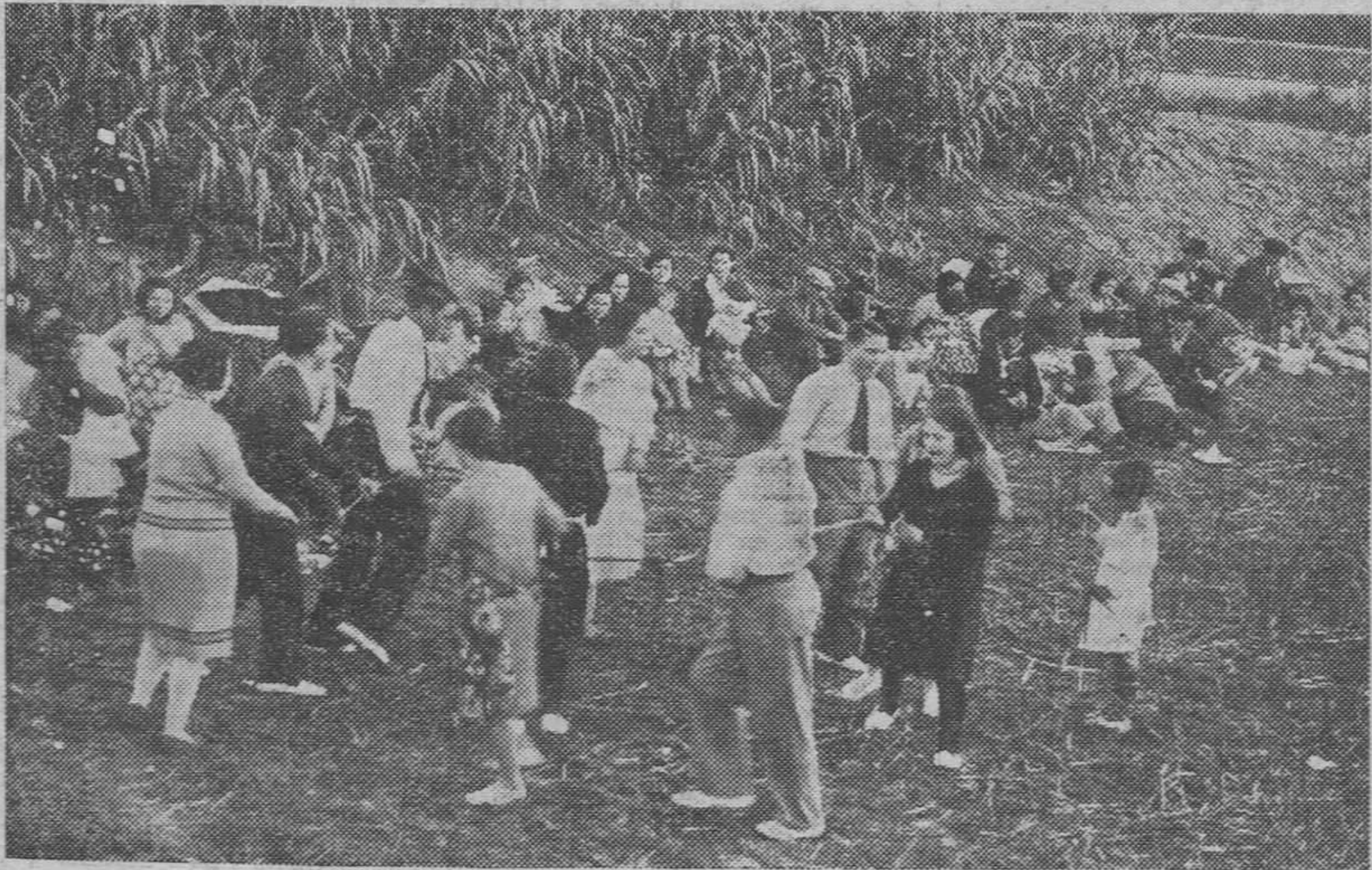
El tiempo favoreció el domingo la fiesta "monera". He aquí uno de los infinitos grupos que se esparcieron por los alrededores de la ciudad, para saborear la succulenta merienda.

Ante el conflicto planteado en los Astilleros de la Unión Naval de Levante, y en el transcurso del mismo, se ha propalado la noticia de que el Jurado Mixto de Metalurgia, Siderurgia y derivados, era el causante de lo ocurrido en dicha factoría, por decirse haber autorizado éste el despido por huelga ilegal de los aprendices calentadores de remaches. Como primera aclaración hay que hacer constar de una manera clara y terminante, que el Jurado Mixto no sabe absolutamente nada en lo referente a dicho conflicto, pues ni los vocales patronos ni los obreros han sido convocados para nada. Ahora bien; de una manera particular los vocales obreros del Jurado Mixto sabemos que con fechas del 24 y 26 de Marzo próximo pasado, la dirección de la Unión Naval de Levante comunicó a la presidencia del Jurado el conflicto planteado por los calentadores de remaches, y que la presidencia del Jurado convoca para el 27 a la dirección de la Unión Naval y a los padres de los aprendices como representantes legales de los mismos, sin convocar para nada absolutamente a los vocales del Jurado, como debía de haberlo hecho, arrogándose con ello más autoridad que en forma ninguna puede tener. También sabemos de la misma forma que, entre las conclusiones acordadas, figura la de que los padres que asistieron en número de ocho se comprometían