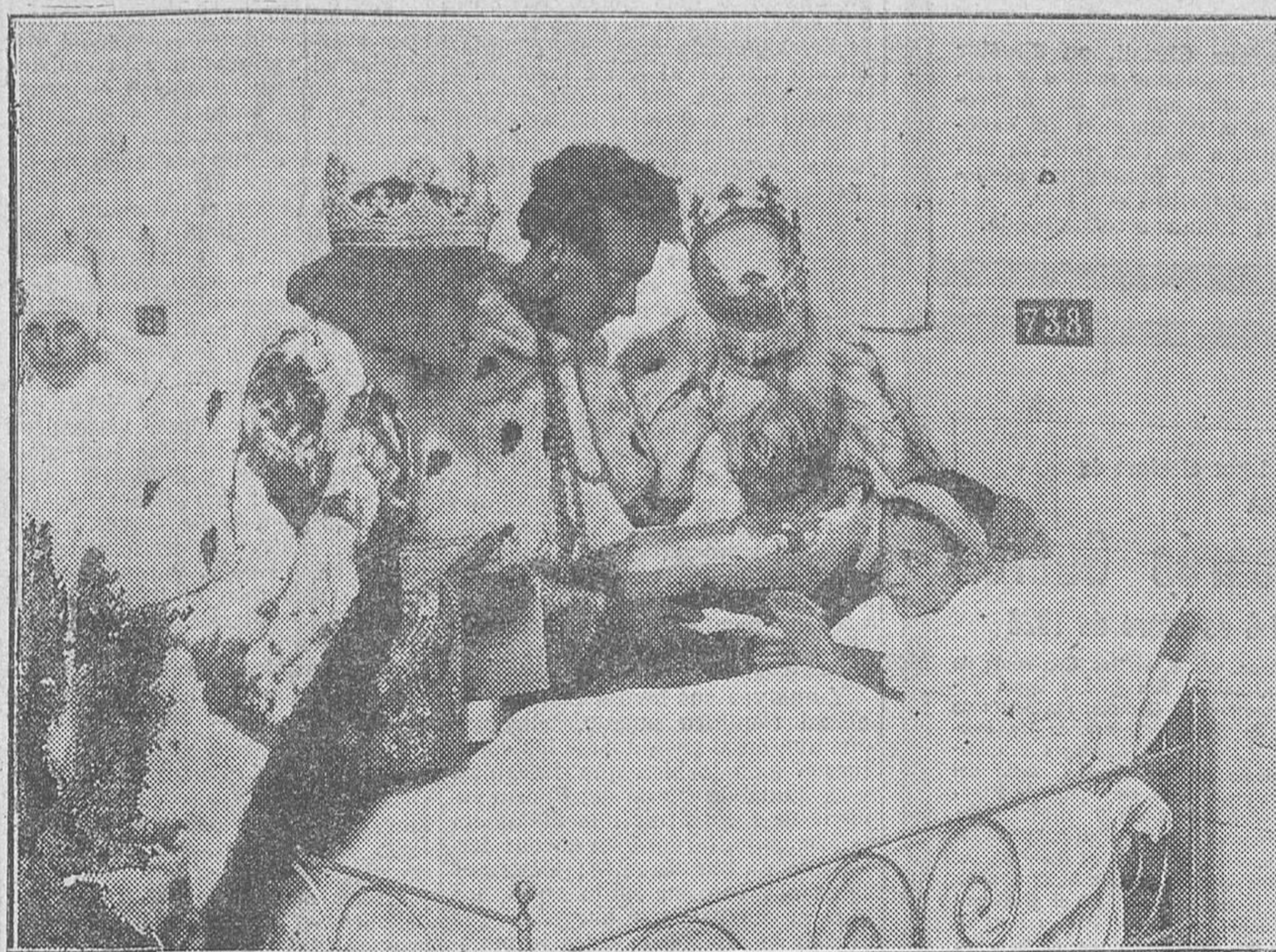
Los tres Monarcas de Oriente ante la camita de un niño enfermo, de nuestro Santo Hospital.

pierde prestigio el que la prodiga y malogra al que la recibe. En el orden intelectual y en el moral, censurar es amor; ofrecer de continuo el incienso de la lisonja, sino es aborrecimiento, no es recta estimación.