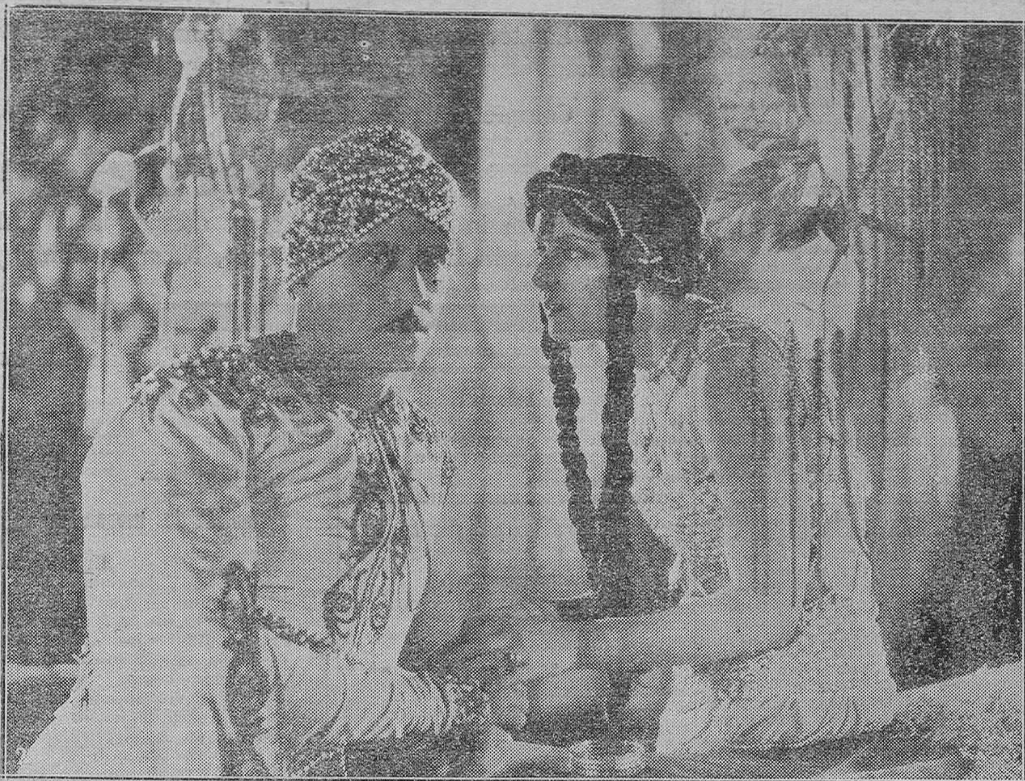
Una sugestiva escena de la gran película SCHEHERAZADE, de la UFA, en la que esta casa productora ha sabido plasmar con singular acierto una hermosa narración de «Las mil y una noches».