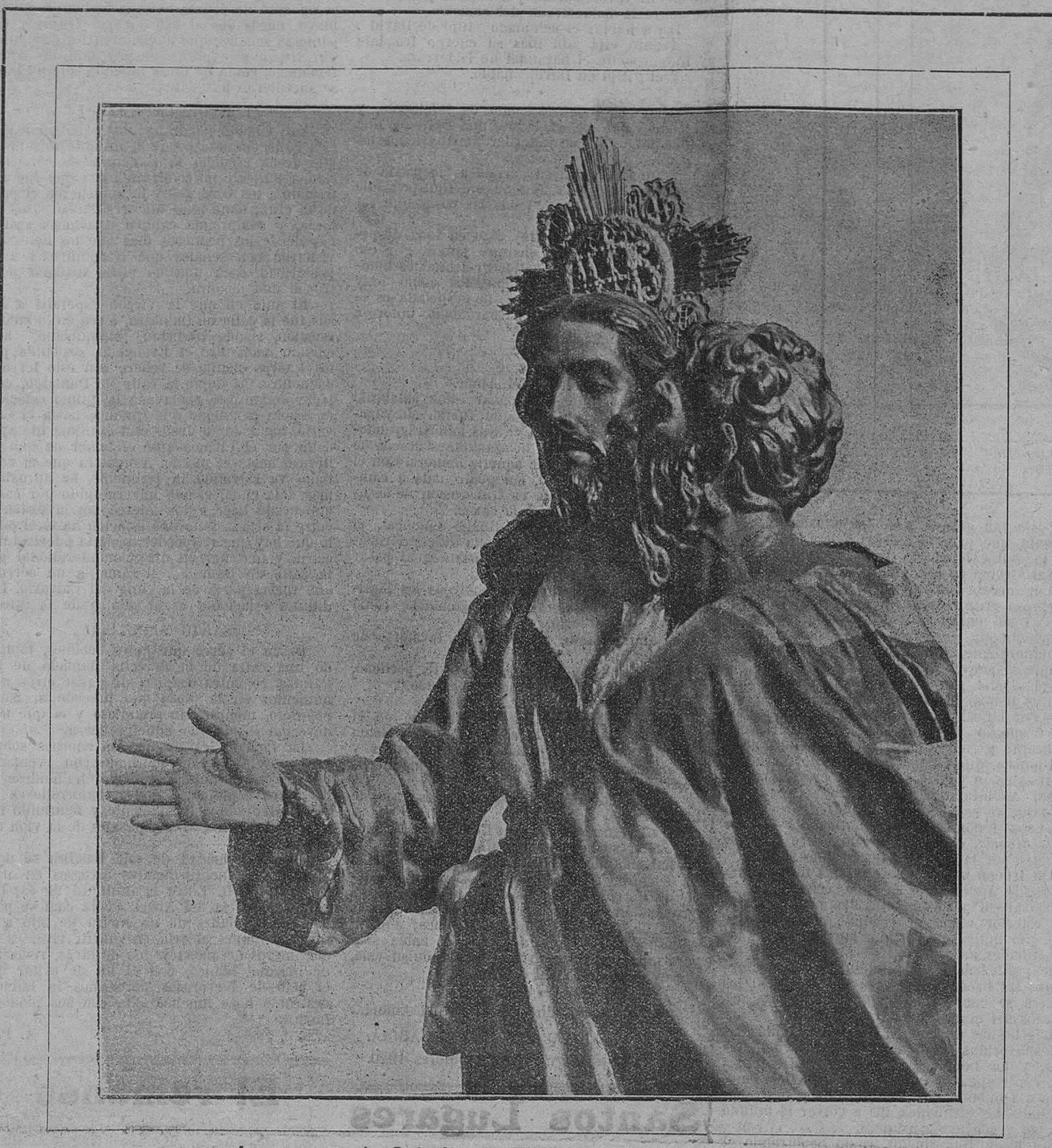
Los pasos de Salcillo en Murcia: «El beso de Judas.»

¿Por qué velado de nube cándida sube y sorprende en los ojos míseros de los mortales junto a Betania el Hombre-Dios?