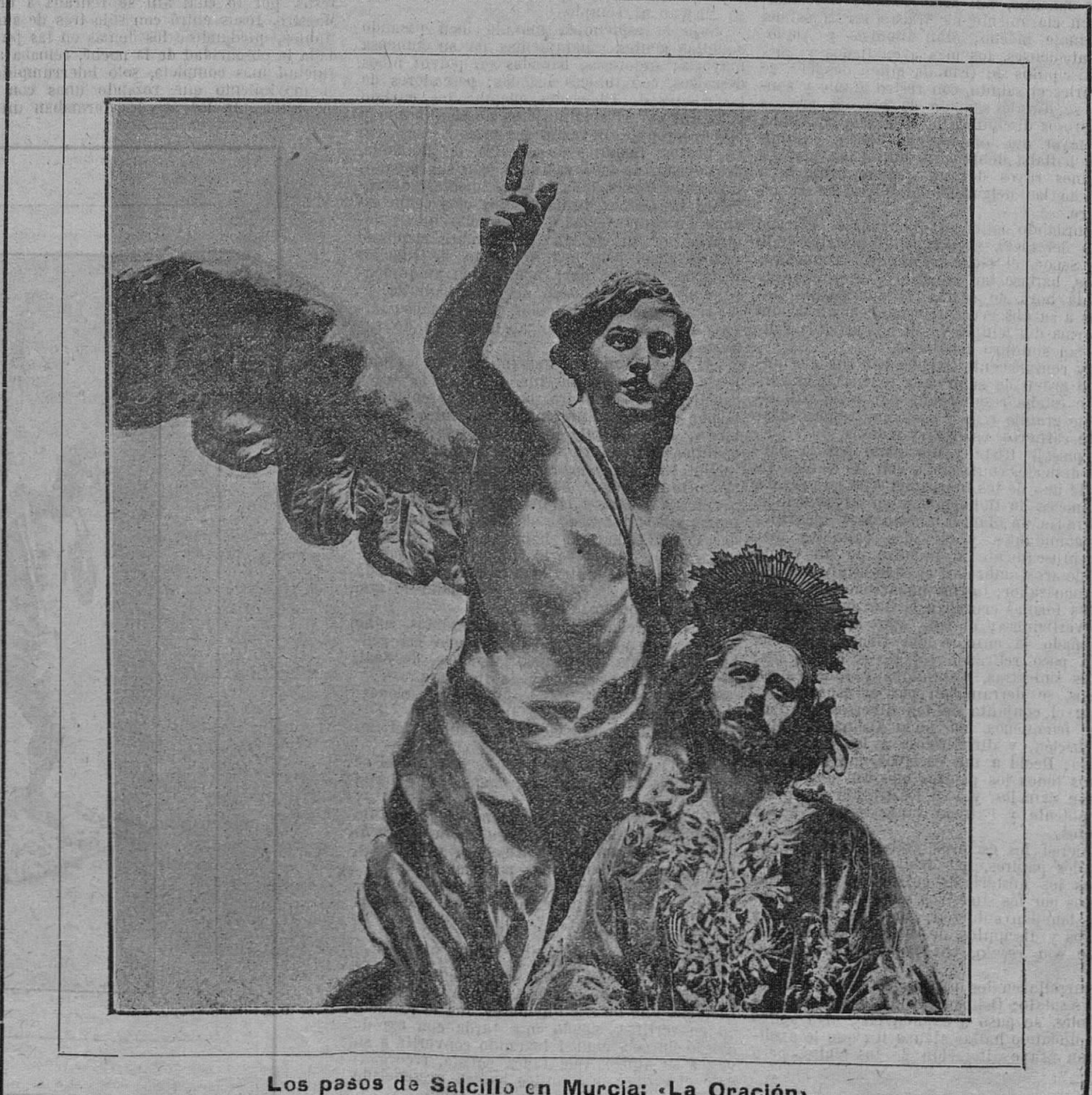
Los pasos de Salcillo en Murcia: «La Oración.»