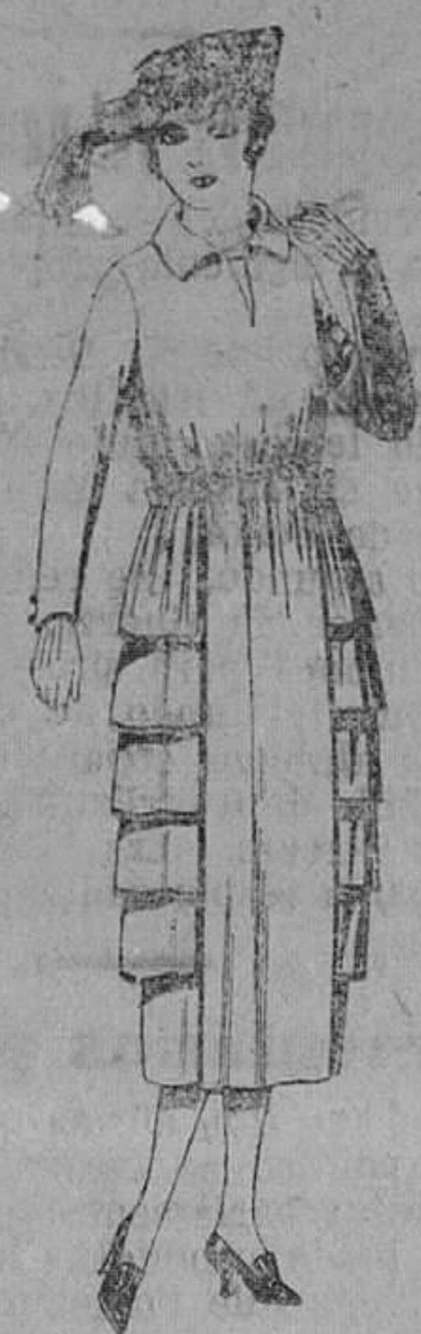
Vestidos de sarga inglesa, estambre, lanilla, etc., en negro, azul y color. De ptas. 110 a 140

Madrid, Barcelona, Alicante, Almería, Bilbao, Cádiz, Cartagena, Gijón, Granada, Málaga, Palma de Mallorca, Santander, Sevilla, Valladolid y Zaragoza.