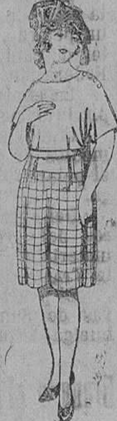
Vestidos de sarga inglesa, estambre, lanilla, etc., para niñas de 4 a 12 años. De ptas. 30 a 60