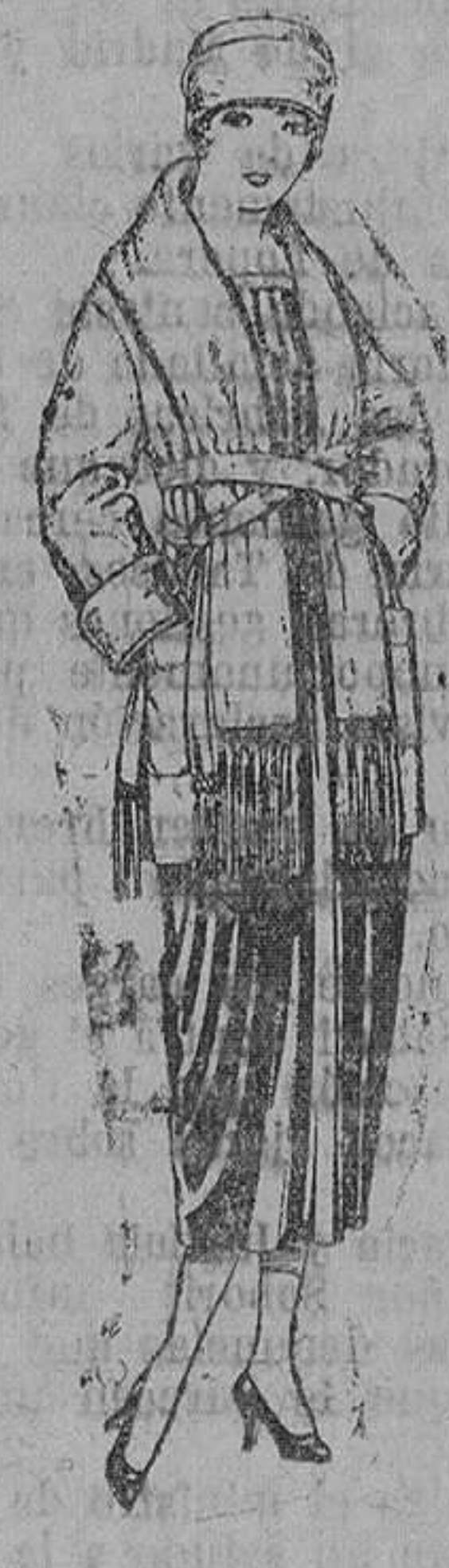
Paletois de punto de lana, cuello bufanda. De ptas. 52 a 60