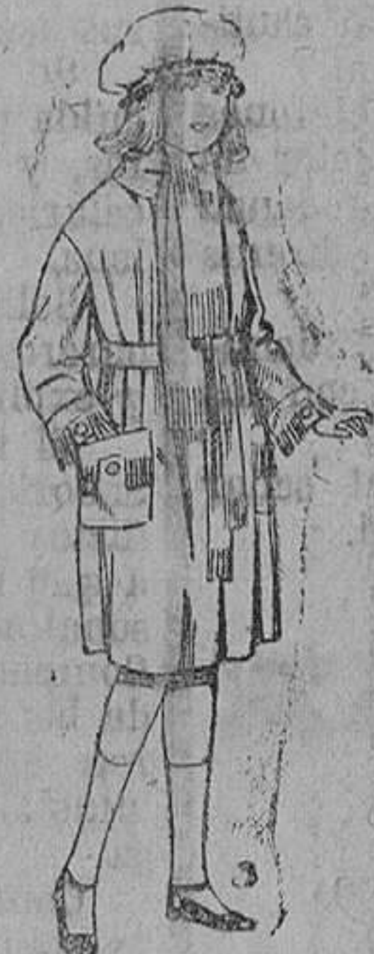
Abrigos de gamuza, pañete, cheviot, etc., en azul y color, para niñas de 4 a 9 años. De ptas. 35 a 50