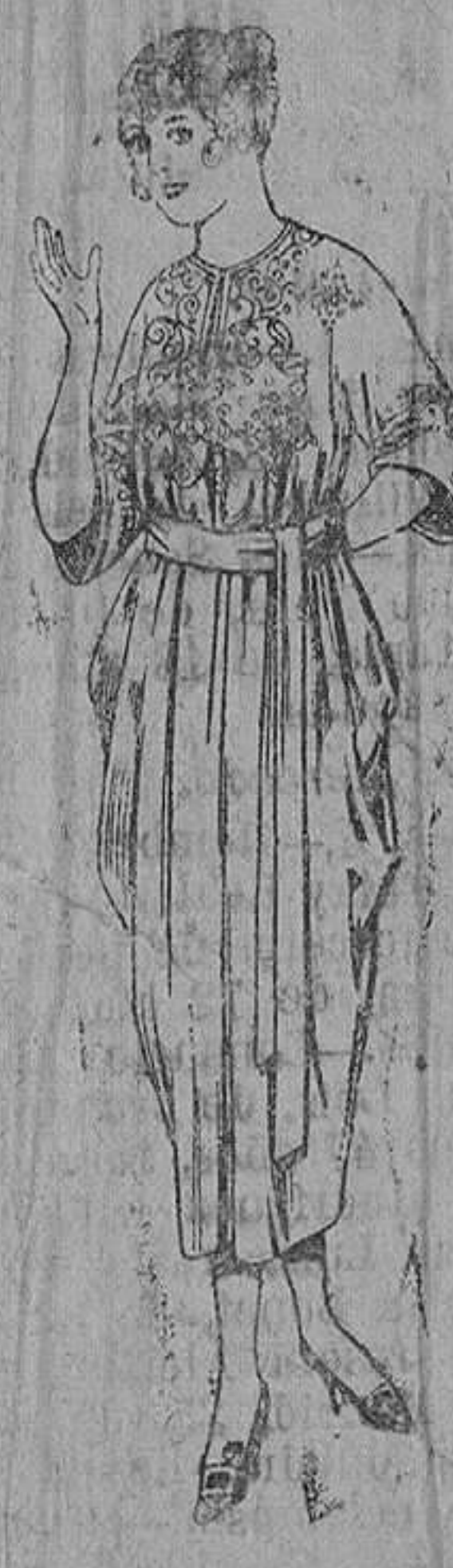
Batas de franela, adorno bordado. De ptas. 45 a 60. Surtido de batas en franela y lana. De ptas. 14 a 60

Ropas confeccionadas para caballero, señora, niño y niña. Peletería, Camisería, Géneros de punto, Corbatería, Guantería, Sombrerería, Zapatería, Paraguas, :: Bastones y Artículos de viaje ::