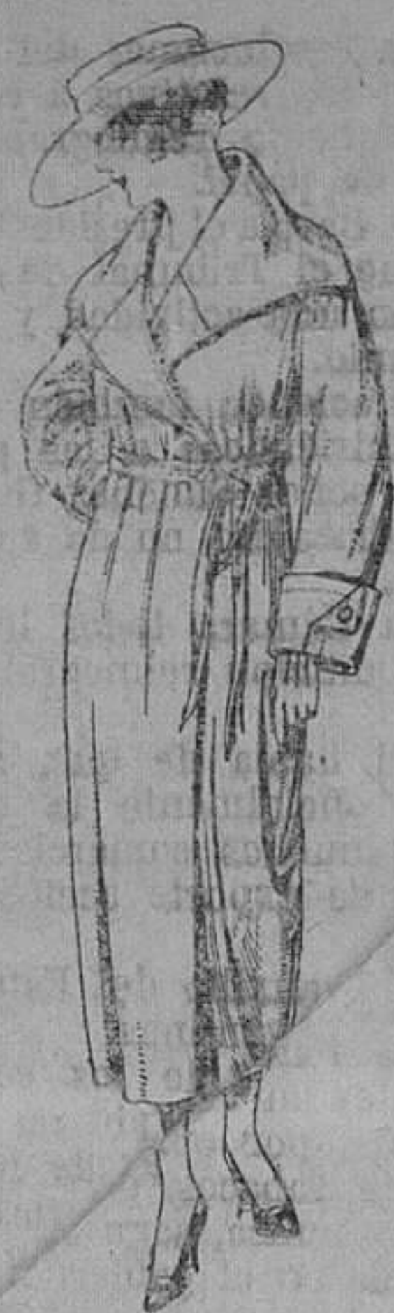
Abrigos de punto de lana, en negro, azul y color. De ptas. 135 a 250