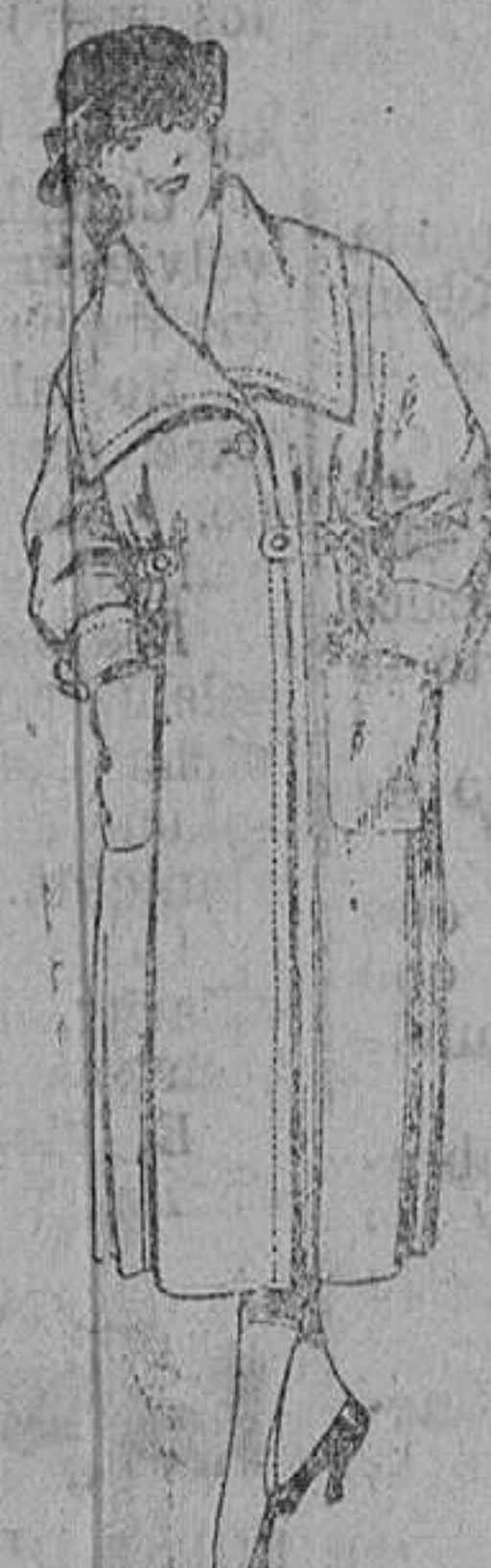
Abrigos de gabardina, gamuza, etc., en azul y color, para jovencitas de 12 a 15 años. De ptas. 42 a 100