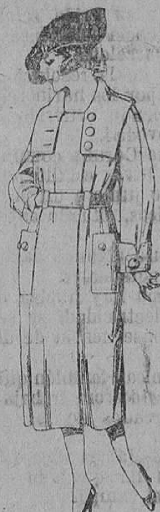
Abrigos de cheviot, ratina, pañete, etc., en azul y color, para jovencitas de 12 a 15 años. De ptas. 35 a 60