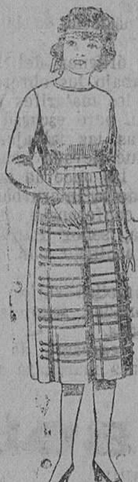
Vestidos de sarga inglesa, estambre, etc., en azul y color, para jovencitas de 12 a 15 años. De ptas. 52 a 80