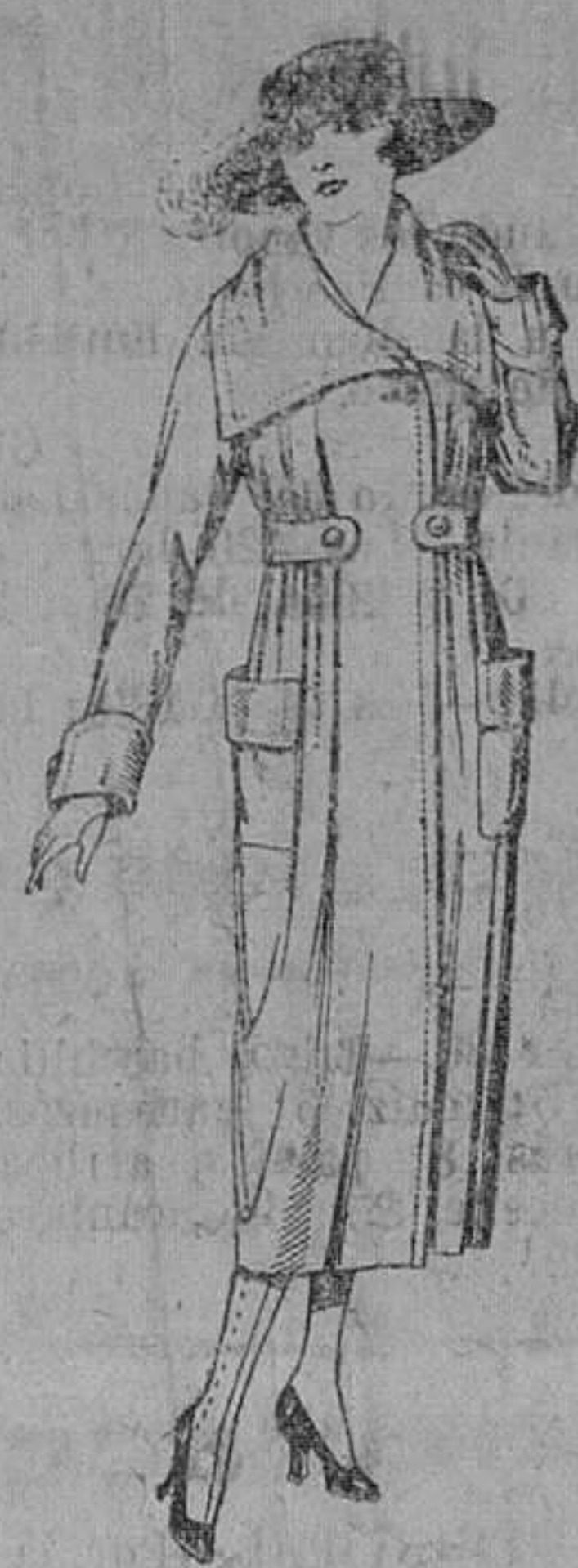
Abrigos de cheviot, gamuza, etc., en negro, azul y color. De ptas. 55 a 100