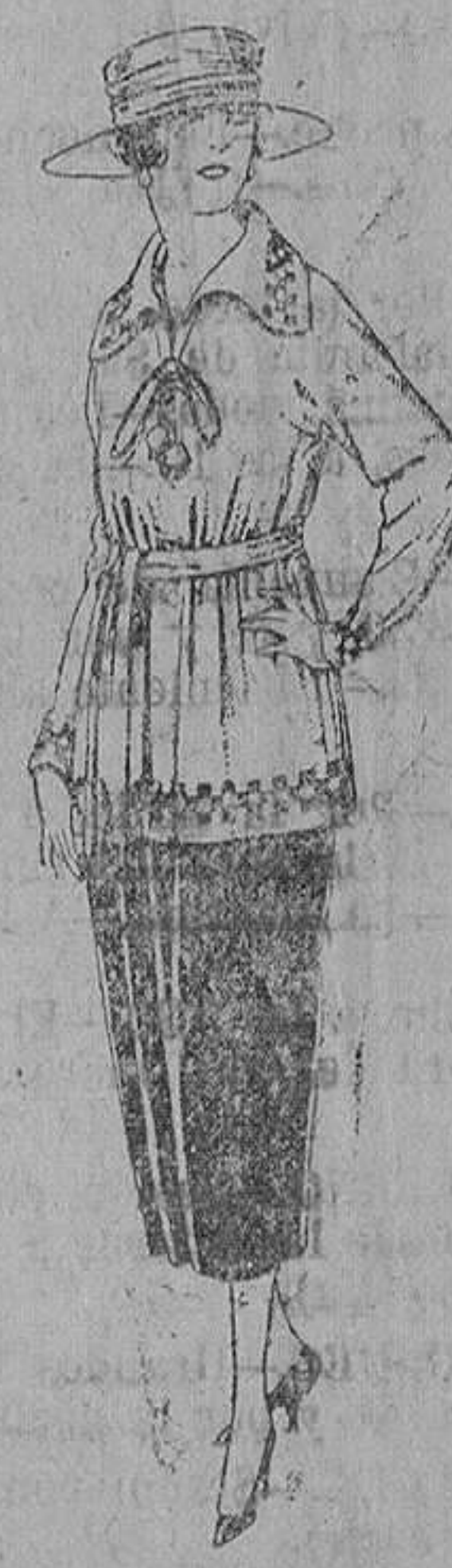
Paletois de punto de lana, diferentes colores. De ptas. 34 a 50