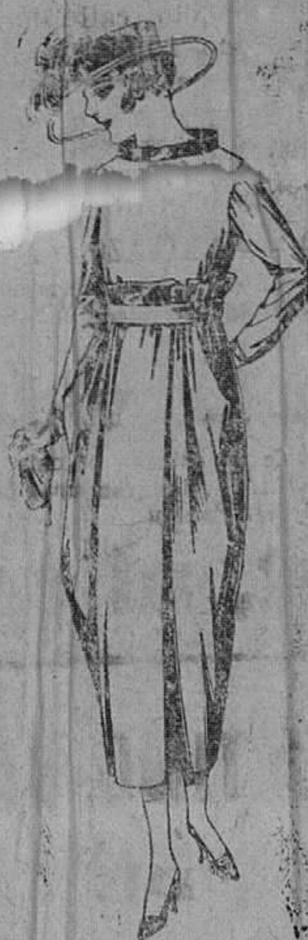
Vestidos de gabardina, estambre, sarga, etc., en negro, azul y color. De ptas. 98 a 135