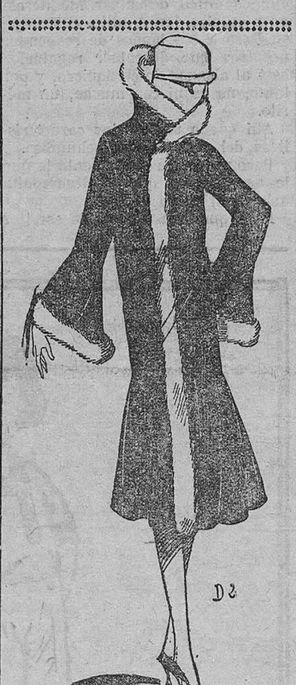
Vestido de terciopelo inglés verde almendra, adornado con petit gris

Este número ha sido revisado por la censura