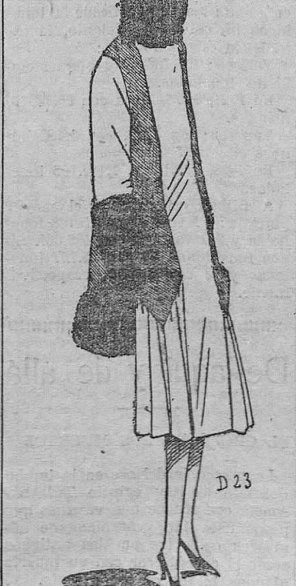
Manteau en terciopelo de lana beige y terciopelo de lana habano, adornado con piel de castor

La corte es como un edificio de mármol; es decir, que se compone de hombres duros, pero muy finos.