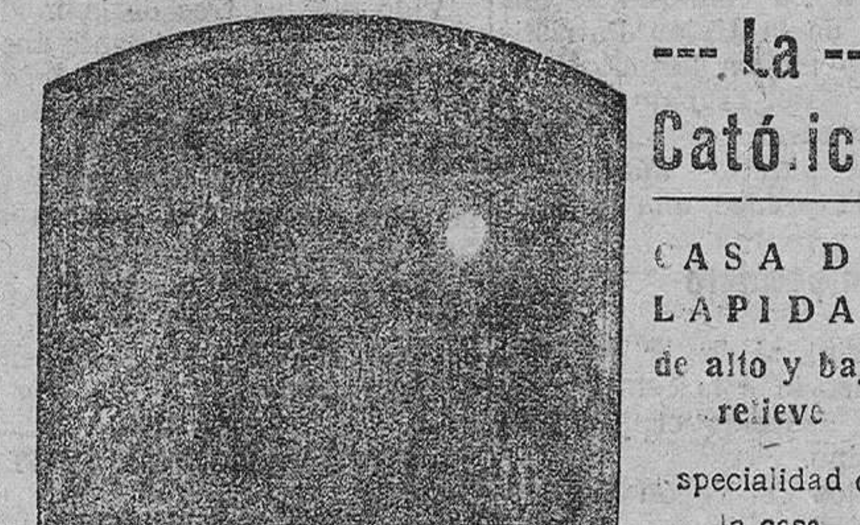
JOSE ANDREU y C.ª - Caballeros, 12

Establecimiento dedicado a taller de Bordados Corneli y luminosos para trajes. Filisados con dibujos y lisos. Varias de todos anchos y con dibujos, Patrones, Picad s, Vent de figurines, Forras de bot nes; dotado de las máquinas más modernas confecciona cuanto en estas clases de trabajo se pueda pedir con mayor economía y perfección que ninguna otra casa.