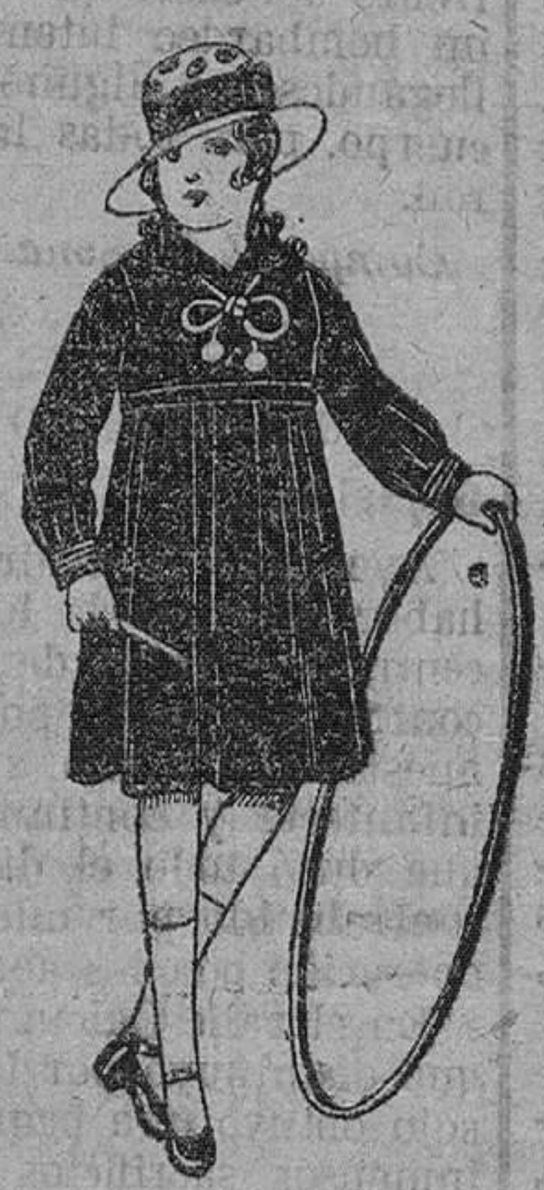
Vestidos marinera de sarga ó estambre azul, adornos sedá blancos. De ptas. 25 á 30