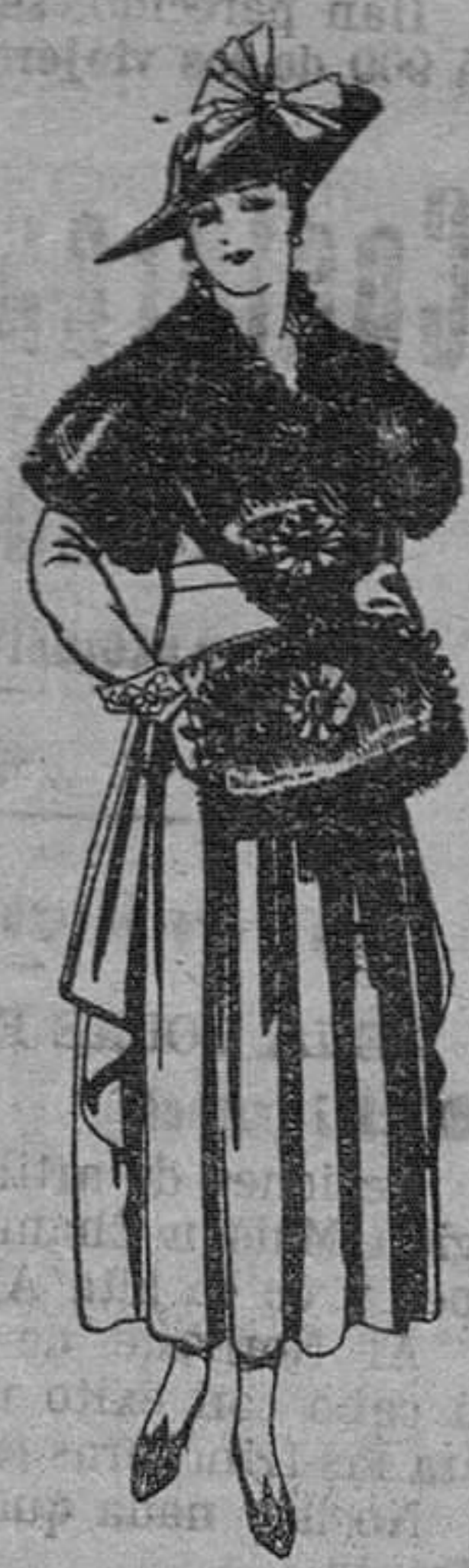
Juegos de pieles, negro, imitación Renard. Gran chic. A pesetas 58

Madrid, Barcelona, Alicante, Almería, Bilbao, Cádiz, Cartagena, Gijón, Granada, Málaga, Palma de Mallorca, Santander, Sevilla, Valladolid y Zaragoza.