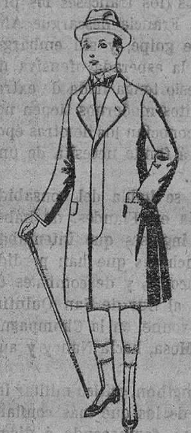
Gabanes de patén, para niños de 10 á 12 años, de pesetas 18 á 55. Los mismos, para jóvenes de 13 á 16 años. De ptas. 21 á 58