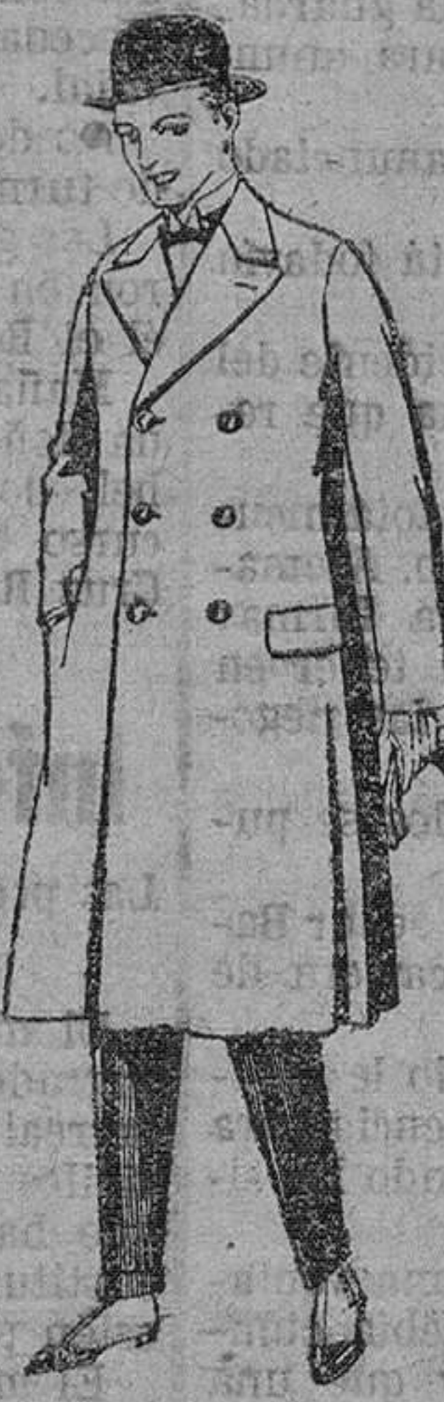
Gabanes de patén, gamuza ó Cowar. De pesetas 50 á 110

Camisería, Géneros de punto, Corbatería, Guantería, Sombrerería, Zapatería, Paraguas, Bastones y Artículos de viaje