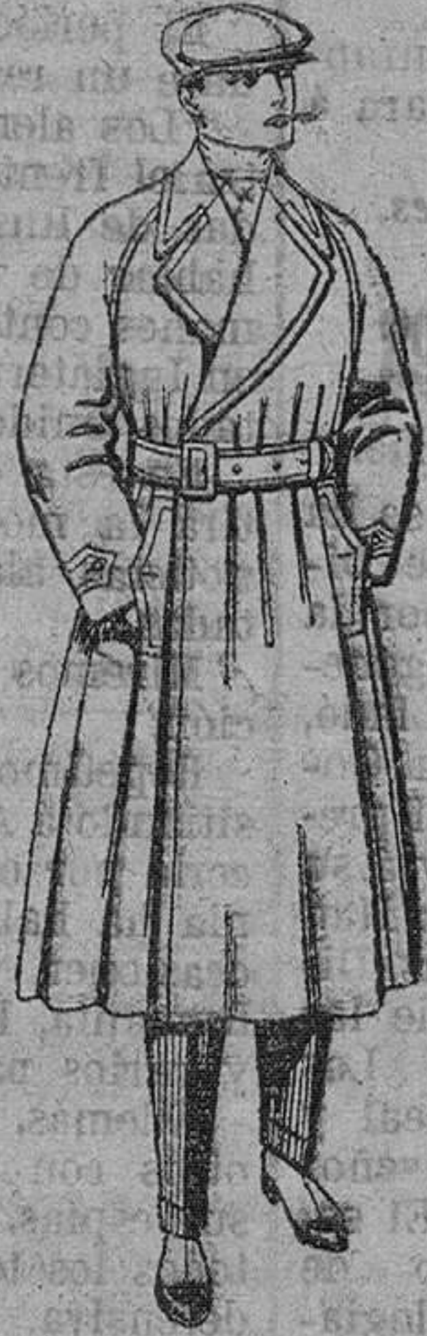
Gabanes impermeables lizados, con cin. u. ó. color beige. De pesetas 43 á 115.