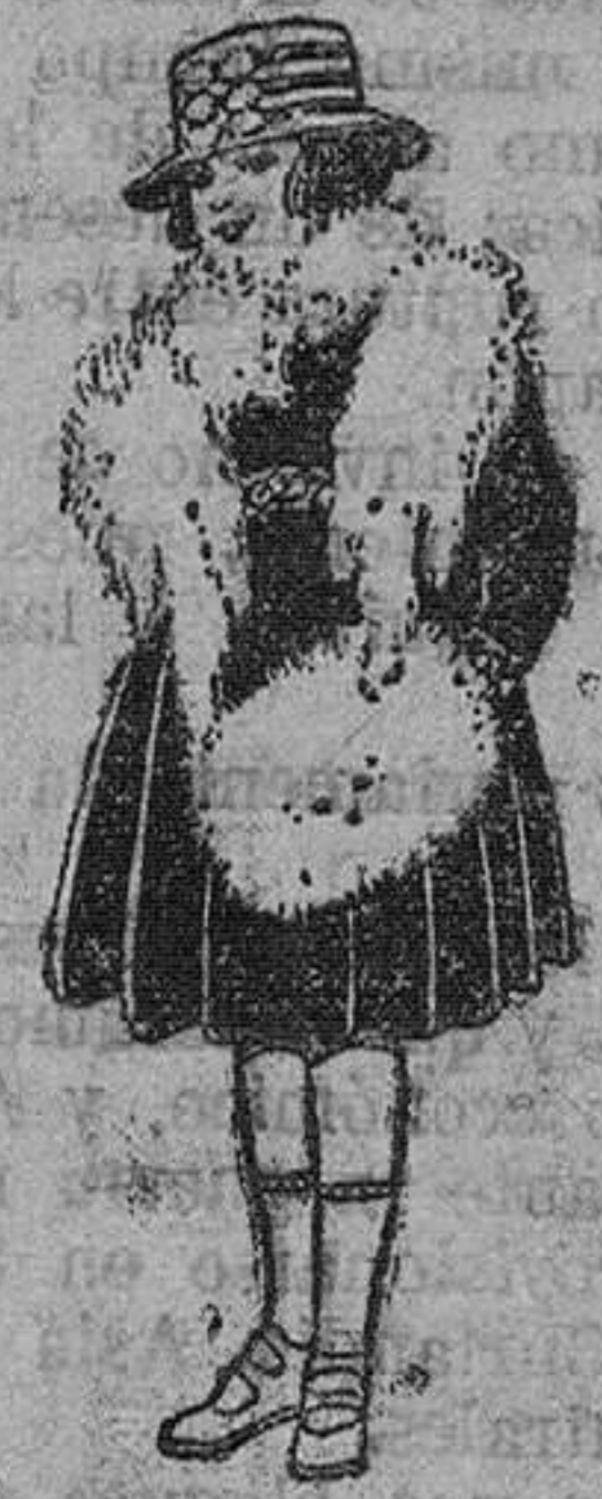
Juegos imitación Renard, blanco. A pesetas 12