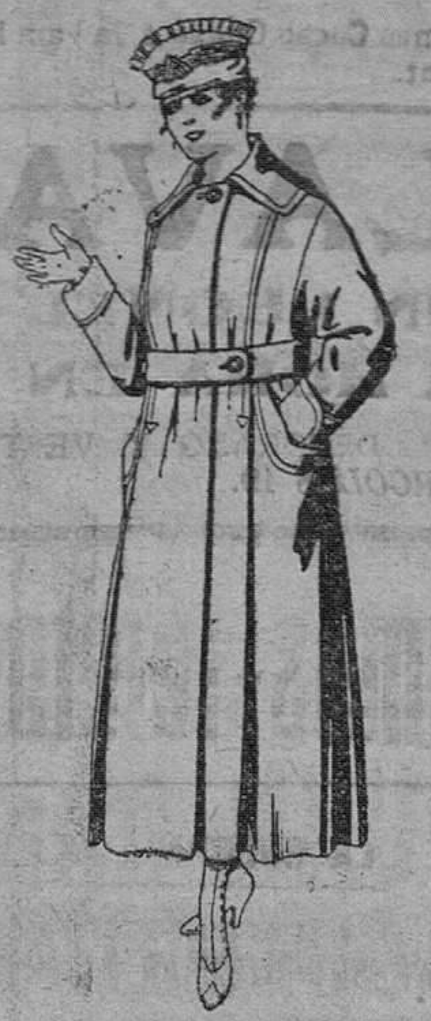
Abrigos de cheviot ó gamuza, en azul, negro y colores. De ptas. 45 á 55