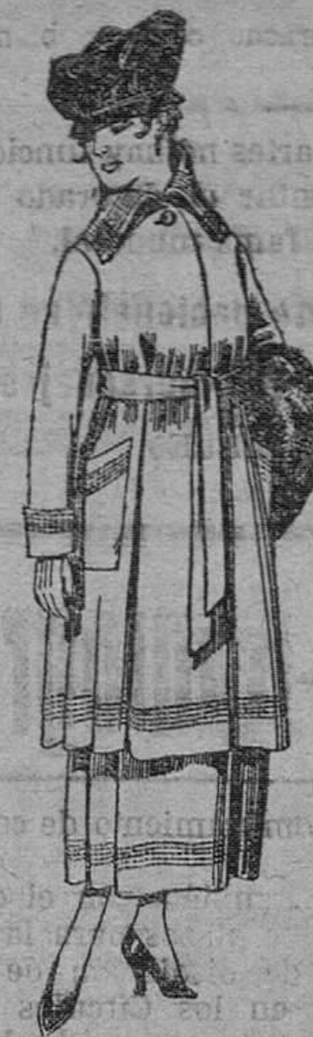
Trajes de sarga inglesa en negro y azul bordados. De pesetas 85 á 100