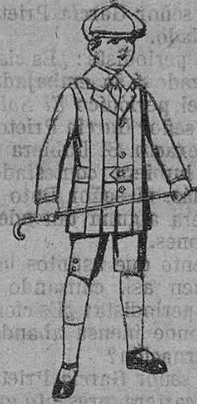
Trajes de patén modelo «Norfolk» para niños de 4 á 9 años. De pesetas 14 á 35