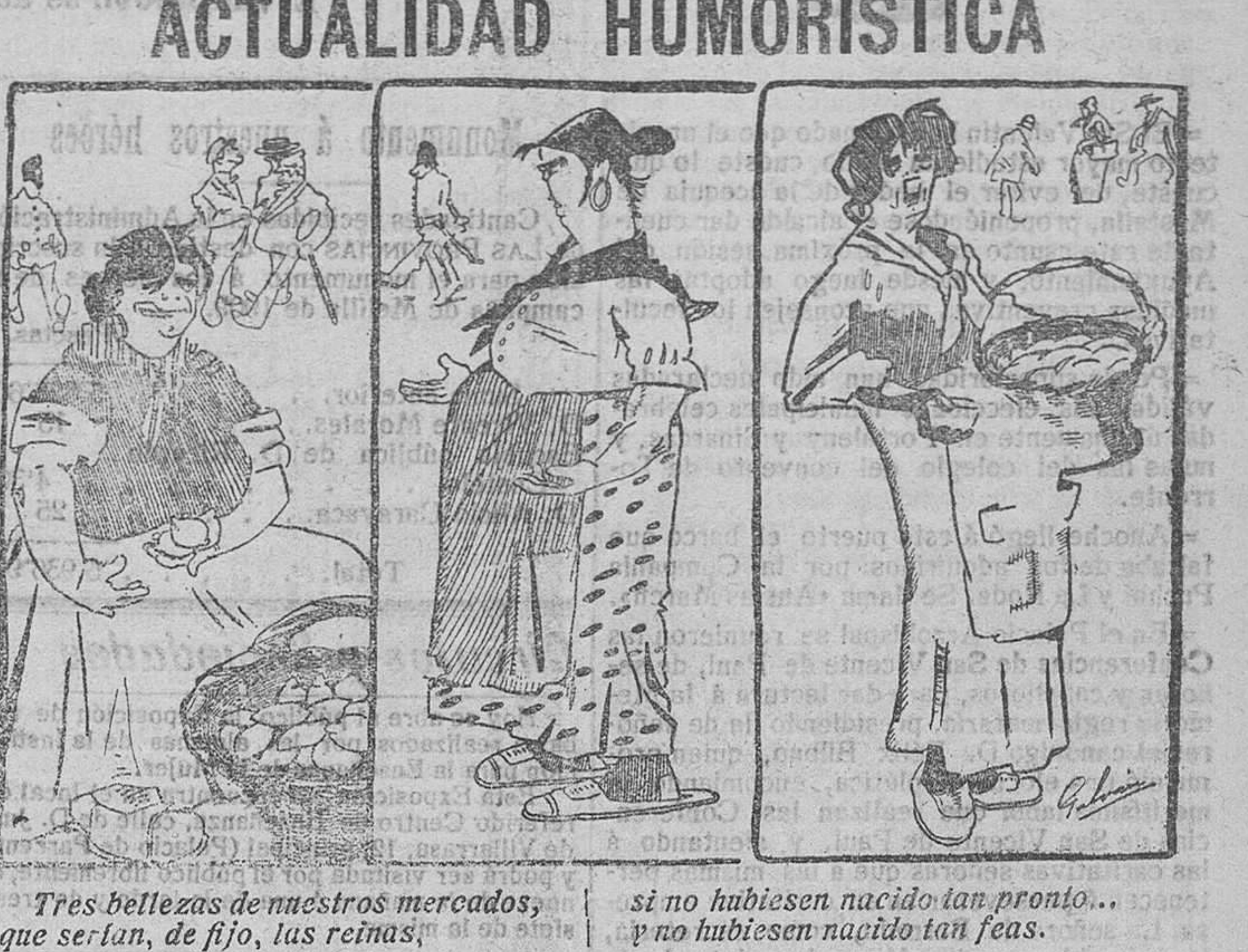
Tres bellezas de nuestros mercados, que serian, de fijo, las reinas... si no hubiesen nacido tan pronto... y no hubiesen nacido tan feas.

Dr. ALGAYDE. Plaza de la Reina, 2, Valencia. VALENCIA.