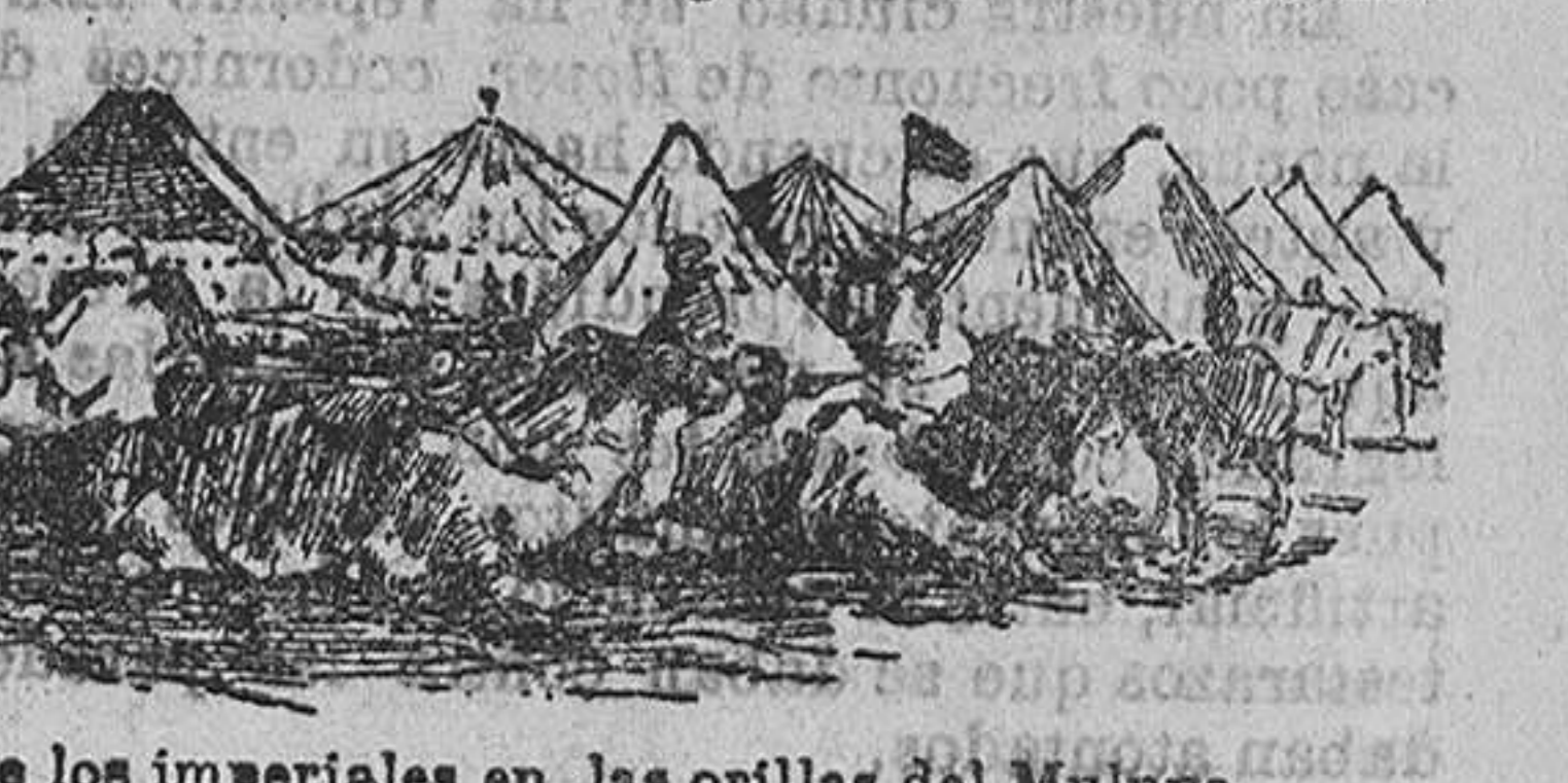
Campamento de los imperiales en las orillas del Muluya.

A nadie ha de extrañar esto. Hace años que los marroquíes viven en perpetua discordia; la autoridad del sultán no se extiende a todo el imperio, pues nunca le faltan kabilas rebeldes que obran por cuenta propia.