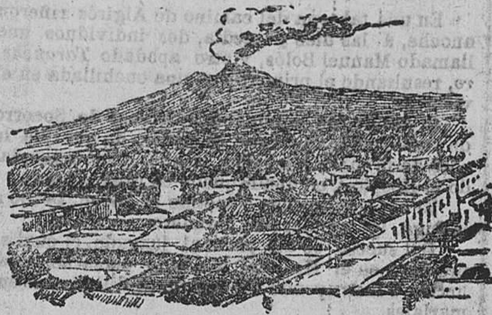
COLIMA.—La ciudad y el volcán.