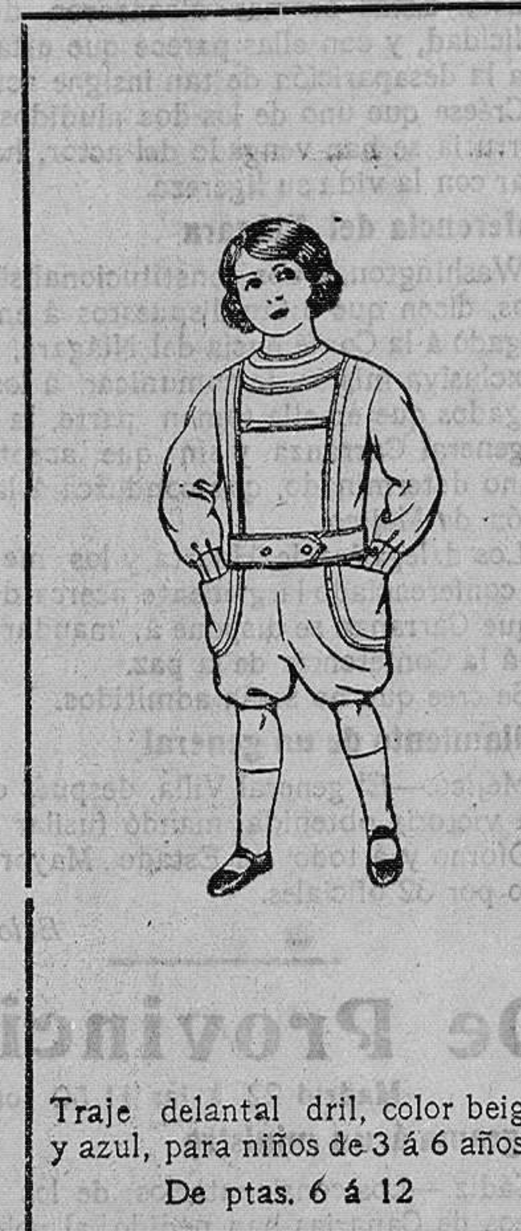
Traje delantal dril, color beig y azul, para niños de 3 á 6 años. De ptas. 6 á 12