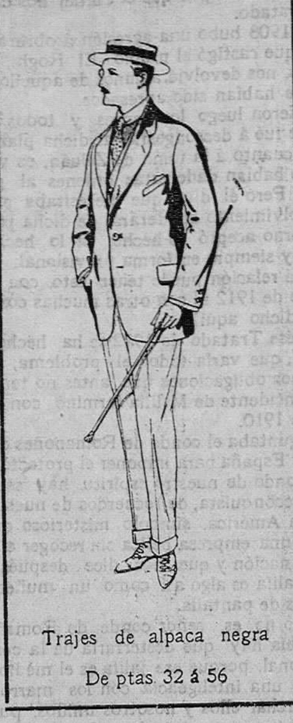
Trajes de alpaca negra. De ptas. 32 á 56