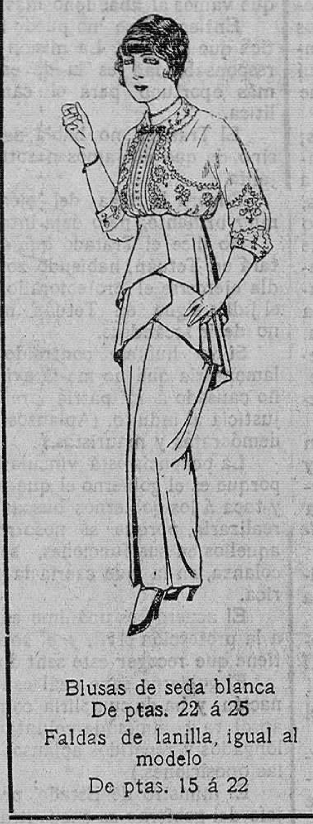
Blusas de seda blanca. De ptas. 22 á 25. Faldas de lanilla, igual al modelo. De ptas. 15 á 22

Camisería, Géneros de punto, Corbatería, Guantería, Sombrería, Zapatería, Paraguas, Bastones, Artículos para viaje.