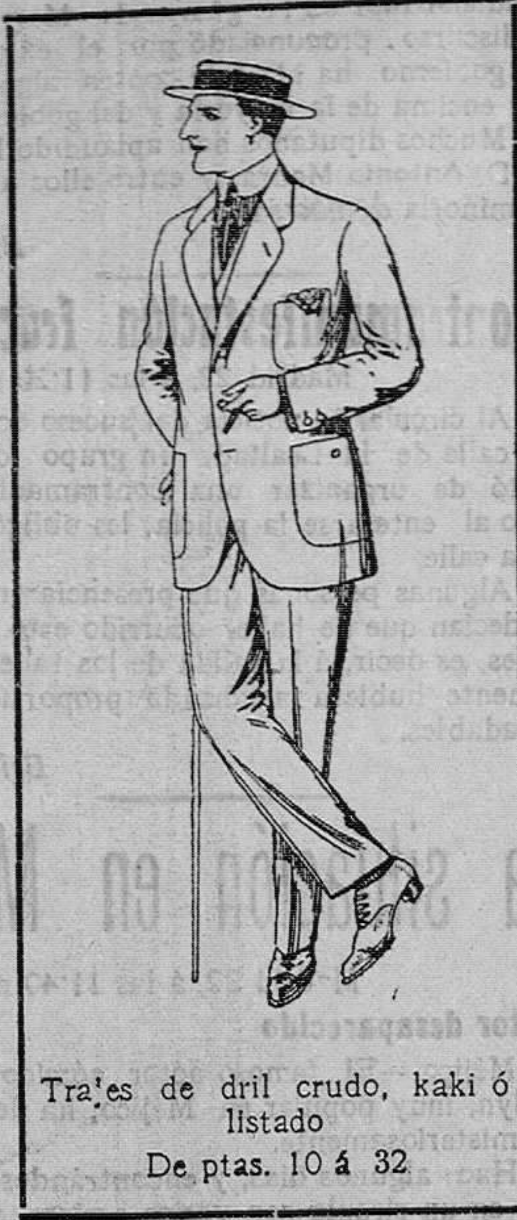
Trajes de dril crudo, kaki ó listado. De ptas. 10 á 32