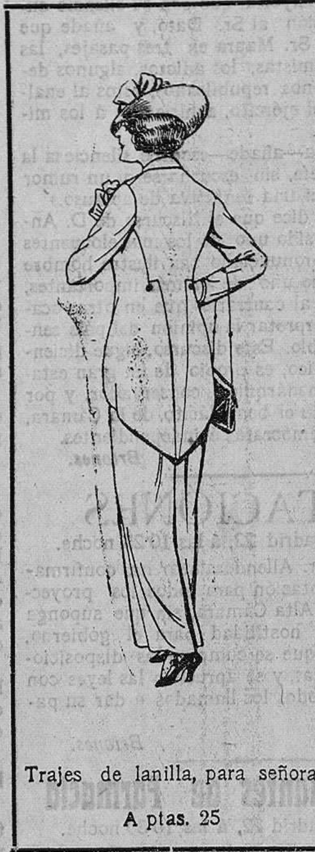
Trajes de lanilla, para señora. A ptas. 25