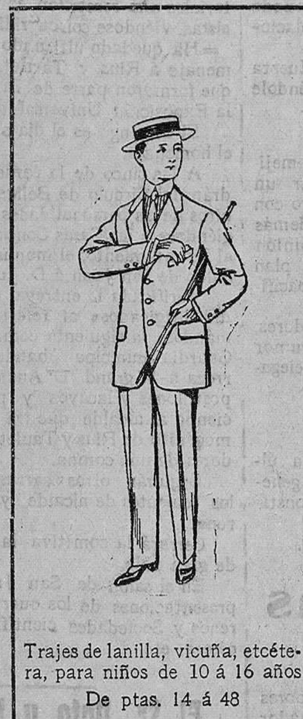
Trajes de lanilla, vicuña, etcétera, para niños de 10 á 16 años. De ptas. 14 á 48