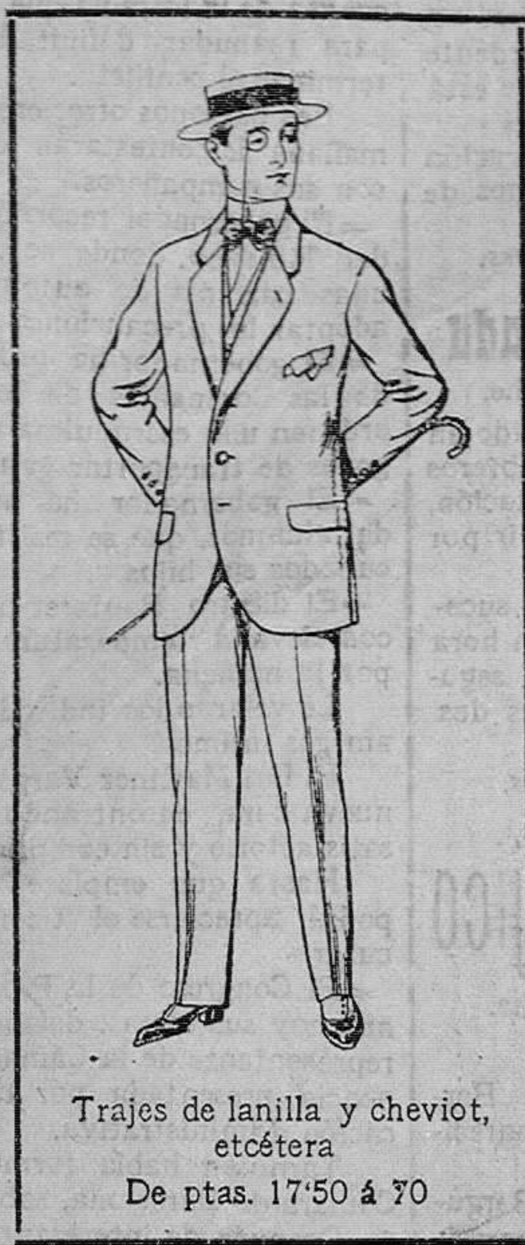
Trajes de lanilla y cheviot, etcétera. De ptas. 17.50 á 70