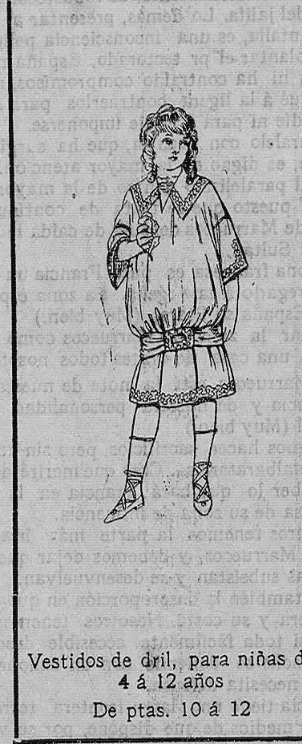
Vestidos de dril, para niñas de 4 á 12 años. De ptas. 10 á 12