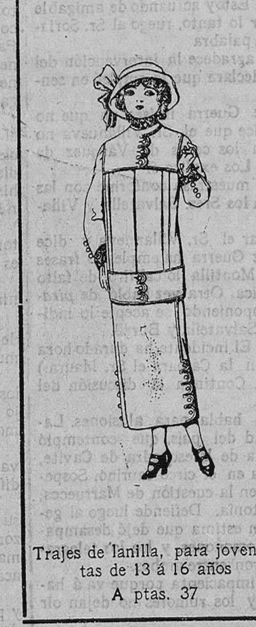
Trajes de lanilla, para jovencitas de 13 á 16 años. A ptas. 37