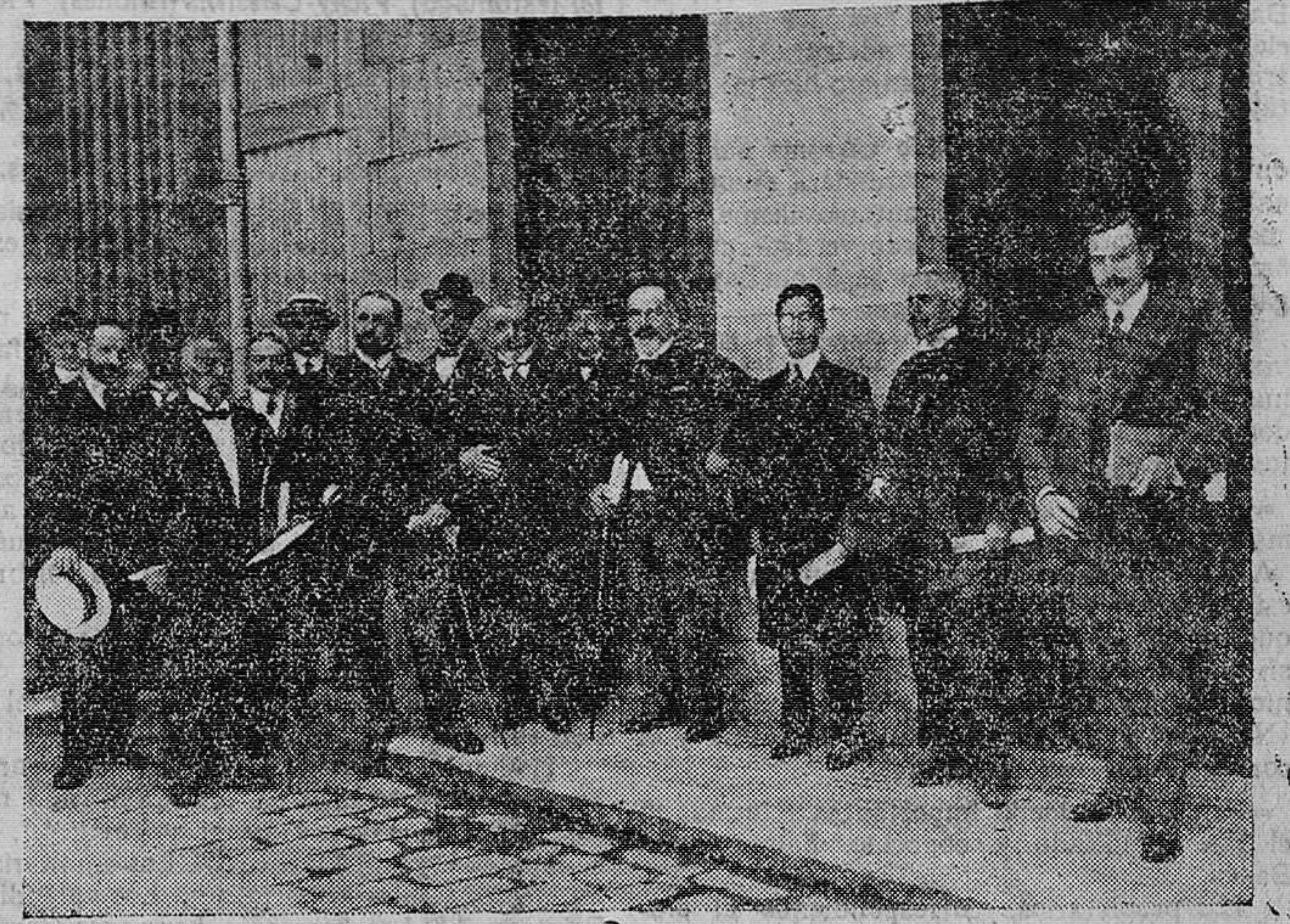
Varlos congresistas, á la salida de la sección 7.ª, reunida ayer mañana.

seguidos en la pintoresca montaña de aquella linda población, con una paella. El ilustre ex-ministro D. Juan Navarro Reverter es esperado en Alberique en el segundo tren de hoy. Los expedicionarios re-resarán al anochecer.