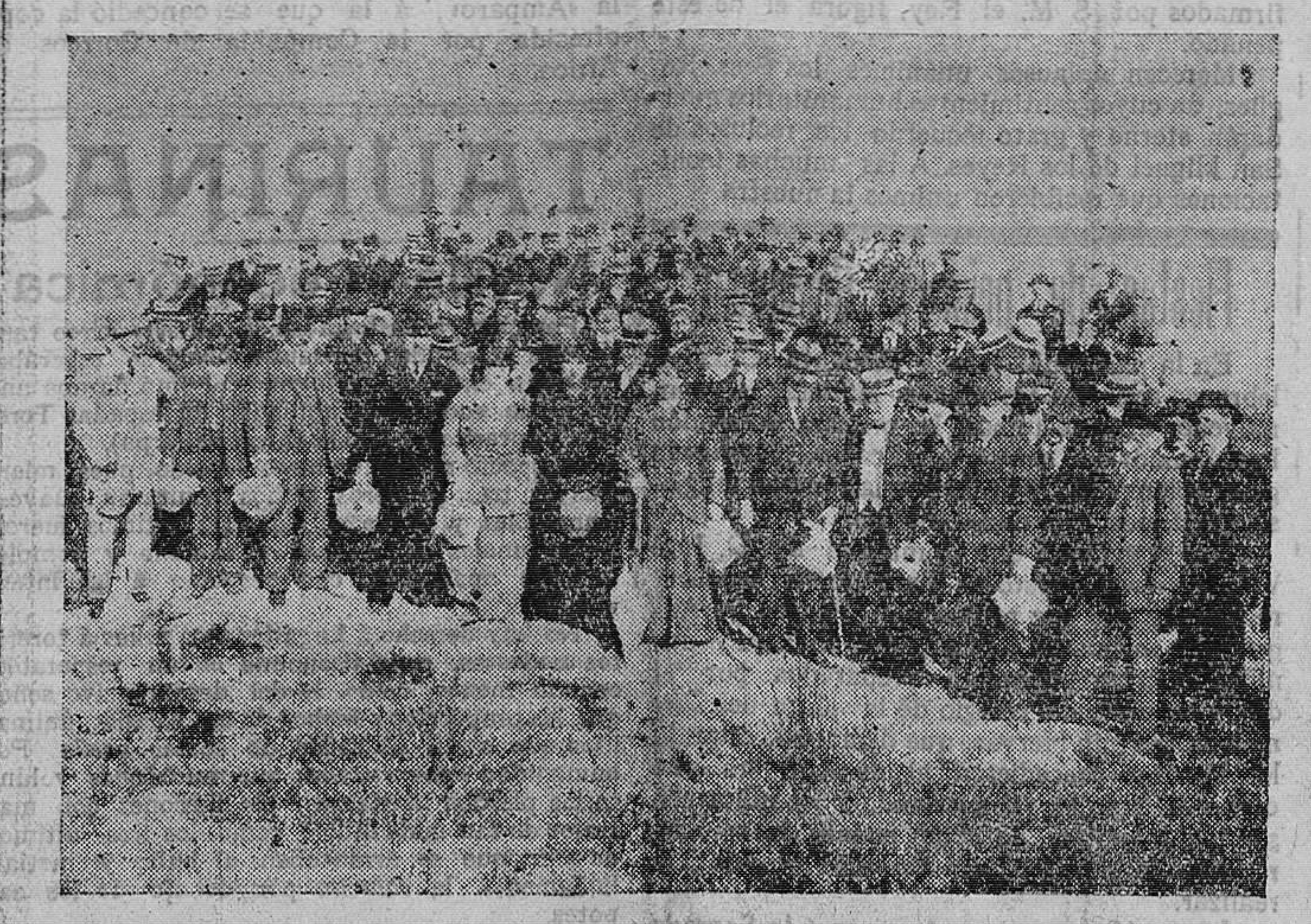
Grupo de señoras congresistas en su jila á la Dehesa

cuenta, á más de lo que dicha comisión pueda acordar, los siguientes extremos: a) Naturaleza de los terrenos sujetos á experimentación. b) Estudio comparativo de los sistemas de riegos utilizados, espesor de la lámina de agua, composición de la misma, cambios bruscos de temperatura, así como la media en las diferentes fases vegetativas, velocidad de los desagües, etc.