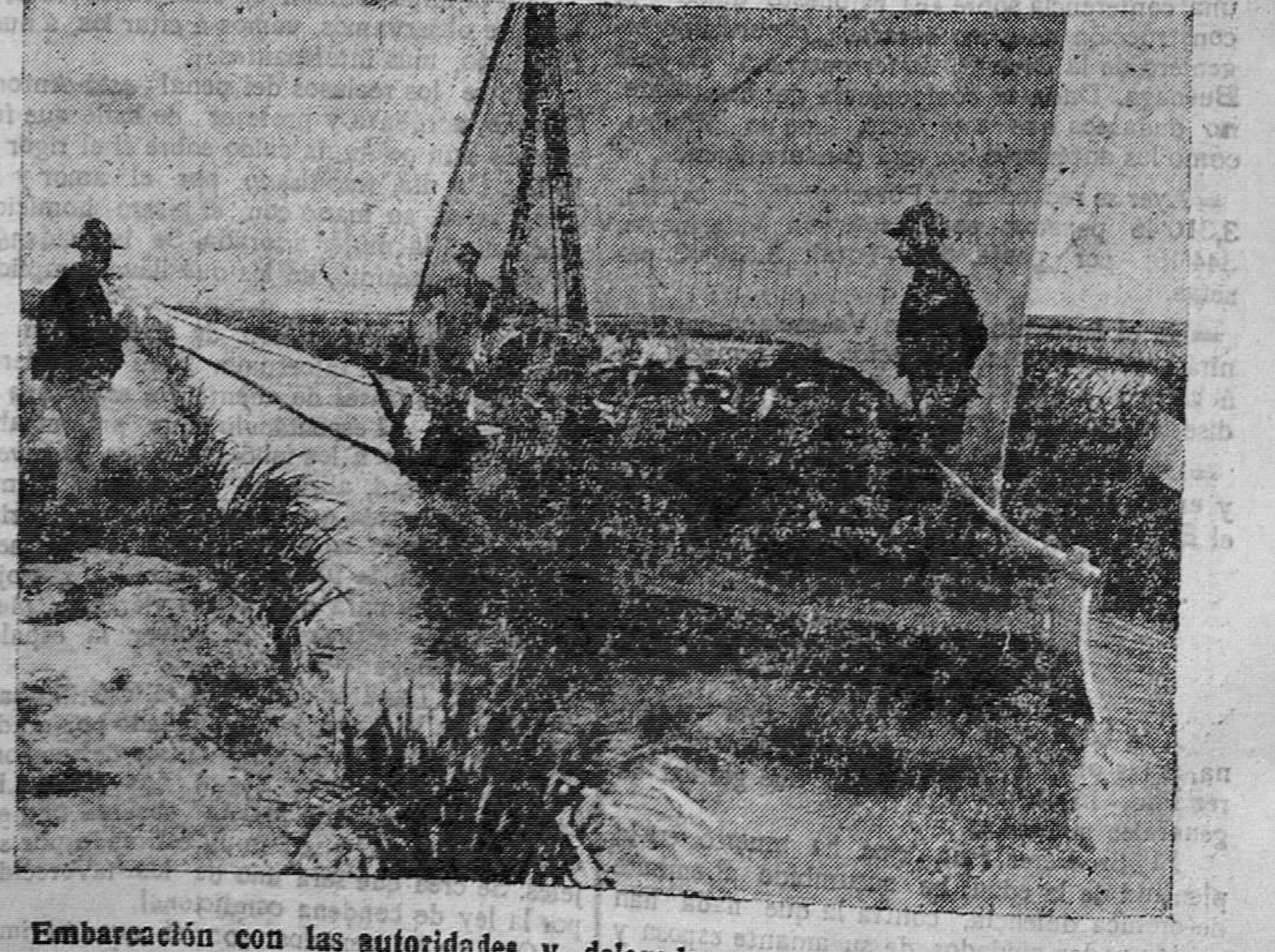
Embarcación con las autoridades y delegados extranjeros dirigiéndose á la Albufera