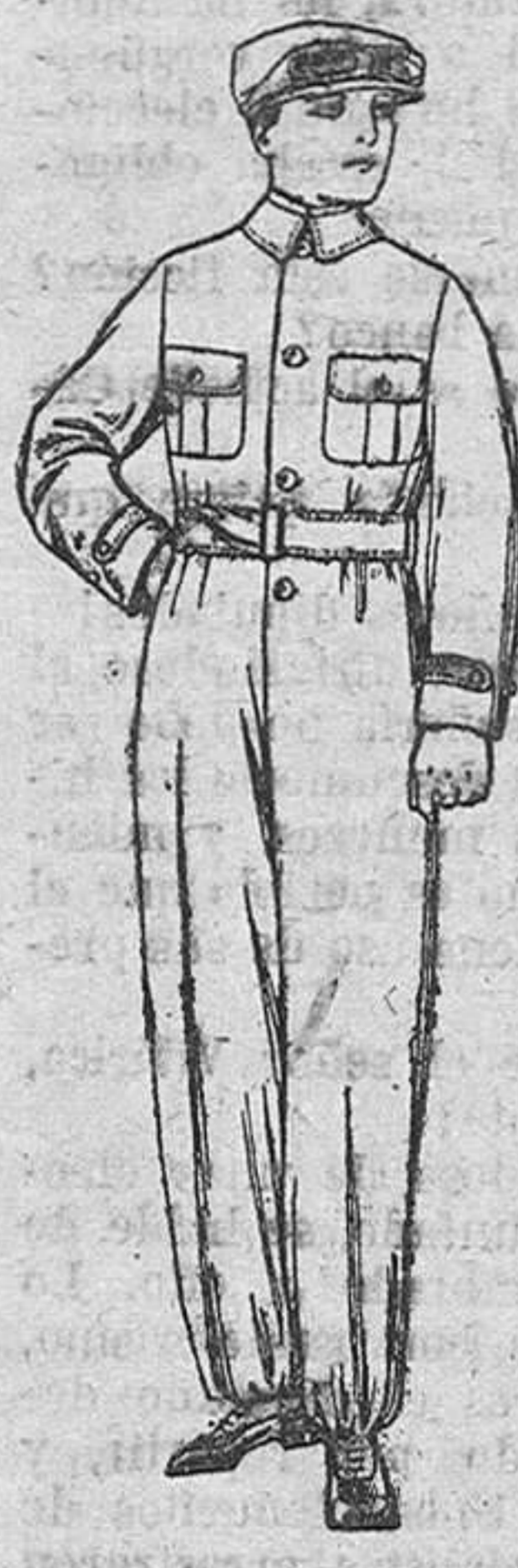
Trajes de dril azul, beige, kaki, etc., para aviador, metalicista, mecánico, etc., de ptas. 18 a 25.