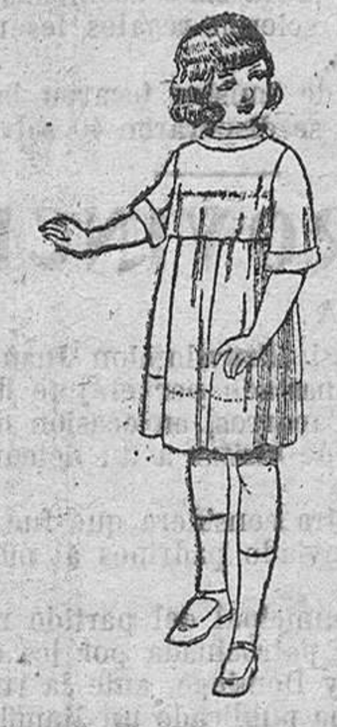
Vestidos de seda liberty, pongee, etc., para niñas de 7 a 12 años, de ptas. 30 a 38.