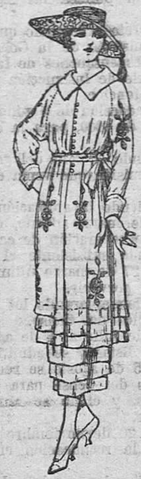
Vestidos de estamín blanco; azul y color, adornos bordados, de ptas. 50 a 68.