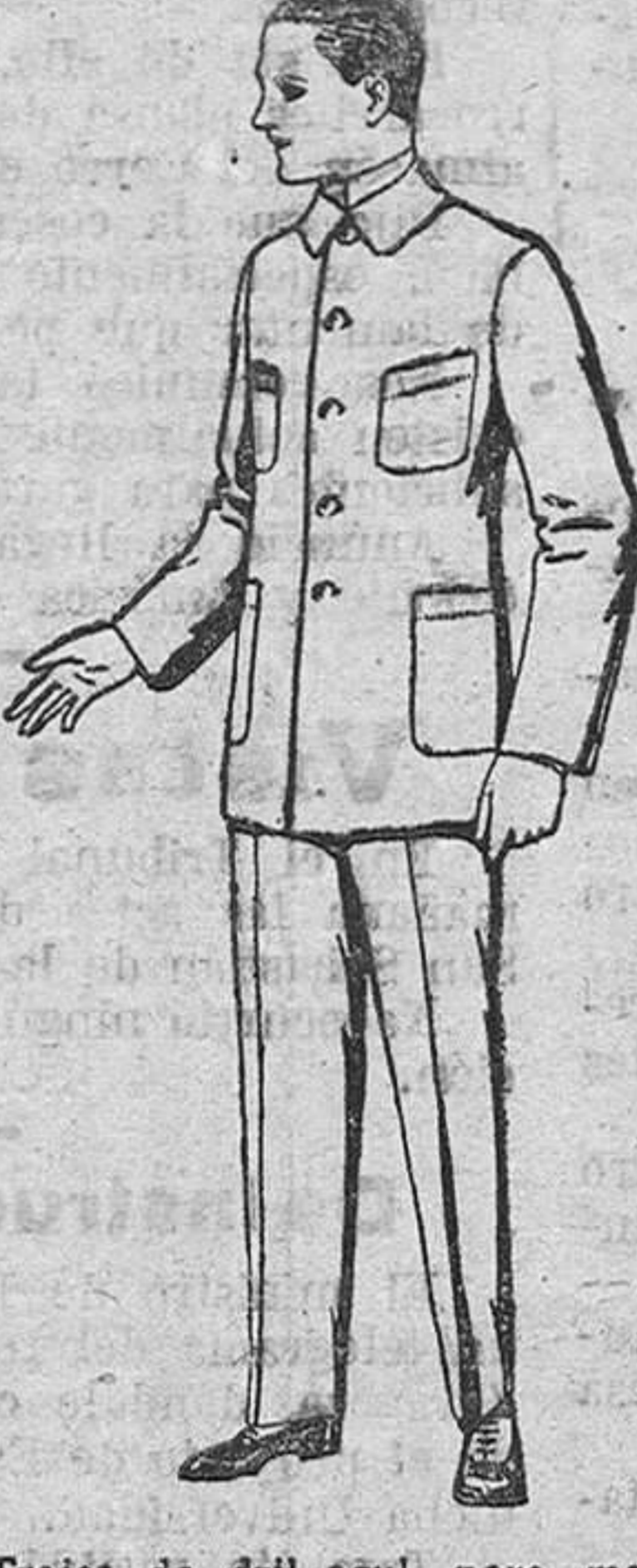
Trajes de dril azul, para mecánicos, de ptas. 17 a 25.