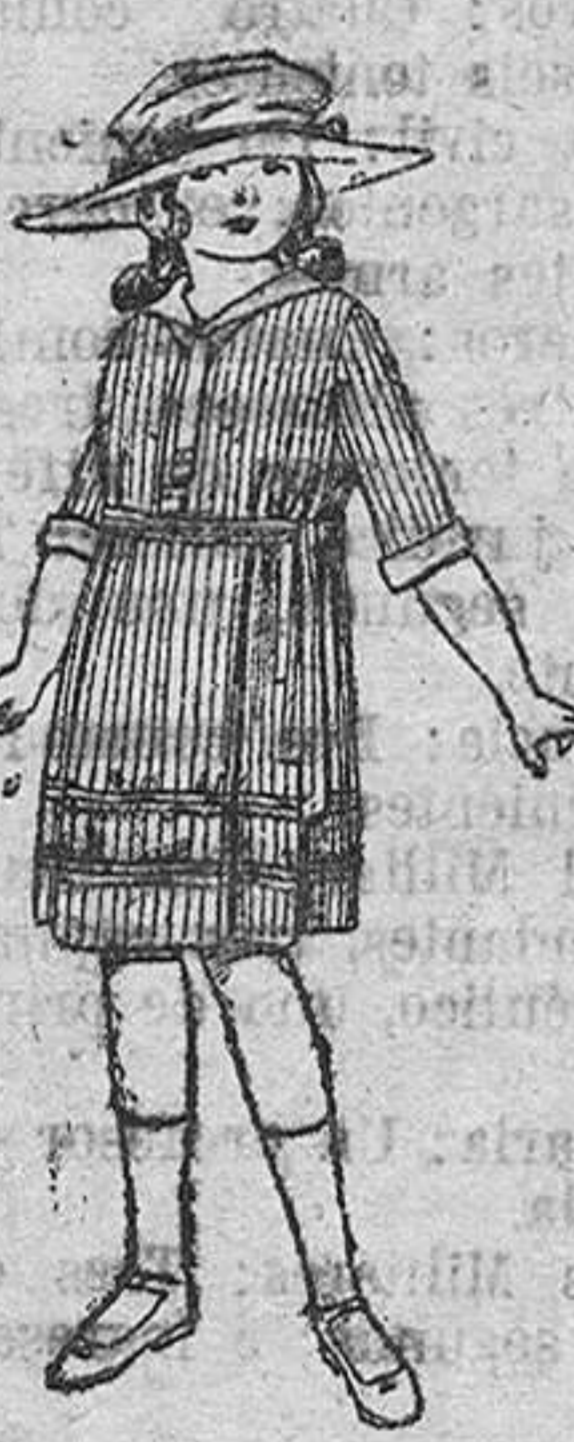
Vestidos de voile, listados, adornos blancos, para niñas de 4 a 9 años, de ptas. 22 a 32.