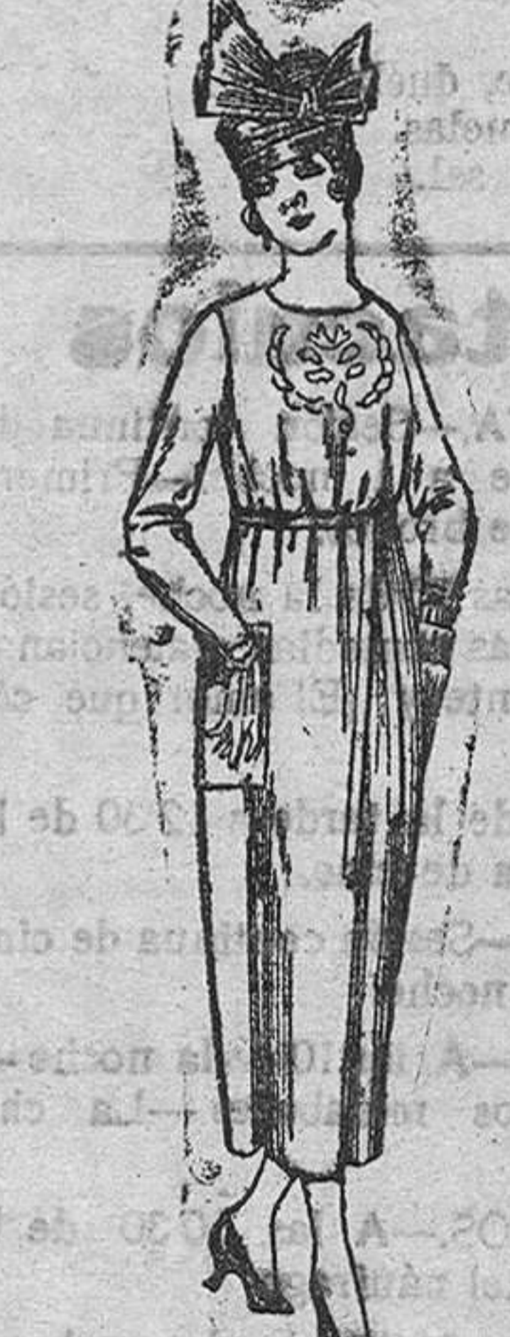
Vestidos de triot de lana, en azul y colores, bordados a mano, a pta. 112.

De uso universal como AGUA DE MESA NEURASTENIA, INDIPEPSIA, HIPERCLORHIDRICA Y CATARROS GASTRO-INTESTINALES.