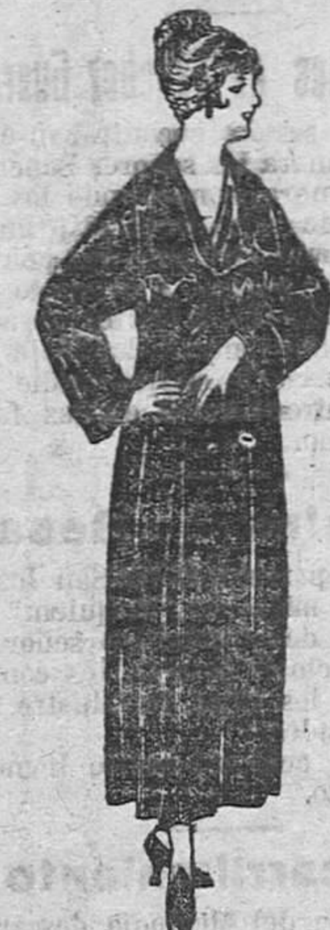
Batas de crepón, esterilla, etc., de ptas. 32 a 46.