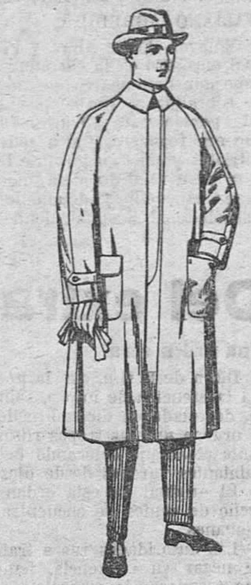
Impermeables, forma gabán, «Raglán», de ptas. 40 a 150.