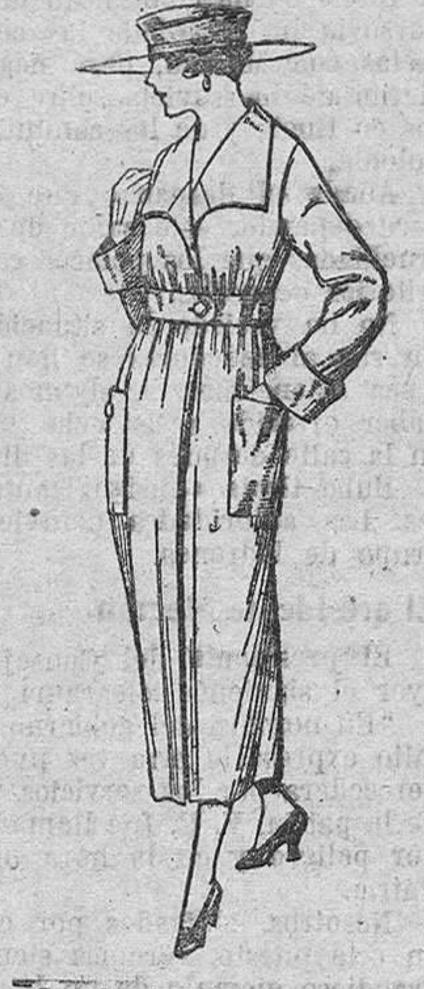
Guardapolvos de gabardina, dril y alpaca, colores beige, kaki, gris, etcétera, de ptas. 22 a 55.