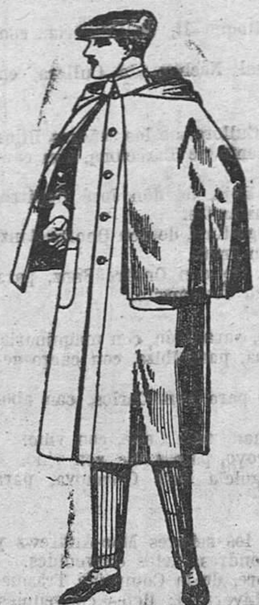
Impermeable forma Mackferland, en negro y azul, de ptas. 65 a 128.