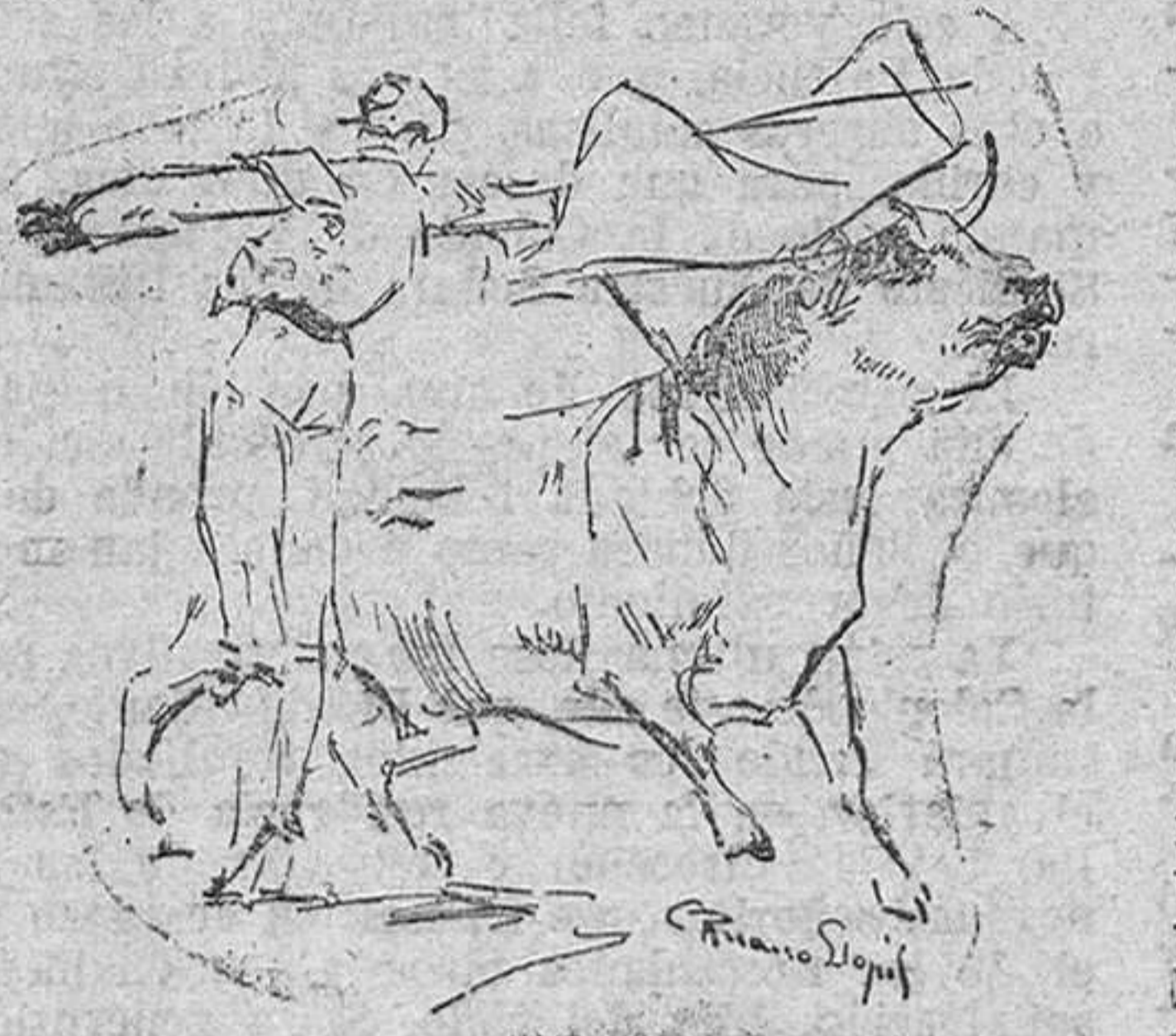
losa fidelidad lo que la retina sorprendió, conservando el torero su pose, la manera suya de ejecutar una misma suerte.

Exposición su admiración los diestros, maravillados ante el verismo de los momentos de la lidia, trasladados al lienzo por Ruano, reconociendo que solo un conocedor de los secretos del torero puede reproducir con tan escrupu-