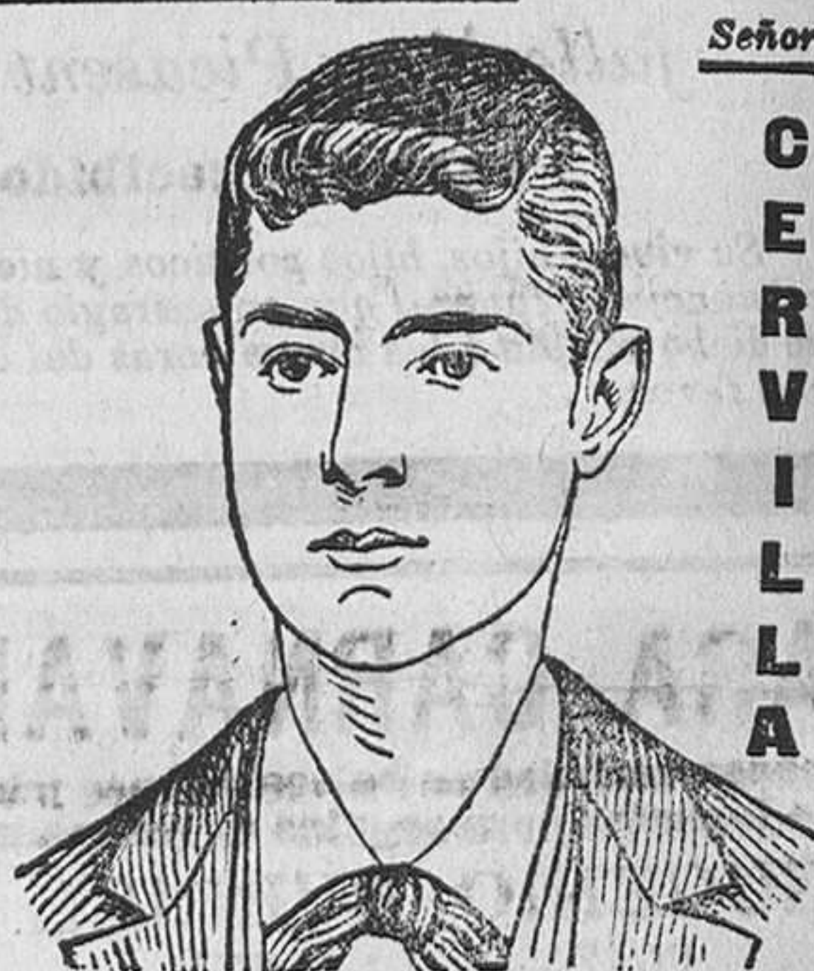
La Línea 2 de diciembre de 1901