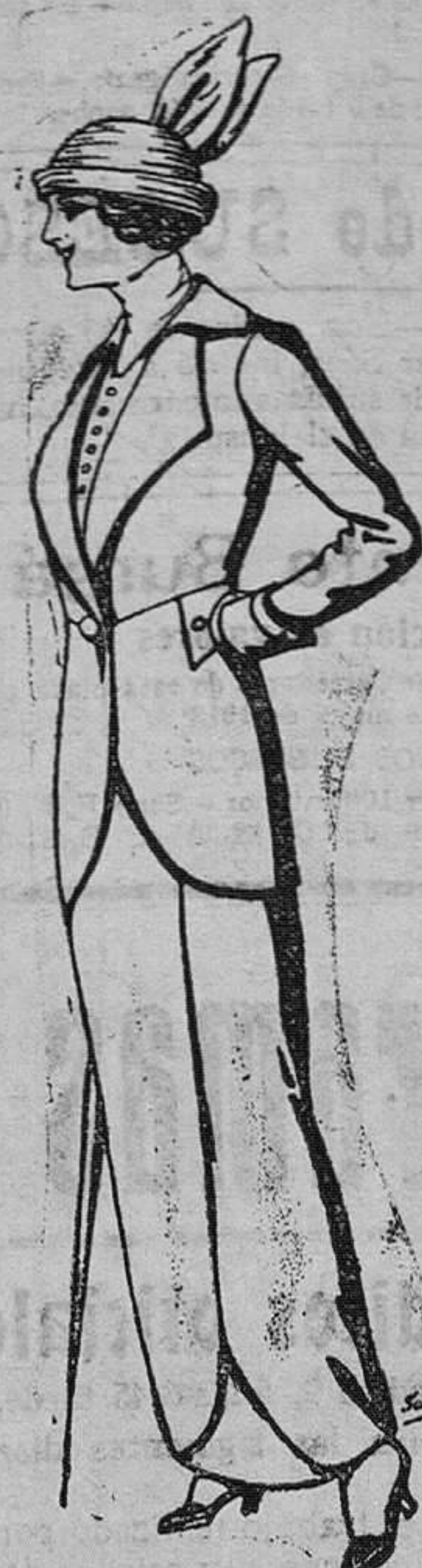
Traje estambre para señora De ptas. 65 á 75

Madrid, Barcelona, Alicante, Almería, Bilbao, Cádiz, Cartagena, Gijón, Granada, Málaga, Palma de Mallorca, Santander, Sevilla, Valladolid, Zaragoza