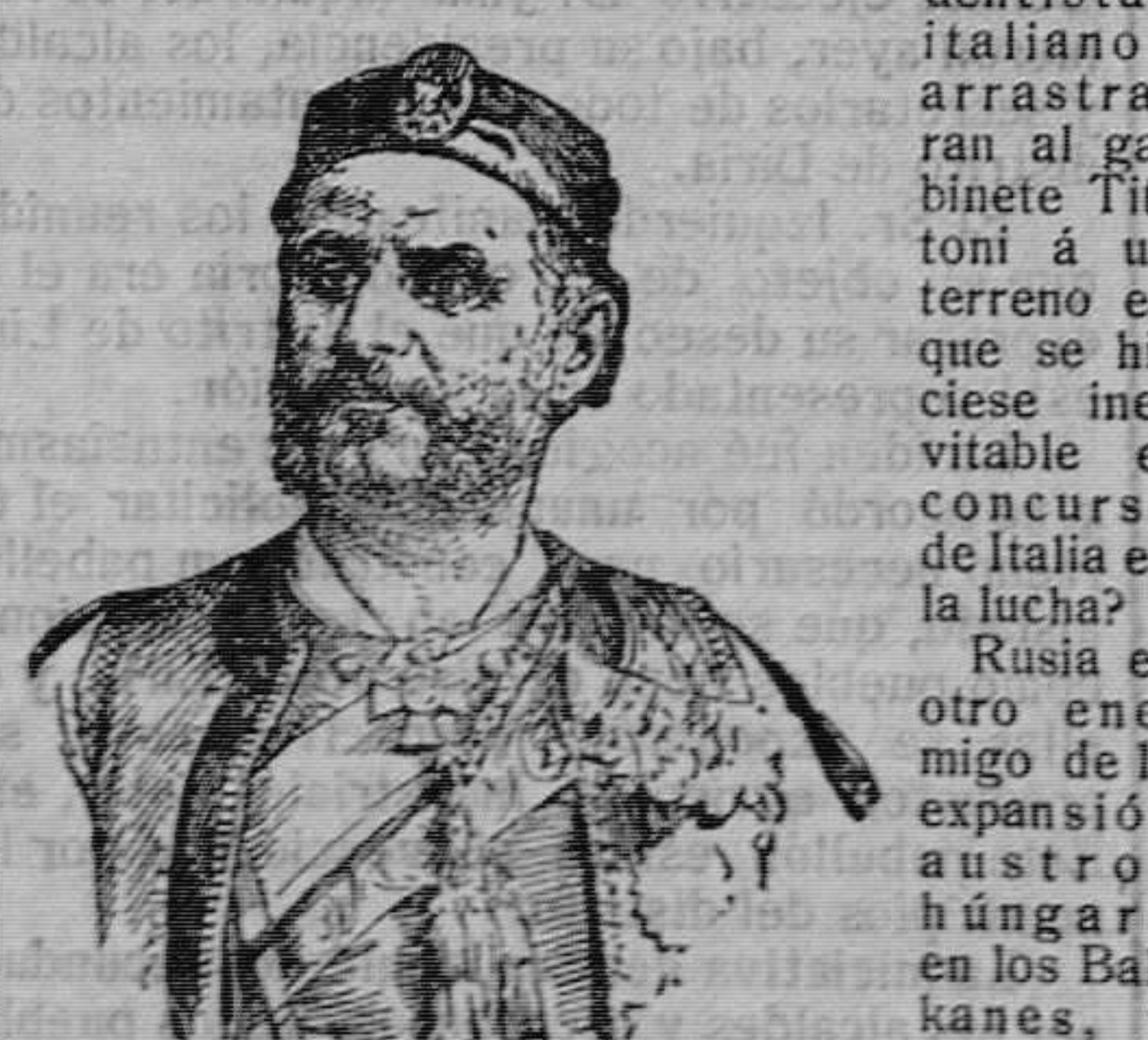
El príncipe Nicolás de Montenegro