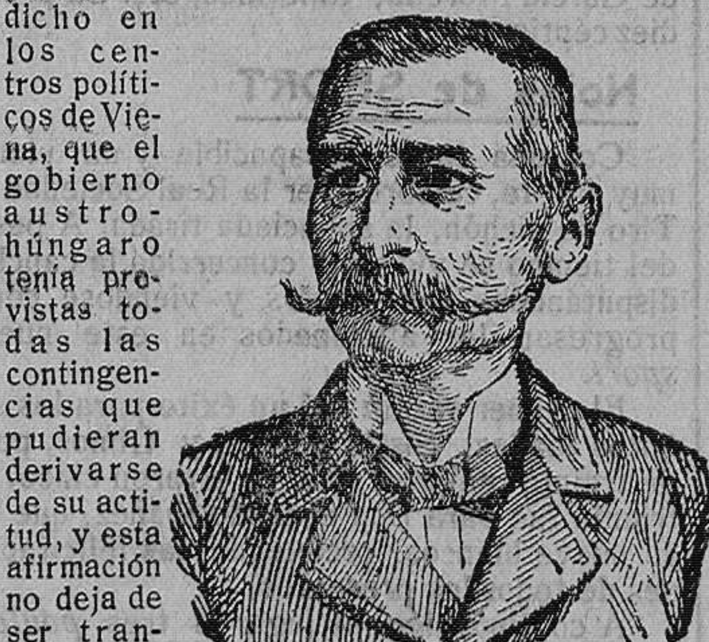
Pedro I de Servia