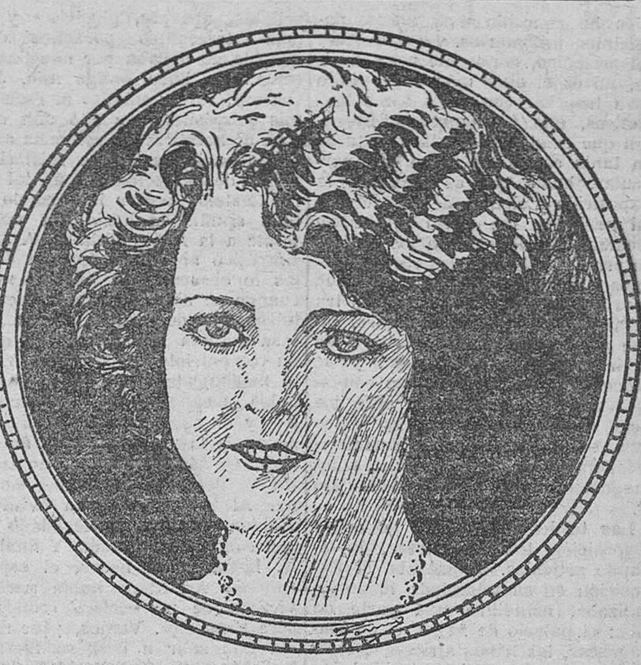
Blanche Mehaffey, distinguida artista de cine

Probablemente habrá quien se diga: «Acaso muchas películas americanas no son de aventuras?» Ciertamente sí; pero, ¿estamos obligados a exigir a los flamantes y pagados hijos del país del oro, que tengan nuestro discreto y noble criterio? Porque no solamente es la opinión pública quien nos cree de