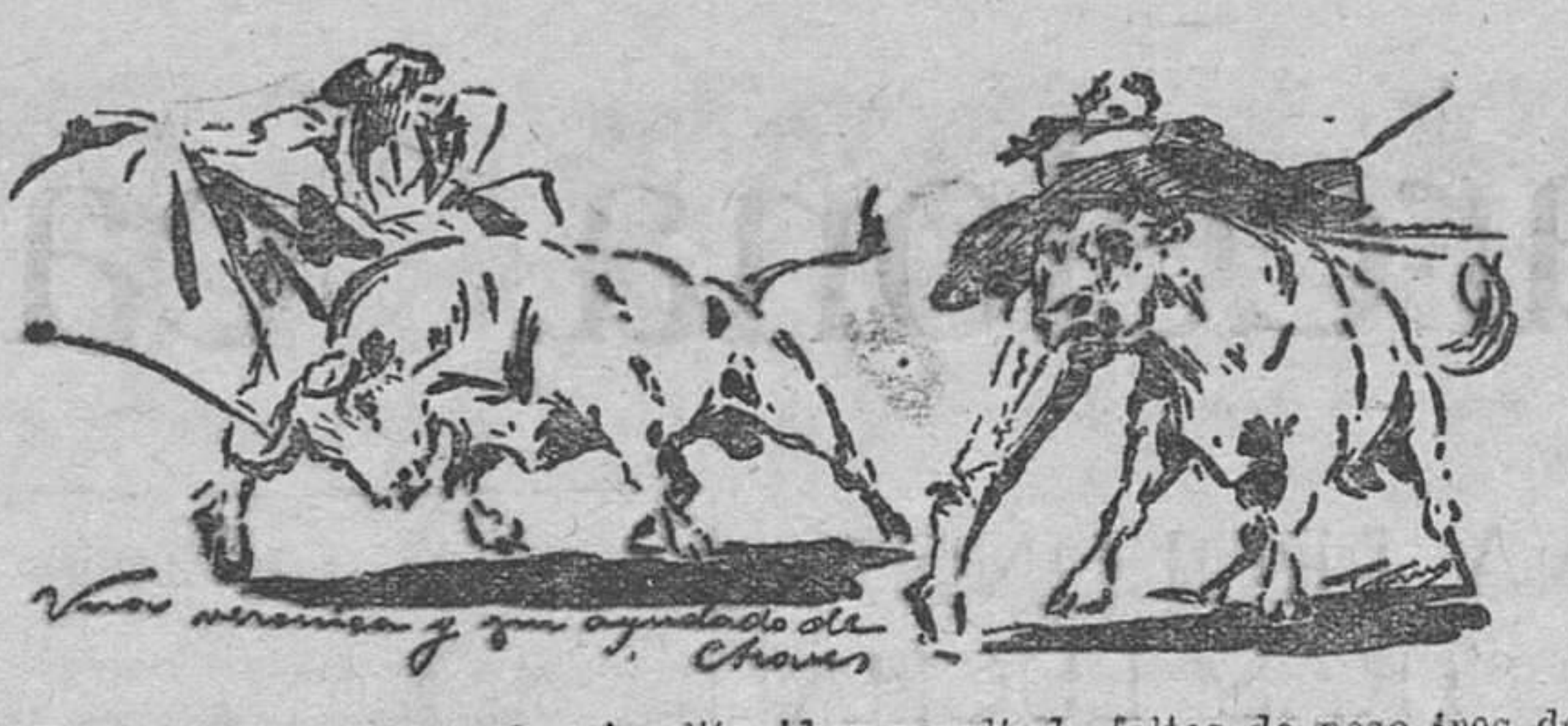
lades, pasó y se lidió el animalito, entre protestas más o menos ruidosas.

A partir de aquí, lector, lo que ocurrió fué ¡la caraba! Saló un toro pequeño, y se promueve la bronca más formidable que vieron los siglos. Se inunda el ruedo de almohadillas y se retira la almohada. Tendidos enteros se dedicaron a bailar; centenares de hombres cantaban a Belmonte el cuplet famoso de «Ladrón, ladrón, no mereces otro nombre»; algunos espectadores gritaban y encienzadamente, como cumpliendo un deber: ¡Beccerristas! miles de puños crispados se elevaban amenazadores; centenares de bastones se alzaban; el abucheo tomó mil variadas formas, y momento hubo en que se temió que media plaza se arrojará al ruedo. Aquello era un infierno de gritos, denuestos, insultos, proyectiles; una espantosa confusión. Saló por los chiqueros un toro pequeño, pero como los espectadores estaban ago-