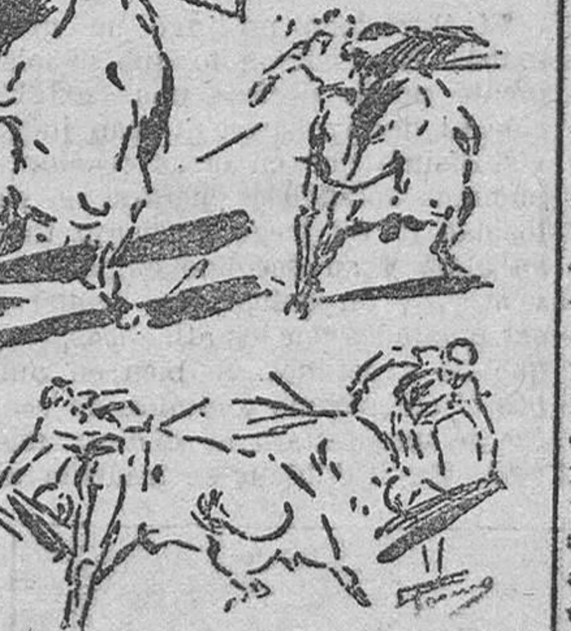
encorvado de lejos y huyendo, para intercalar tan solo un pase alto decente. Otra serie de pases con el pico de la tela, y entre una bronca regular, varios pinchazos huyendo y media delantera.

Ya está aquí el tan acreditado capítulo de responsabilidades. De que tenía razón el público al creer que se le engañaba, es prueba la imposición de varias multas gubernativas; pero, ¡claro!, las multas a cabeza pasada, o sea a espectáculo consumado, ni benefician ni satisfacen a nadie. De donde resulta que los verdaderos culpables de todo son los veterinarios, que dieron por útiles toros sin peso y sin edad, y cuando esto ocurre, el reglamento dispone que sean multados esos señores, y cuando la sanción se repita sean separados del cargo. Esto no ocurre nunca, no sabemos por qué, pero valdría la pena averiguar si los veterinarios del domingo son los mismos que dieron lugar a las multas que impuso en su tiempo el gobernador Calvo Sotelo y a las que impuso al año pasado el gobernador García Trejo, y si son los mismos, aplicarles severamente la sanción que merezcan. Porque ellos tienen la culpa de que se censurase a la autoridad del presidente, ya que gan por bueno lo que no es.