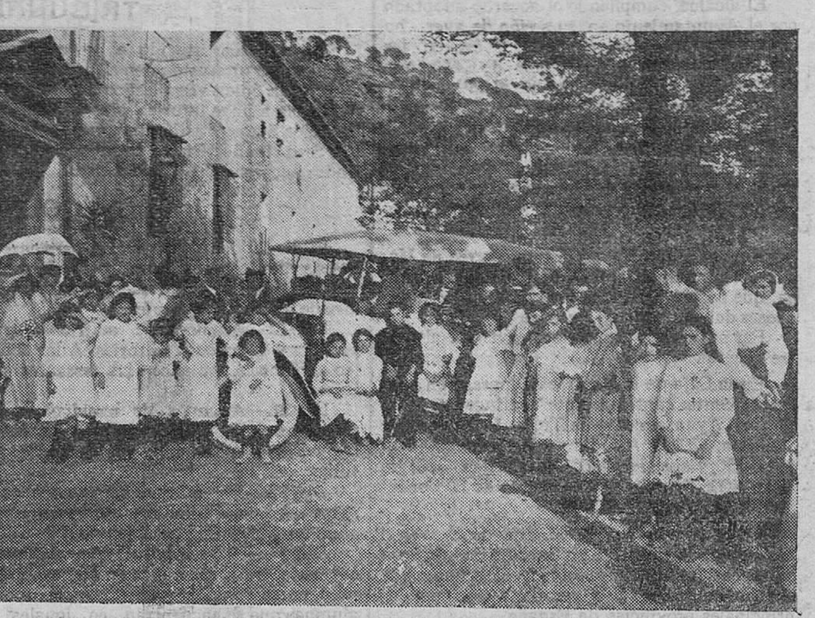
Preparando el regreso á Valencia, de la Colonia Escolar de Porta-Coeli

«¿Qué diferencia de unos momentos á otros! En fin, resignación, y á trabajar mucho. Con el trabajo lograremos nuestras aspiraciones legítimas de arte. Tal es mi fe y mi esperanza»