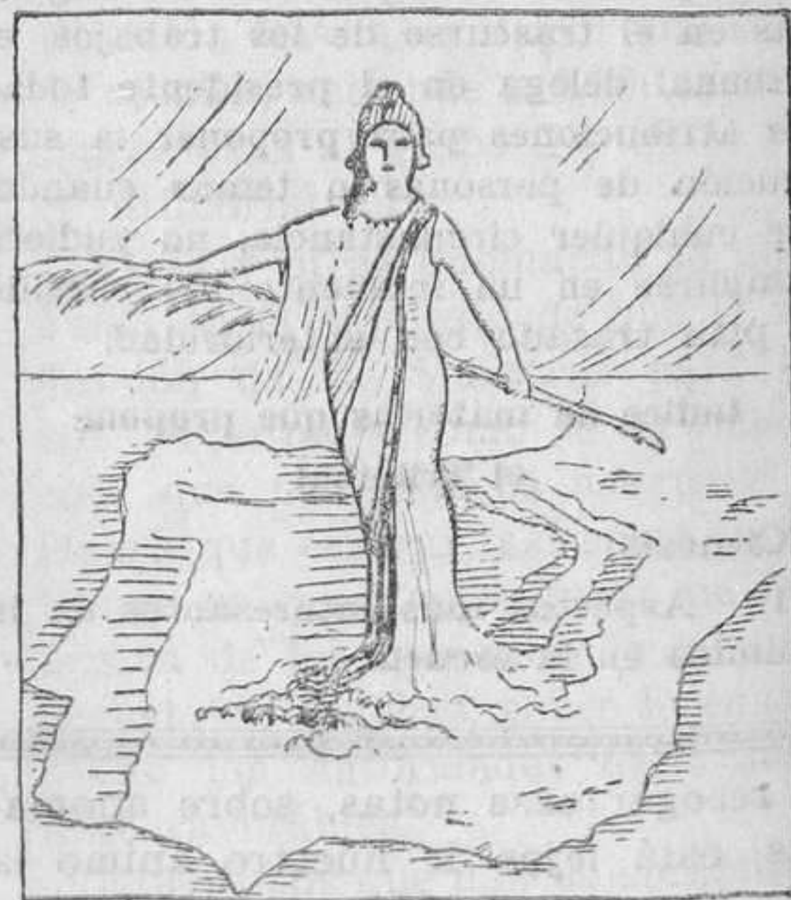
Nueva alegoría de la República, mag-níficamente impresa en once colores, ta-maño 70 x 100. Siete pesetas.