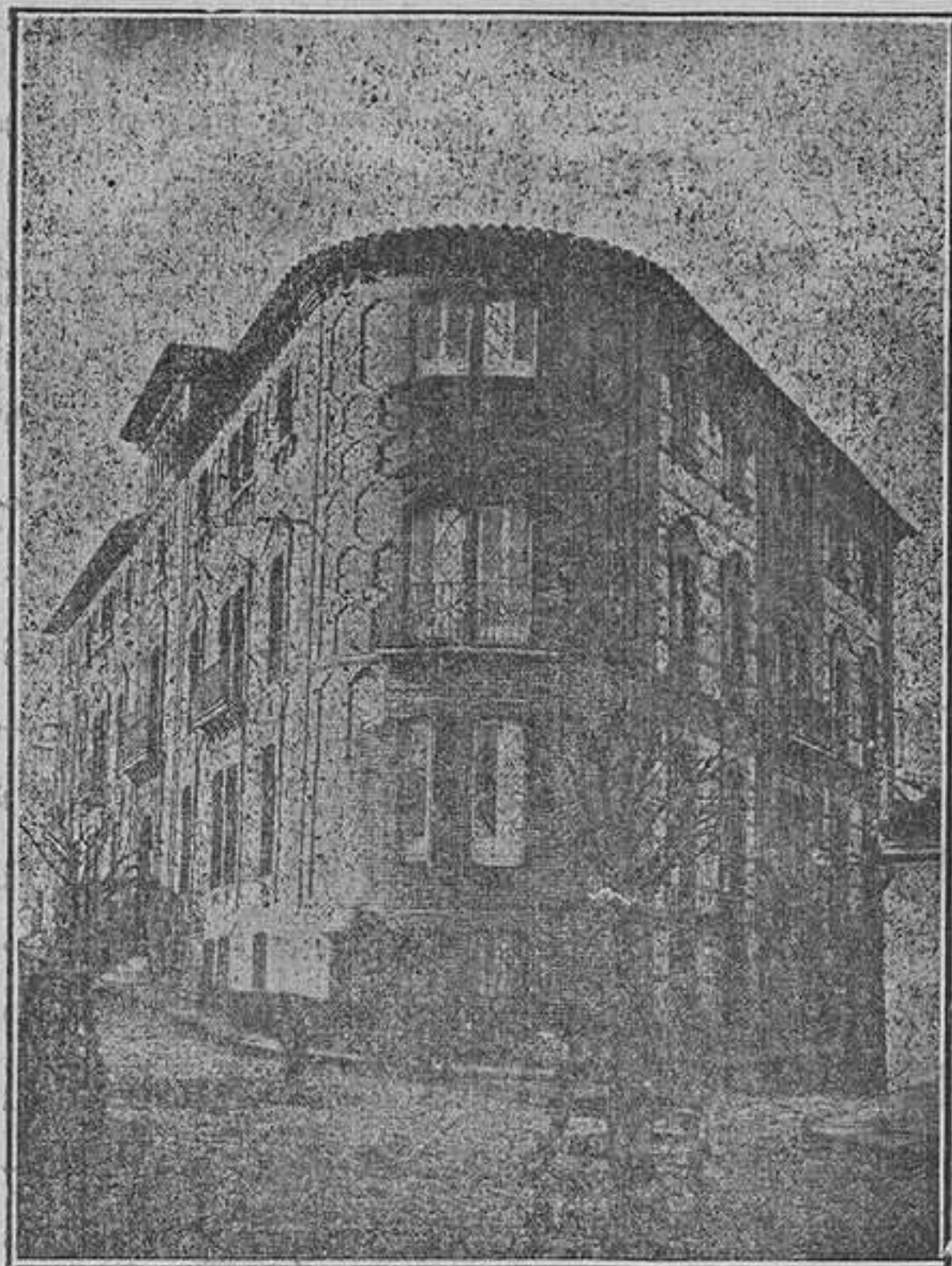
El Palacio municipal.