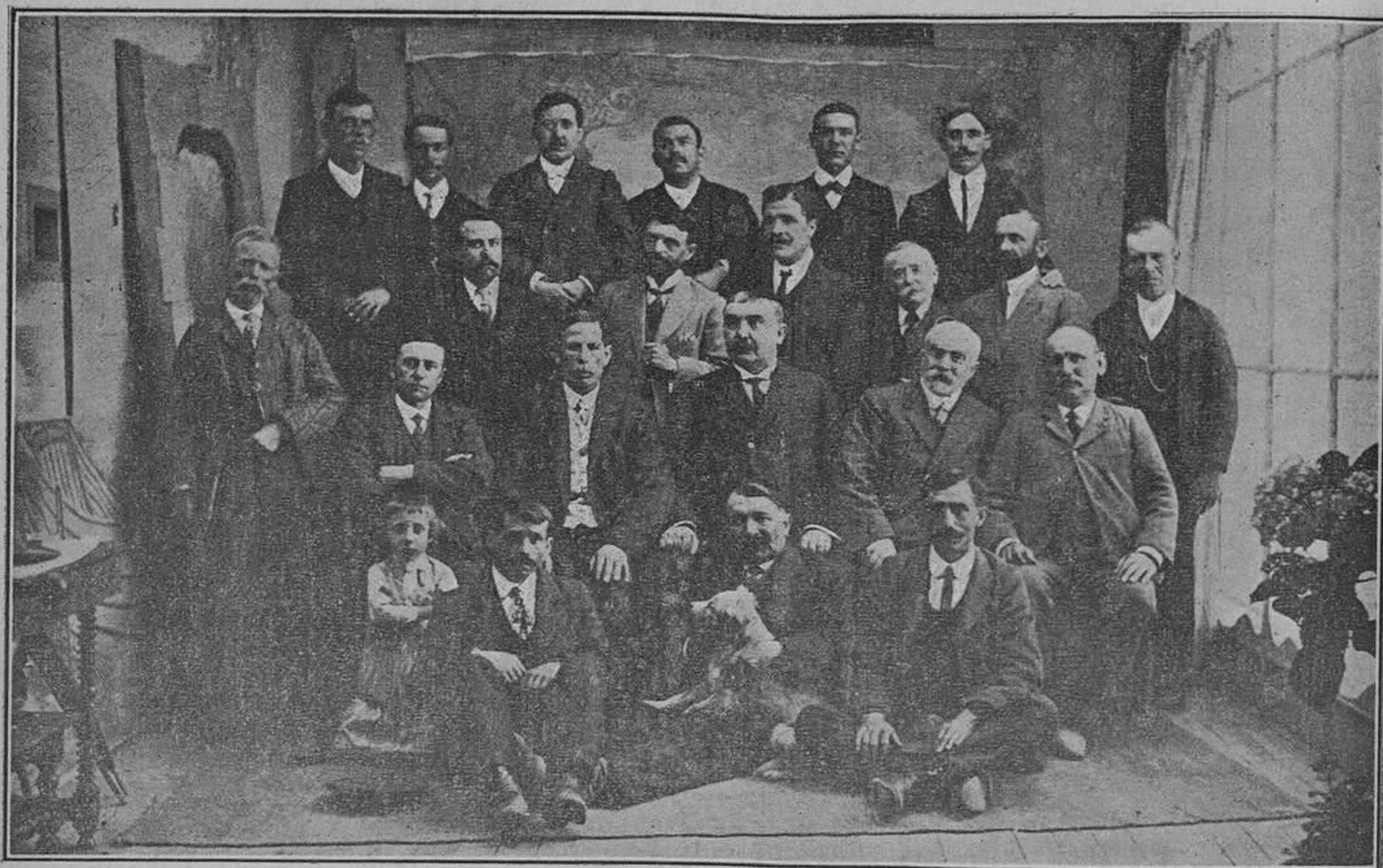
Grupo de varios de los concurrentes al almuerzo íntimo celebrado en Segovia en honor del Sr. de la Puerta.