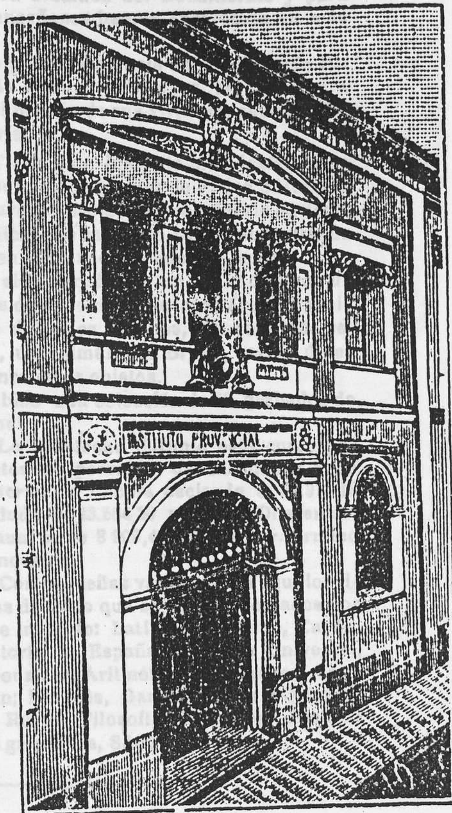
Portada del Instituto de segunda enseñanza de Zaragoza.