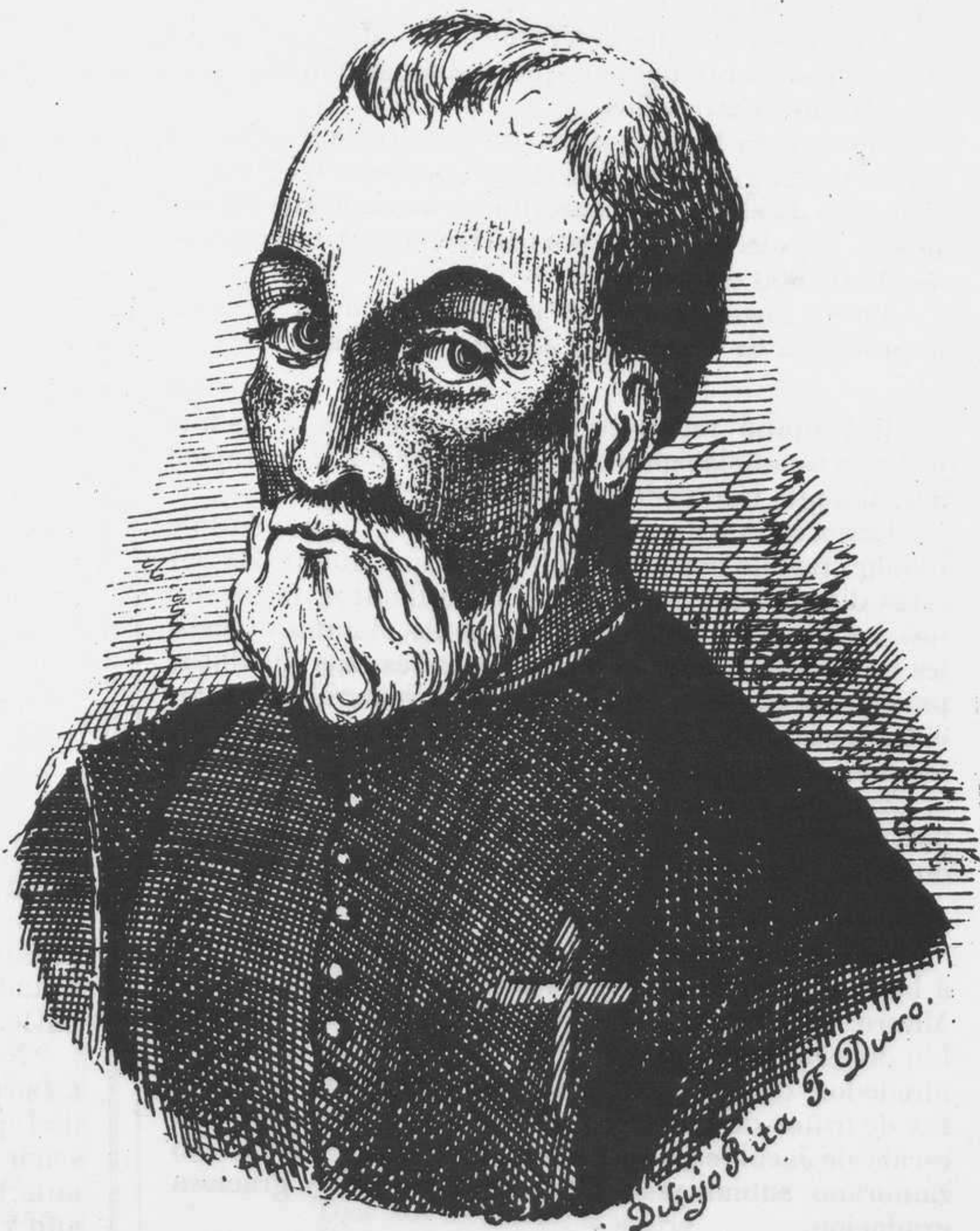
D. DIEGO DE ORDÁS.

La peregrinacion á Roma se organiza tambien y en general lo que en todas partes se creia un interés postpuesto al hervor de la política es el objeto de la preocupacion corriente.