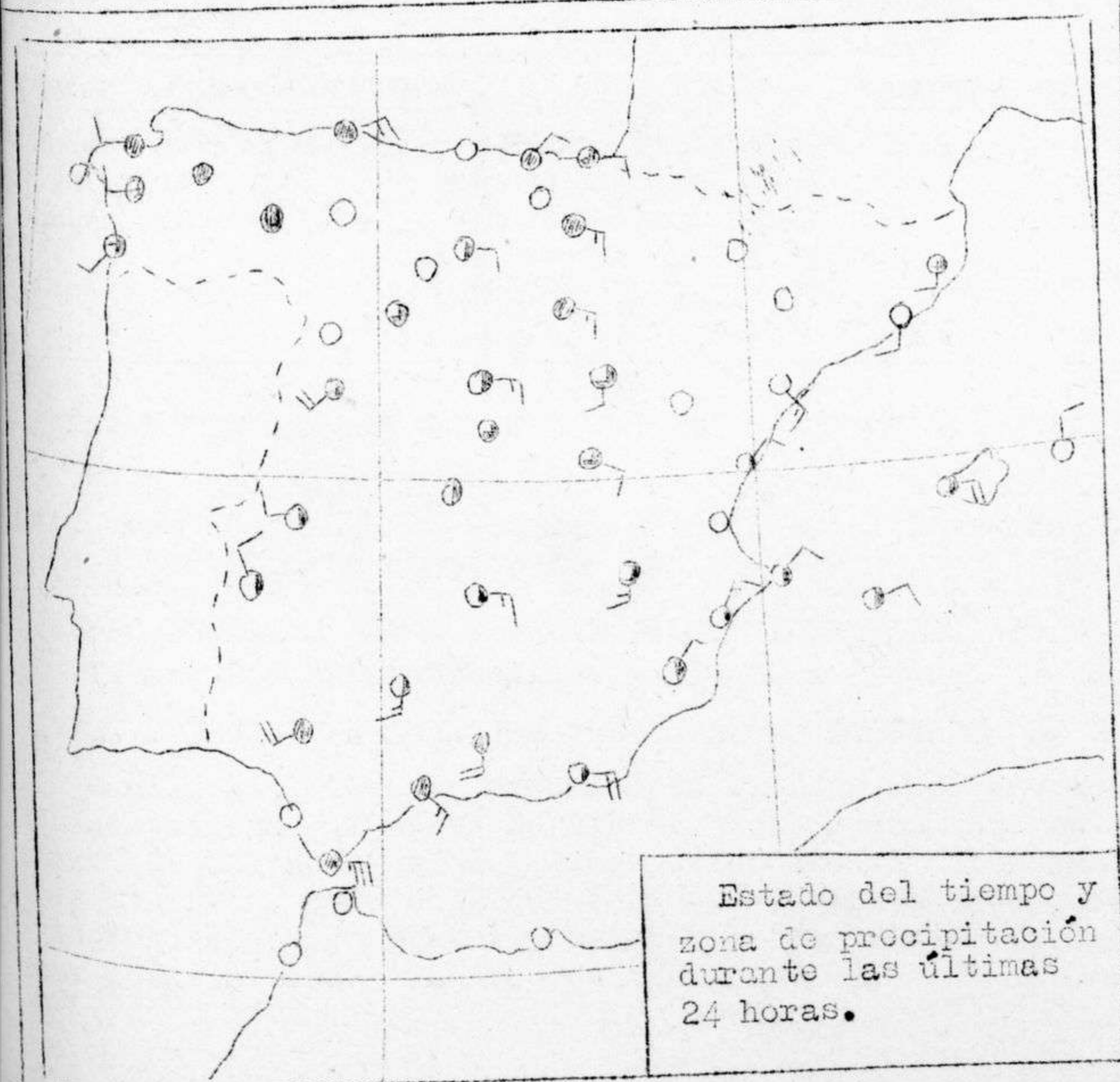
Estado del tiempo y zona de precipitación durante las últimas 24 horas.