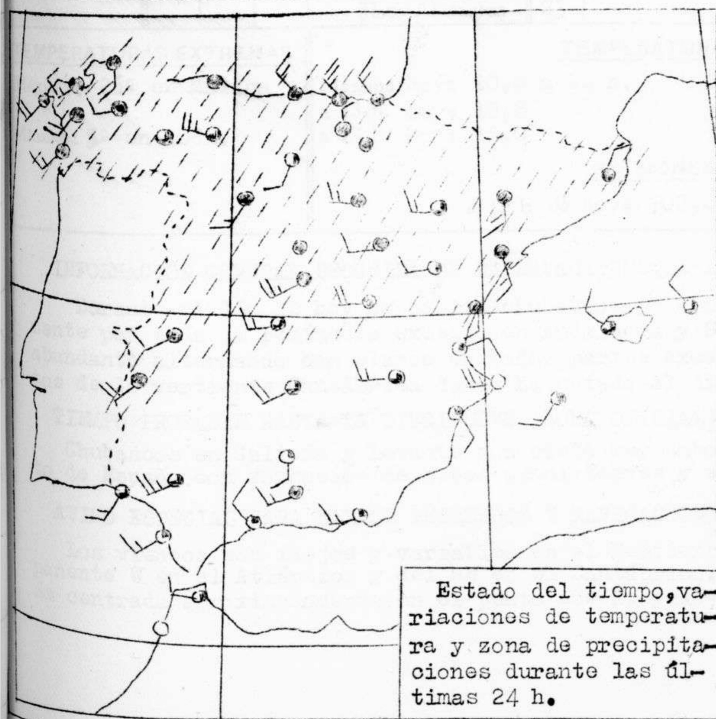
Estado del tiempo, variaciones de temperatura y zona de precipitaciones durante las últimas 24 h.