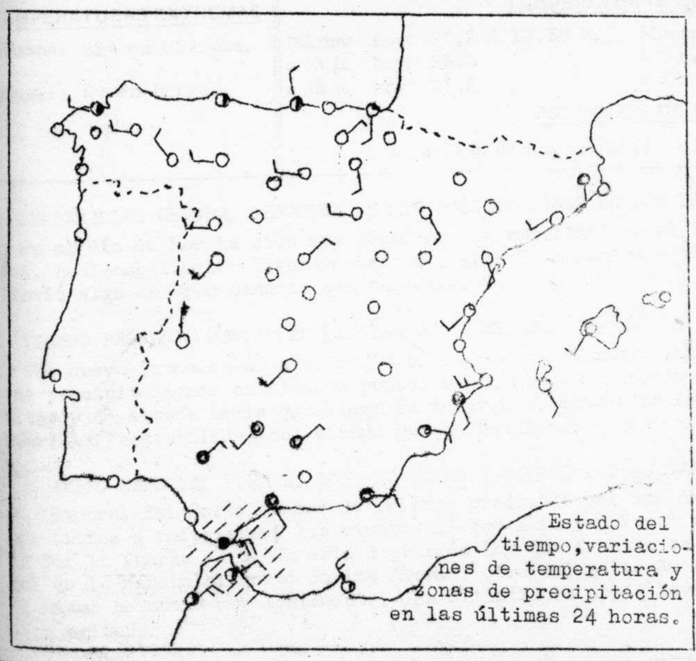
Estado del tiempo, variaciones de temperatura y zonas de precipitación en las últimas 24 horas.