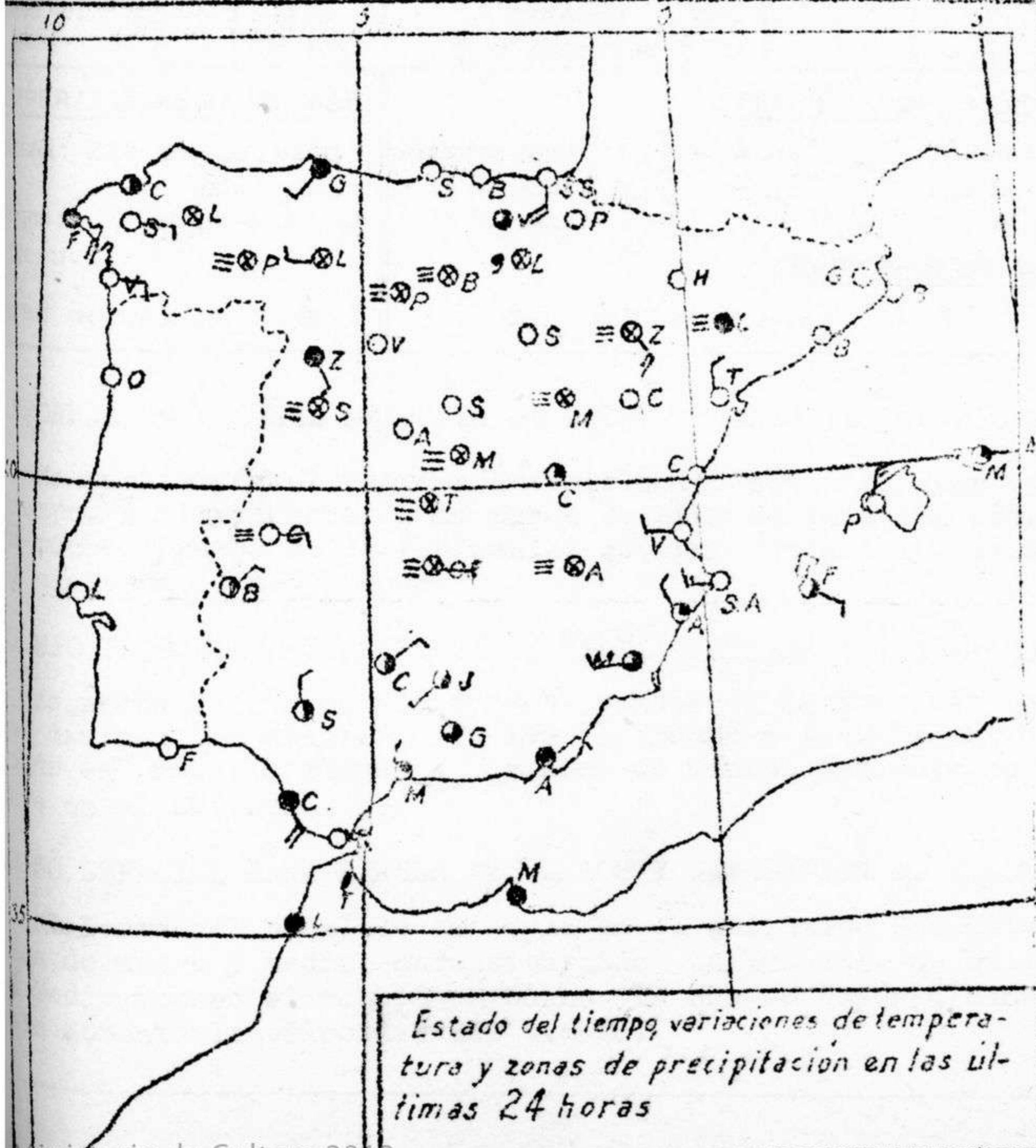
Estado del tiempo, variaciones de temperatura y zonas de precipitación en las últimas 24 horas