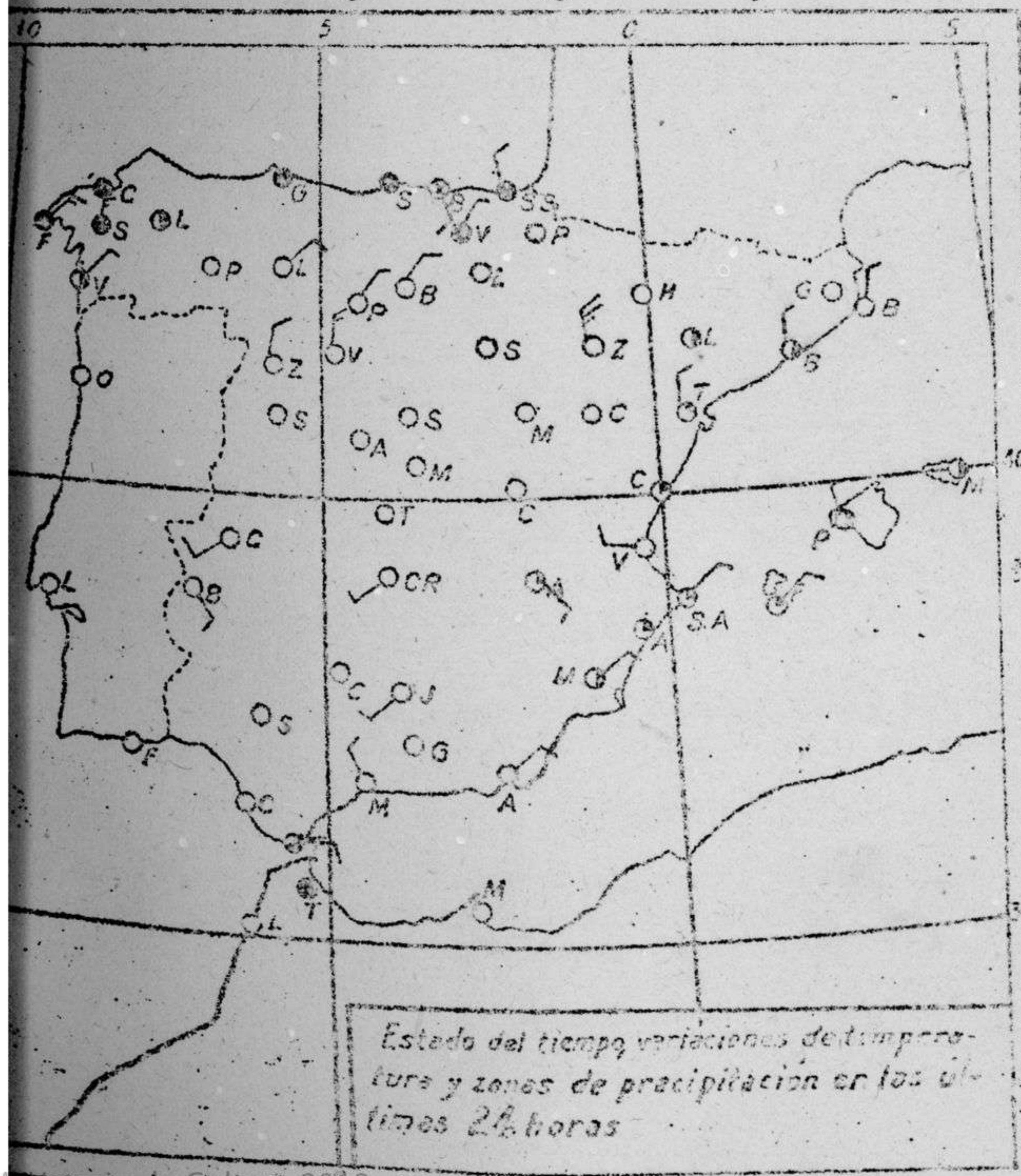
Estado del tiempo, variaciones de temperatura y zonas de precipitación en las últimas 24 horas