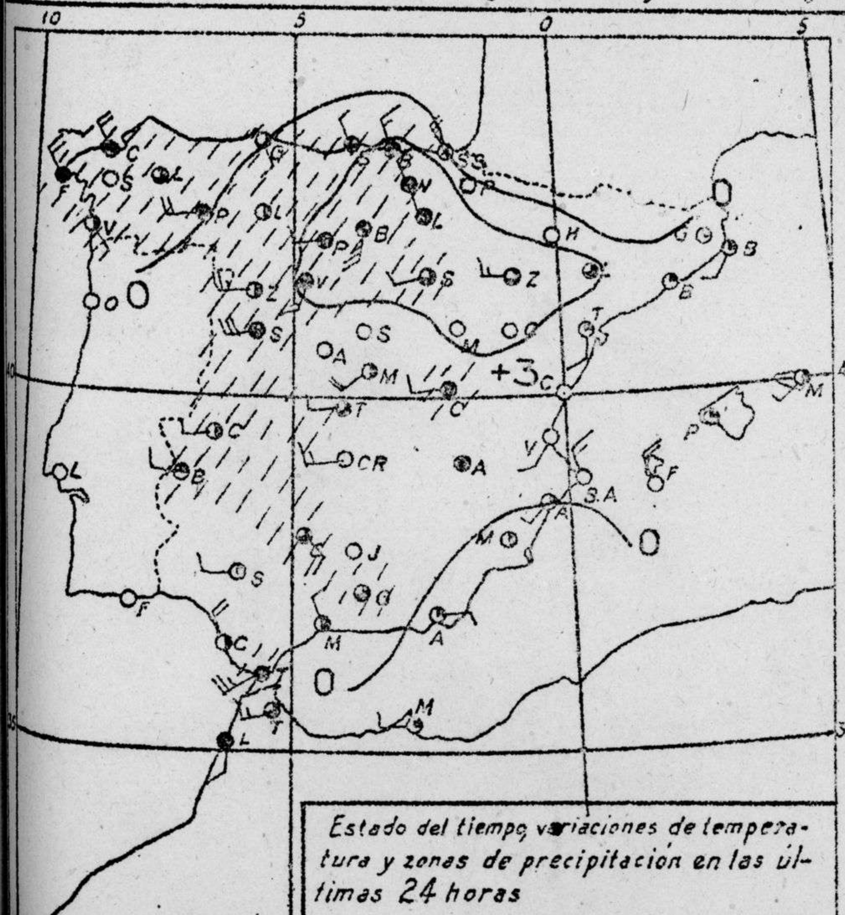
Estado del tiempo, variaciones de temperatura y zonas de precipitación en las últimas 24 horas