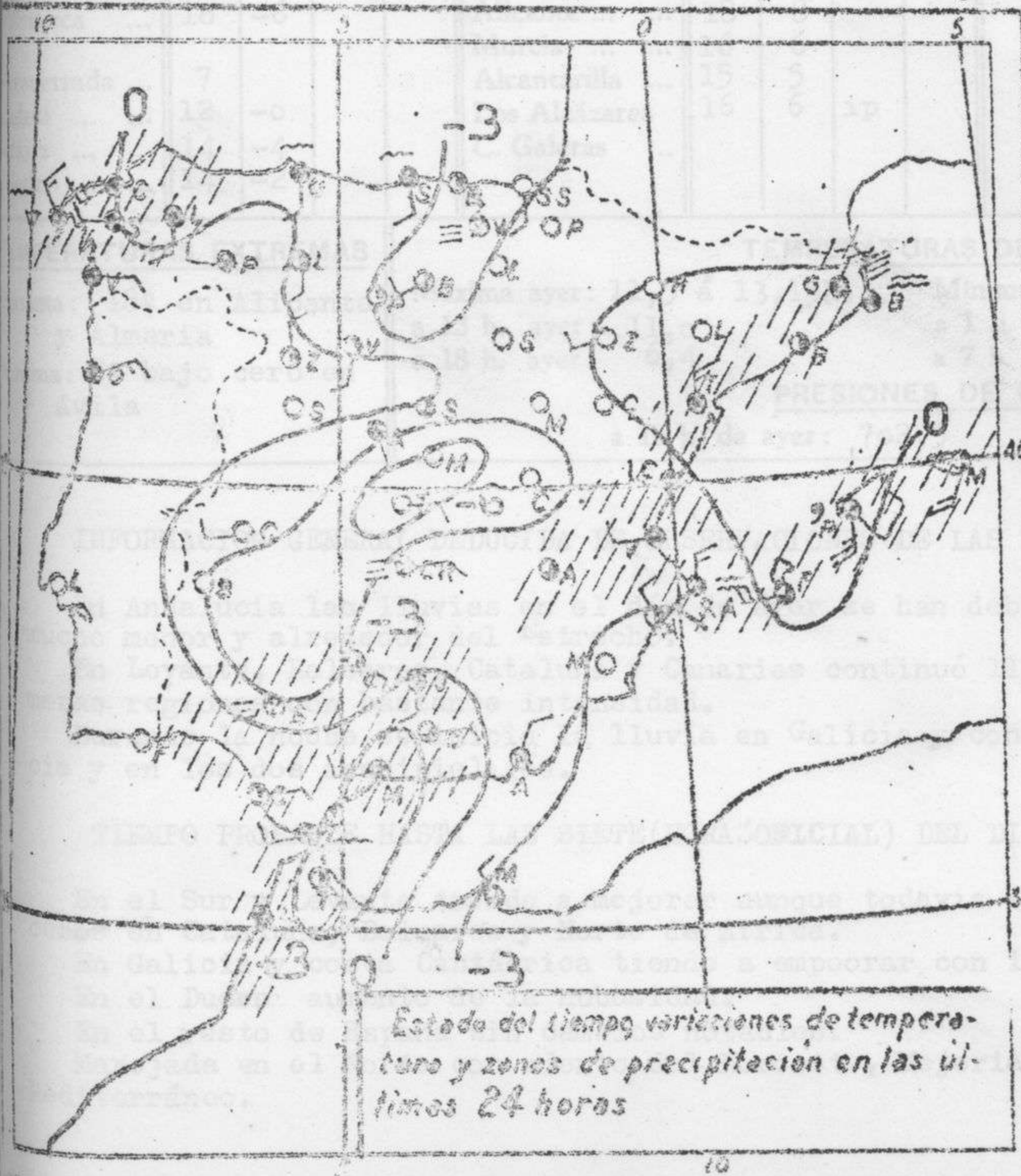
Estado del tiempo variaciones de temperatura y zonas de precipitación en las últimas 24 horas