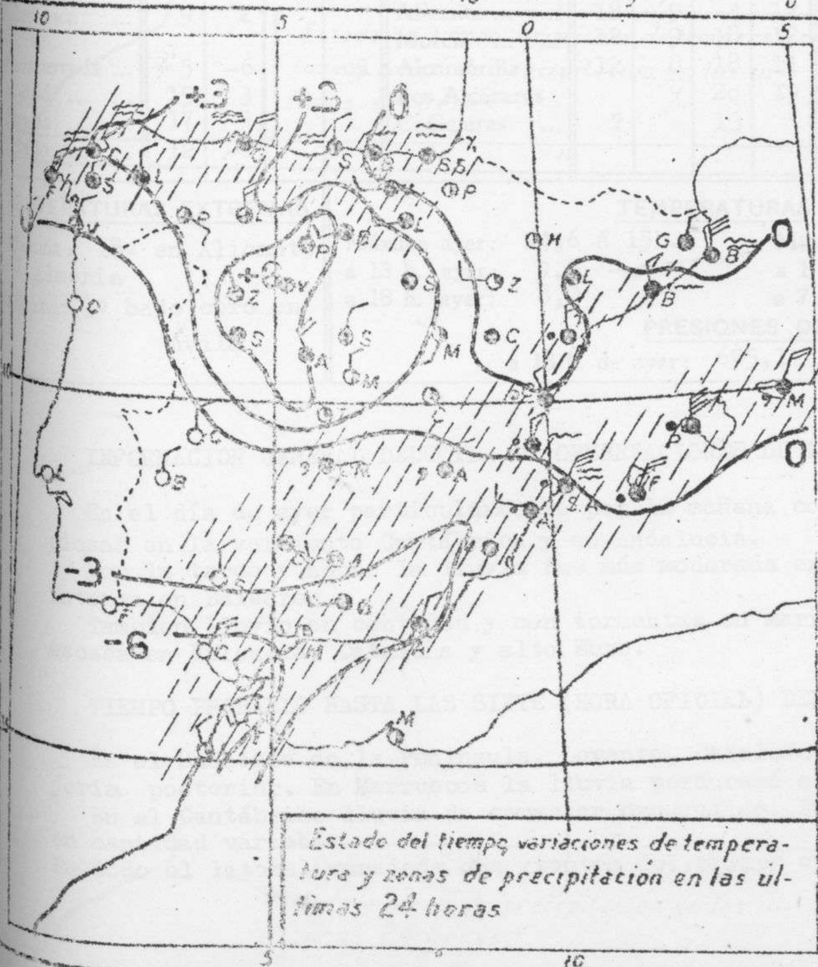
Estado del tiempo, variaciones de temperatura y zonas de precipitación en las últimas 24 horas