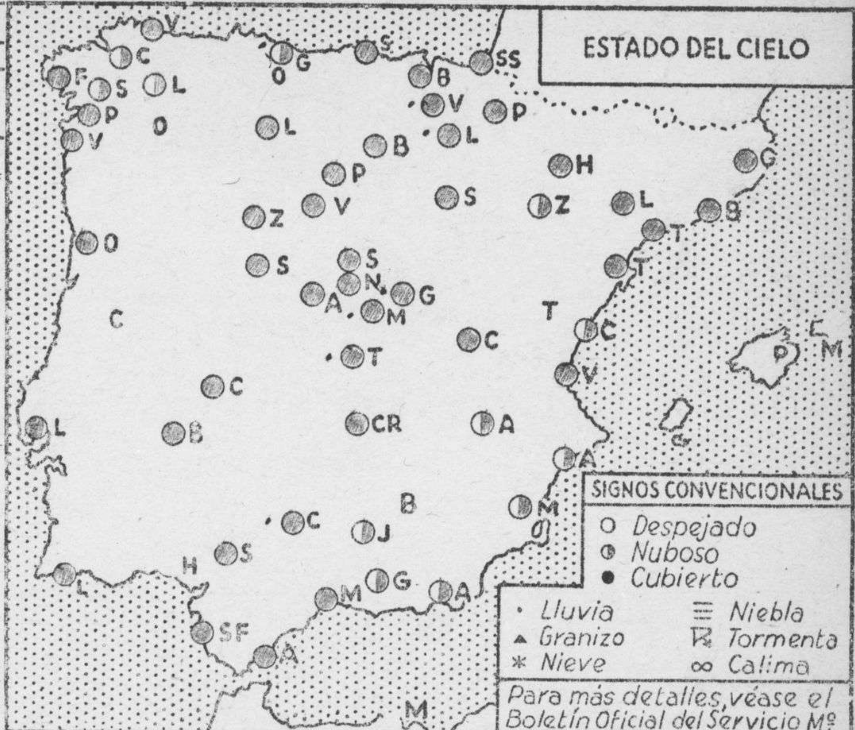
ESTADO DEL CIELO