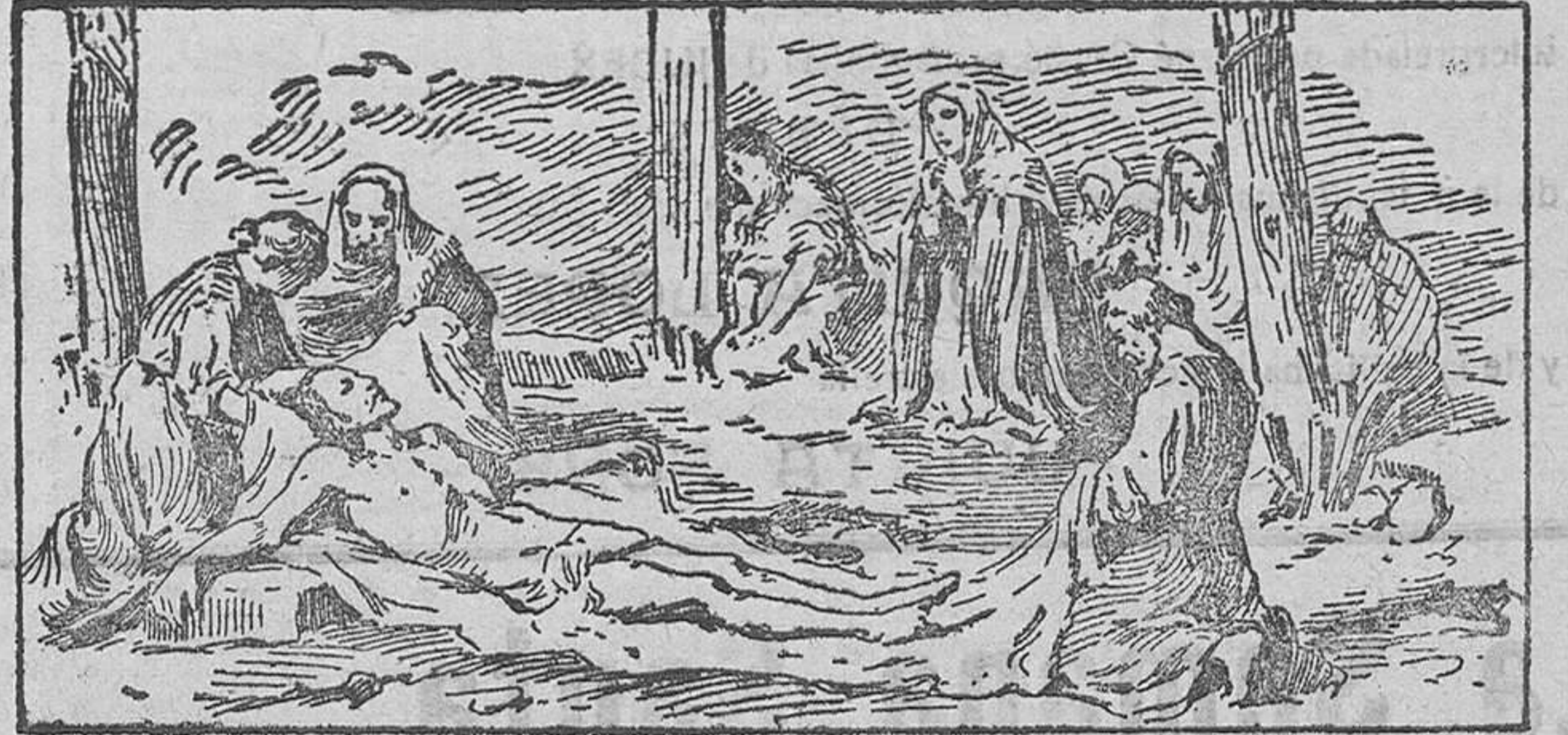
EN EL CALVARIO

La sangre de Cristo, el espíritu de Cristo suscitan el grande valor a toda prueba de los mártires sin número que en los esteriores de sus agonías espantables, consagran su último esfuerzo pronunciando el nombre ben-