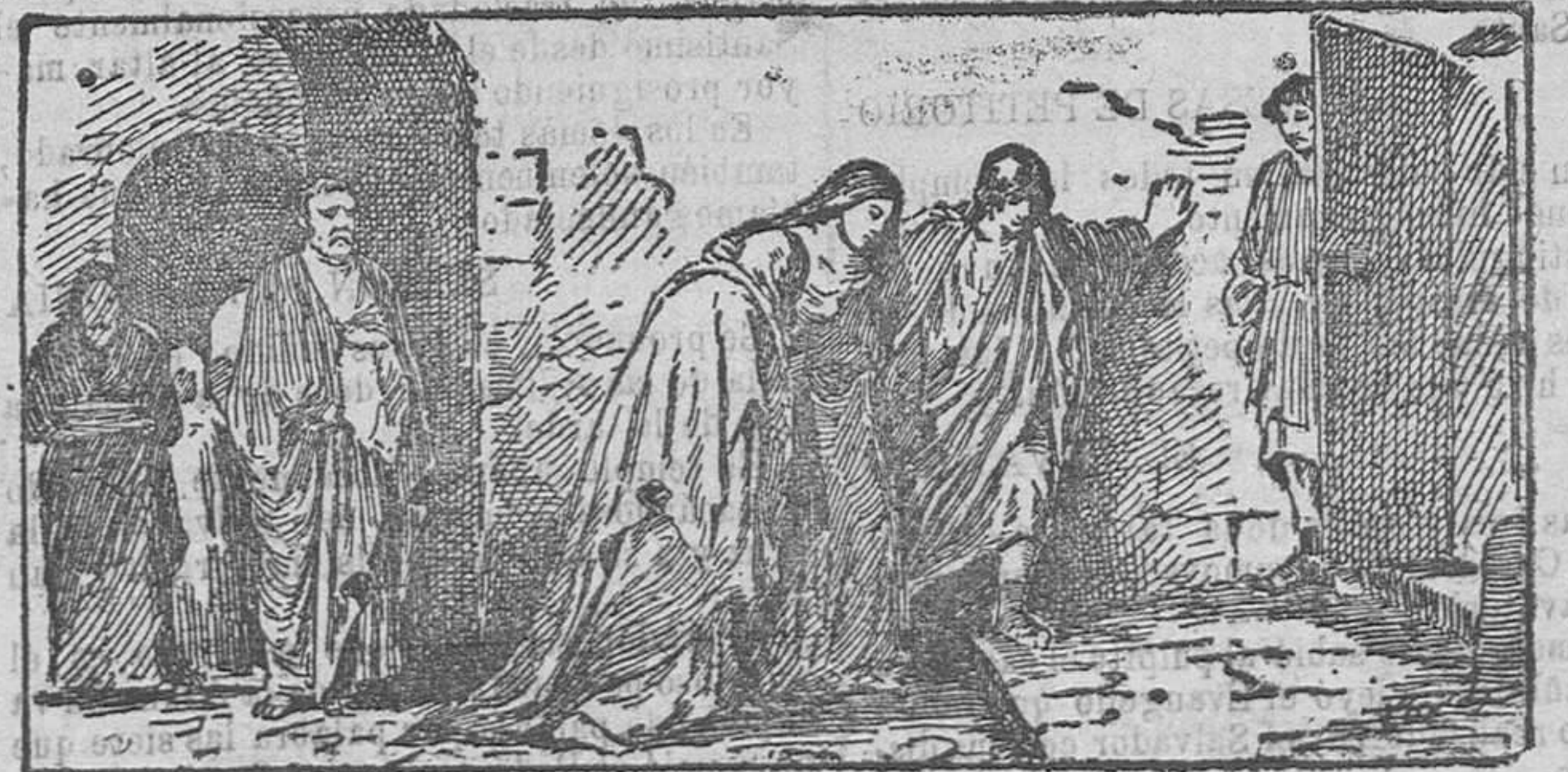
La vuelta del Gólgota

Y ¿cuál hombre no llorara, si la madre contemplara de Cristo tanto dolor? Y ¿quién no se entristeciera,