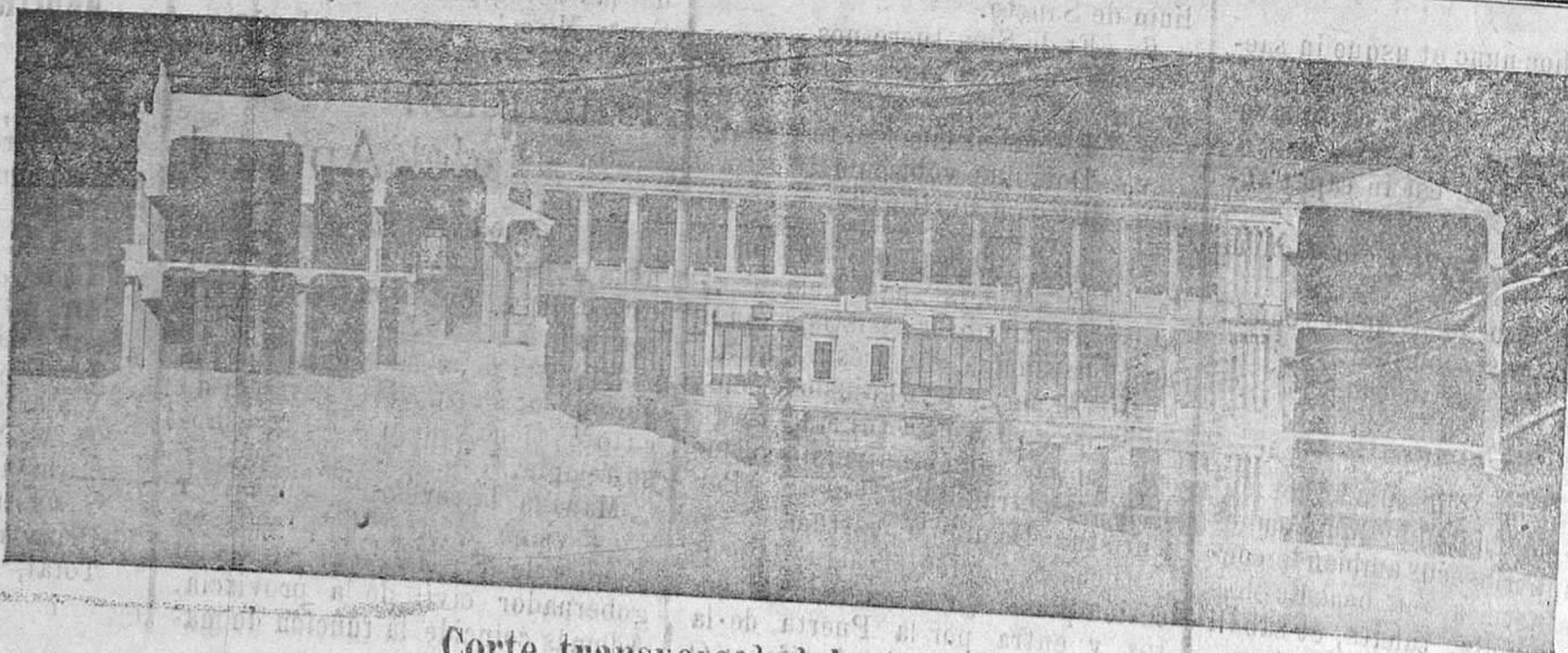
Corte transversal del nuevo edificio

Todas estas aulas se destinan a las enseñanzas que necesitan contando con la enfermería, así es que