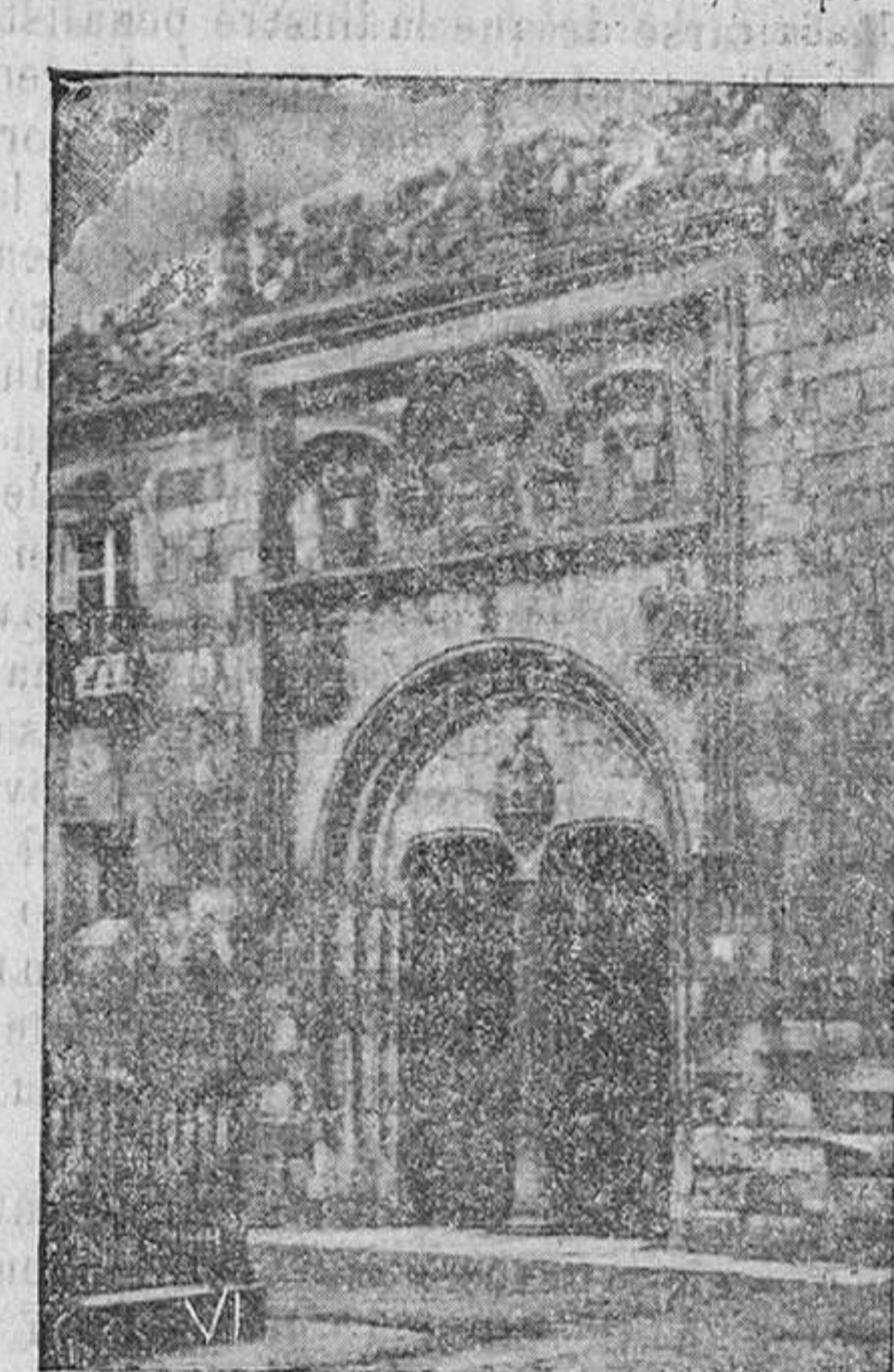
Salamanca. Puerta de entrada al Archivo.

Asistieron a ella desfilando ante el Presidente y los ministros la audiencia, claustro universitario, diputación, ayuntamiento, arzobispo y obispo con el Cebido, real maestranza, Sociedad Económica, corporaciones académicas, señores, caballeros grandes cruces, gentiles hombres, Ordenes Militares, representantes consulares, representaciones populares, capitán general, generales, jefes y oficiales del Ejército.