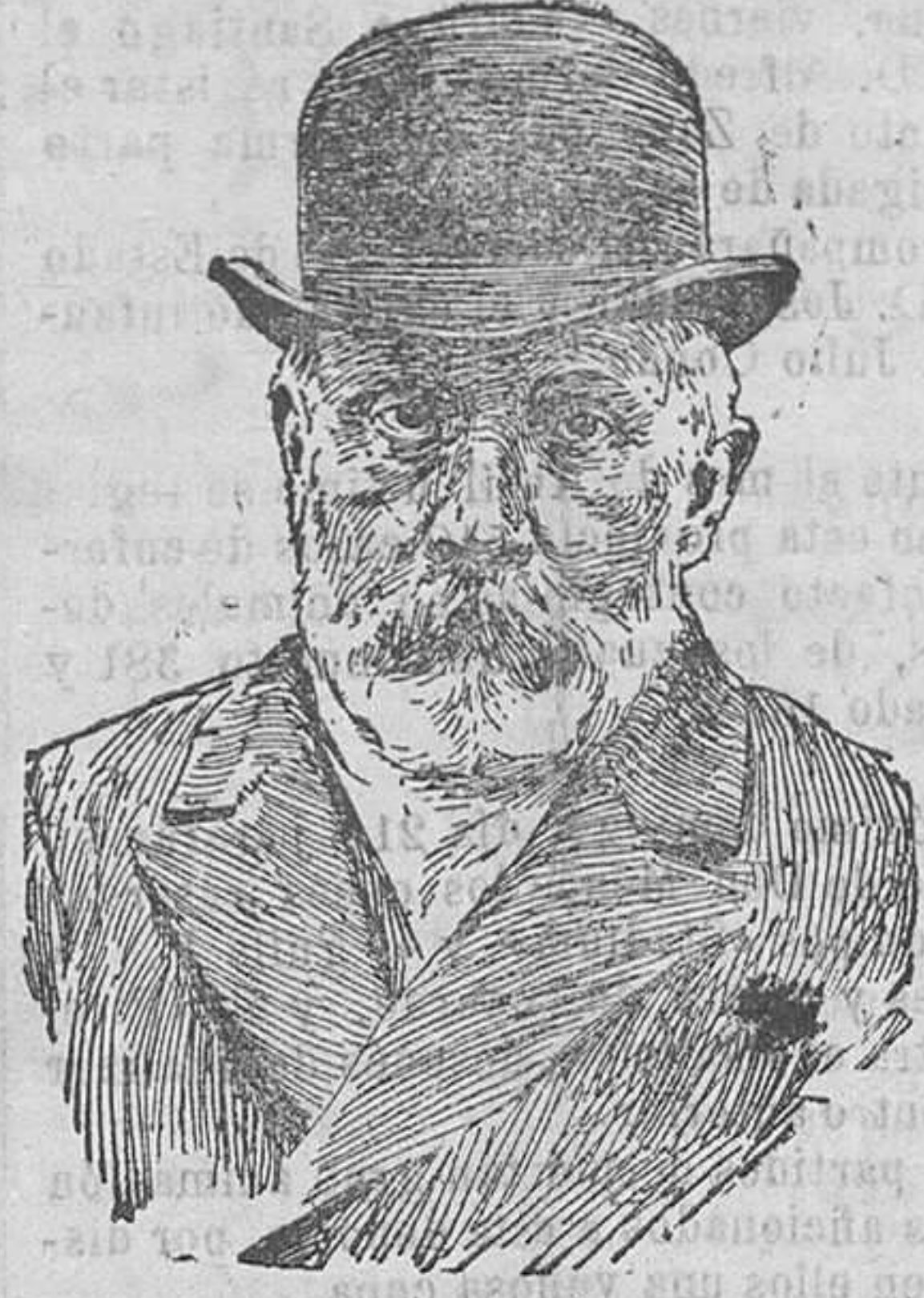
El leader del socialismo español Pablo Iglesias, que se encuentra gravemente enfermo.