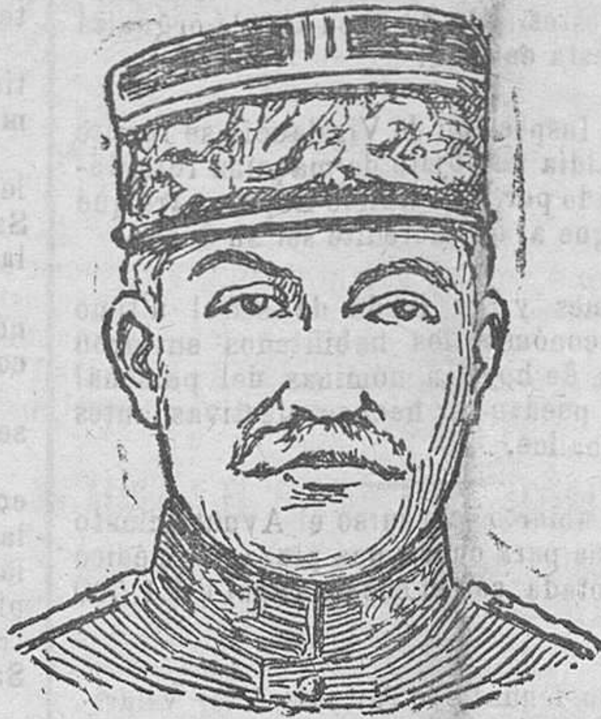
El general francés Chambrin, comandante de puestos, que toma parte activa en la lucha que sostienen los soldados franceses con los moros adictos a Abd-el-Krim.

cia, el uno, y torpe, más influyente, el otro; hijo de un modesto funcionario el primero y de un cacique pueblerino el segundo. Ambos aprobaban sus ejercicios, el uno por su valía, el otro por los buenos servicios de su padre a un partido político. Luchando llegaron hasta el último ejercicio, en que el hijo del cacique adelantó al huérfano de la influencia, por haber conseguido del tribunal examinador la máxima puntuación.