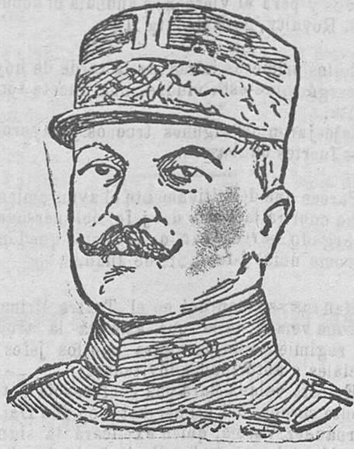
El general francés Nautin, nuevo jefe superior del ejército de operaciones en Marruecos