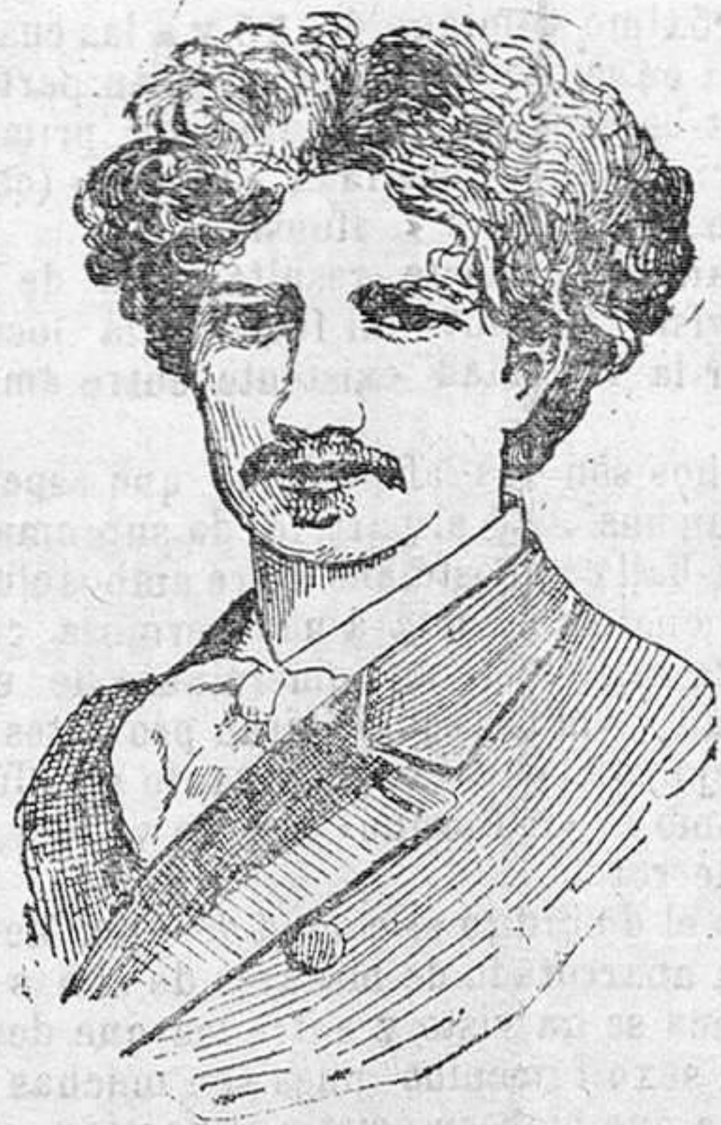
El pianista polaco Padesevski, al que el Rey de Bélgica acaba de imponer el Gran cordón de la Orden de Leopoldo, como premio a sus grandes méritos.

de su corazón sobre estos pequeños seres, aunque escondiendo su egregio nombre, bajo el delicado y encantador pseudónimo Farfalla azul (Mariposa azul).