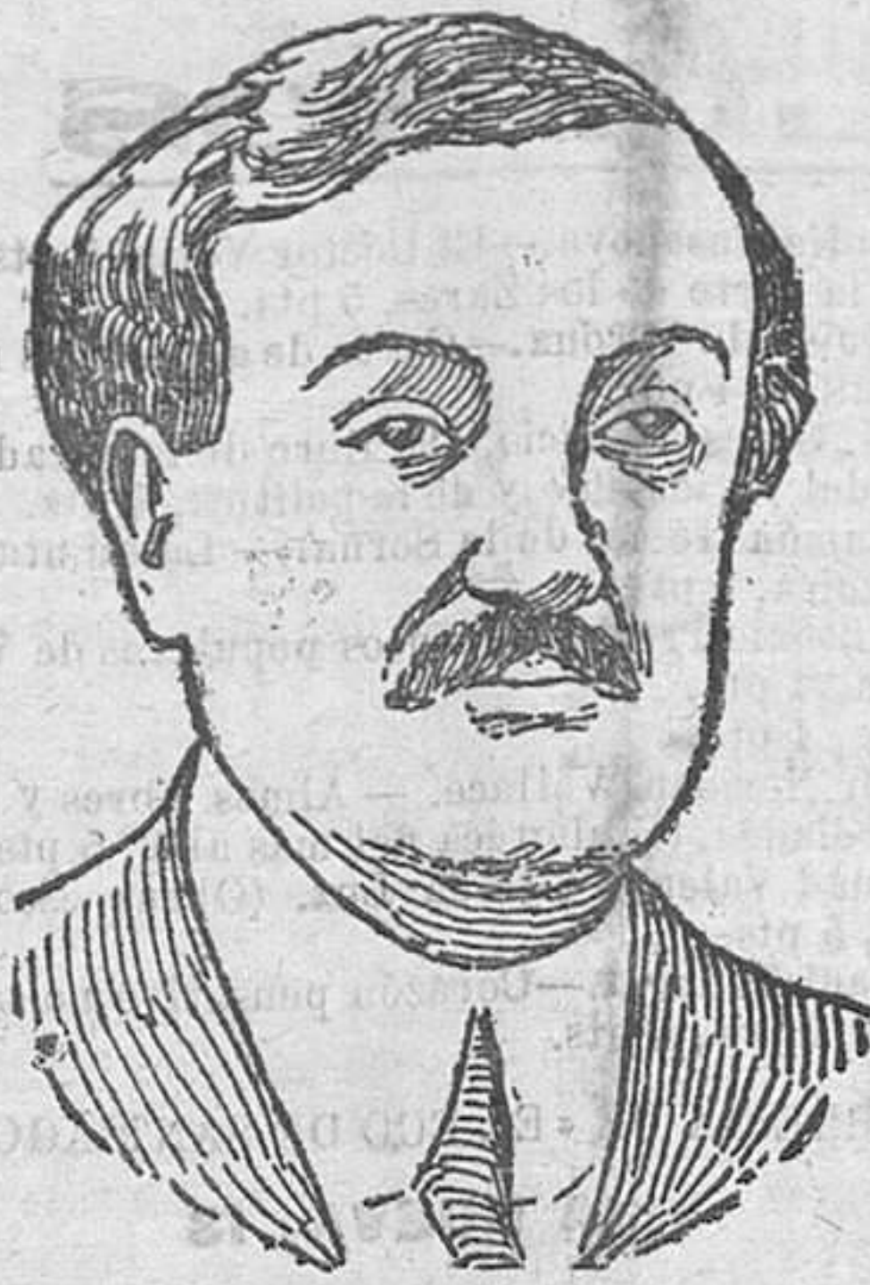
M. Malvi, exministro francés, que ha llegado a España comisionado por su Gobierno, para resolver asuntos diplomáticos

Miñas musas... ¡son os dentes! ¡Meu buche, o monte Parnaso!