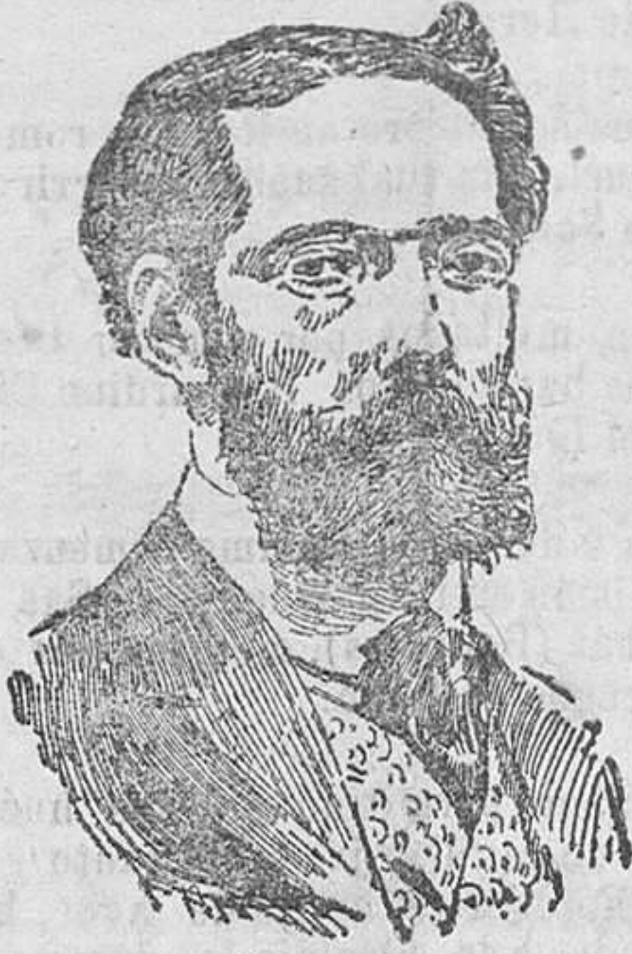
El Maestro Arbós, Director de la Sinfónica, que hoy llegó a Santiago para dirigir los dos conciertos de la gran orquesta.

Y ahora recordemos su última obra sobre la que un tupido manto de leyendas ha caído el «Requiem».