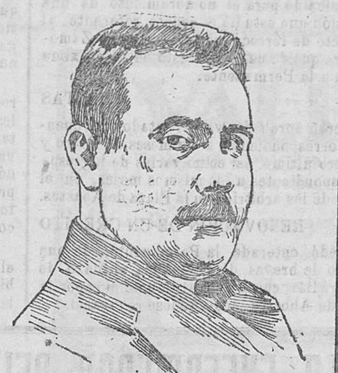
El maestro D. Pablo Luna, que ha obtenido un clamoroso éxito con la partitura de la zarzuela «Dios salve al Rey».