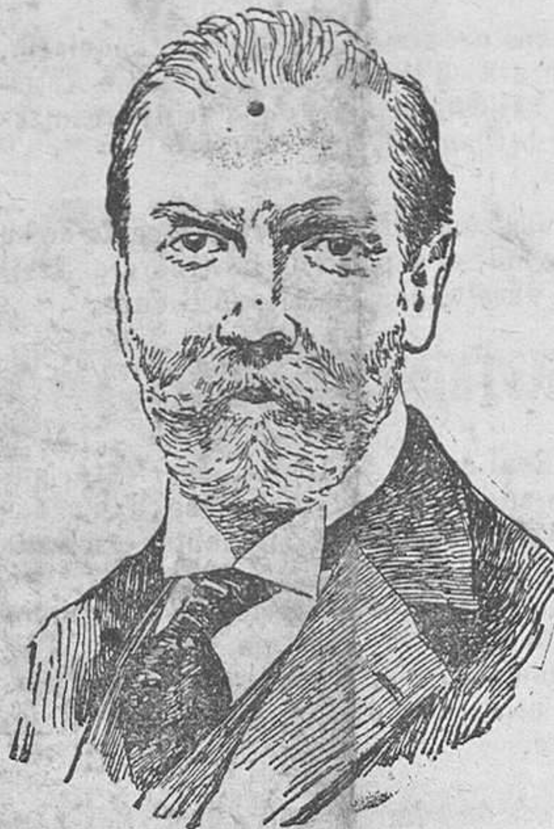
Mr. Charles Eovus Hughes, famoso juriscónsulto norteamericano, que por divergencias políticas ha presentado la dimisión de la Secretaría de Estado, que desempeñaba.

Federación Latina», de Huelva, ni «Gil Blas», de Madrid, periódicos que publicaron entonces el sucedido.