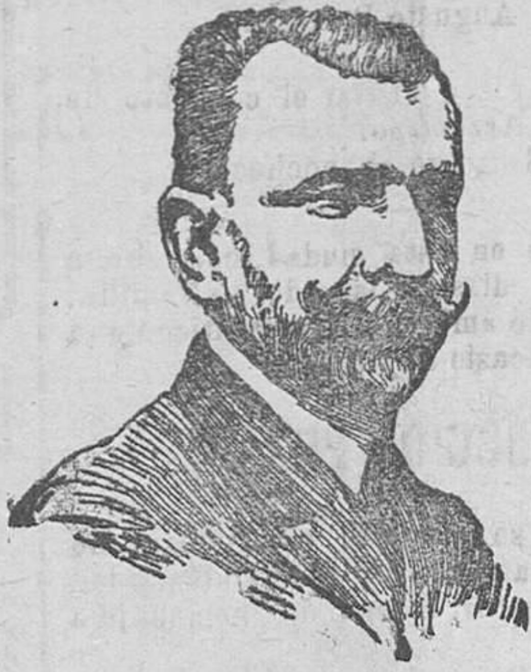
El conde de Gimeno, ilustre catedrático de Medicina jubilado que leyó el discurso de apertura del curso en la Real Academia de Medicina, disertando brillantemente sobre cólicos hepáticos.

dados a tus criaturas finas; al copo leve de los lirios y a las pequeñas clavelina; guarda su forma con cariño y palpala con emoción, tirita al viento como un niño, ¡es parecido a un corazón!