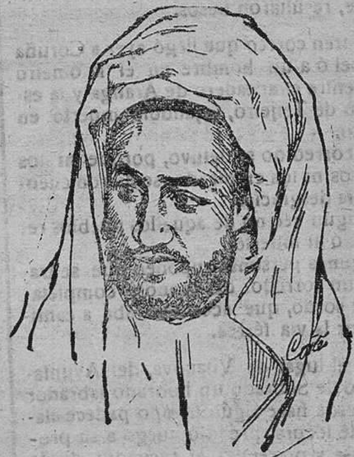
Abd-el-Kader, moro amigo de España

A la intranquilidad de ayer, domingo, ha sucedido un sosiego ostensible. Duro fué el combate con motivo de llevar el convoy al Atalayón, y hubo de ser puesto en juego gran aparato de guerra. Más de mil quinientos hombres entraron en acción. Las bajas fueron, oficialmente, 53, y entre ellas, tres tenientes muertos.